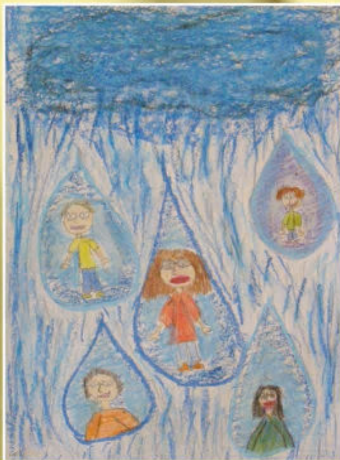
Klaudia Kozicka - SP w Kielnarowej