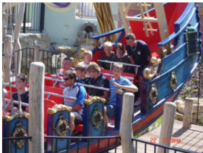
Po meczu z Autriakami, przyszedł czas na odpoczynek