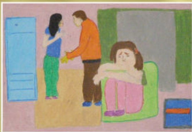
Iwona Baran - PG Tyczyn