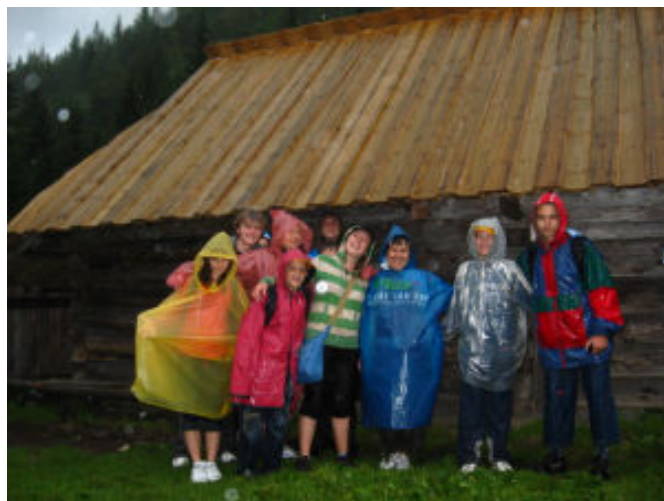
Zmoknięci ale szczęśliwi

w gorących wodach oddawaliśmy się wodnemu szaleństwu. Nasza grupa okazała się zgranym zespołem mogącym na sobie polegać. Należy też podkreślić, iż najmniejszym należy się pochwała za wytrwałość oraz niezłomność w górskim wędrowaniu.