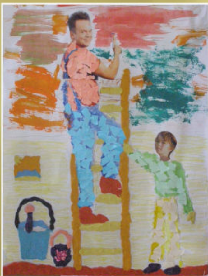
„Remont” - Arkadiusz Krztoń SP w Hermanowej