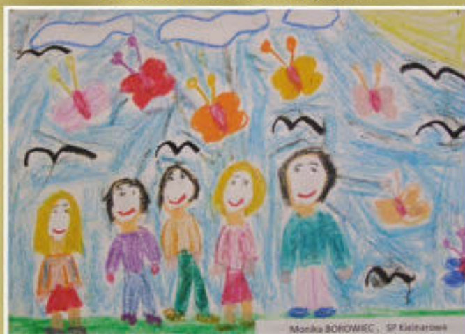
Monika BOROWIEC - SP Kielnarowej