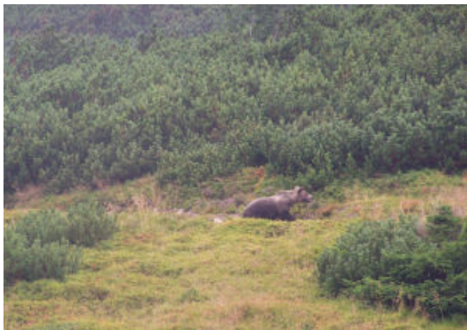
Na górskim szlaku spotkaliśmy niedźwiedzia

W niedzielę po śniadaniu i pożegnaniu się z gospodarzami, udaliśmy się na Mszę Świętą w kaplicy w Białym Dunajcu. Następnie w naszym programie były Termy Podhalańskie, gdzie