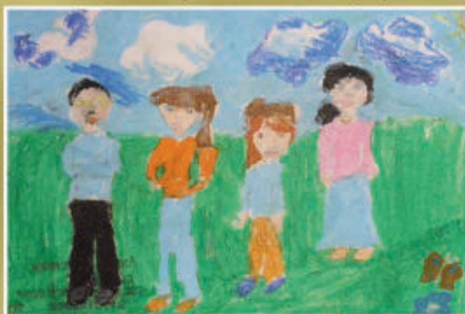
Aneta Pomianek - SP w Matysówce