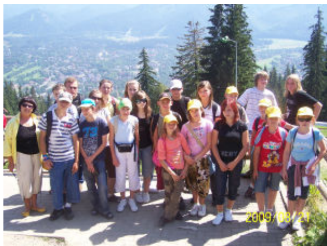
Uczestnicy wycieczki na Gubałówce

Pierwszego dnia dotarliśmy do Zakopanego, gdzie kolejką wyjechaliśmy na Gubałówkę, a po powrocie, udaliśmy się pieszo do Sanktuarium Matki Bożej Fatimskiej na Krzeptówkach.