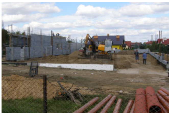
Budowa supermarketu „Biedronka”

Zdarzenie nie zakłóciło prac przy budowie nowego supermarketu. Jak powiedział nam kierownik budowy - Grzegorz Fialek - zakończenie prac planowane jest na listopad, a prawdopodobne otwarcie „Biedronki” nastąpi już w grudniu.