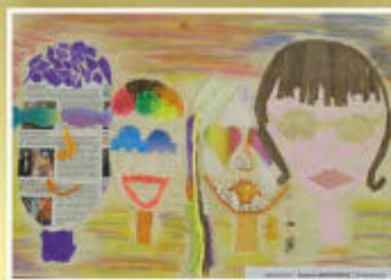
Paulina Wojtowicz - SP w Budziwoju