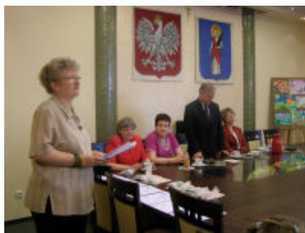
Oficjalne ogłoszenie wyników i wręczenie nagród w sali narad UM w Tyczynie