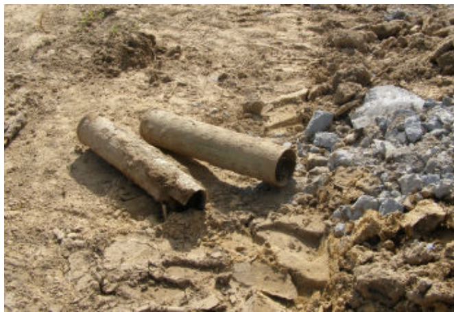
Łuski po pociskach

Tuż po godzinie 15 na teren budowy przyjechała jednostka saperów, która wywiozła niebezpieczne materiały. W sobotę saperzy przyjechali ponownie do Tyczyna. Przy pomocy specjalistycznych urządzeń, sprawdzili czy na placu budowy nie znajduje się więcej niebezpiecznych pocisków.