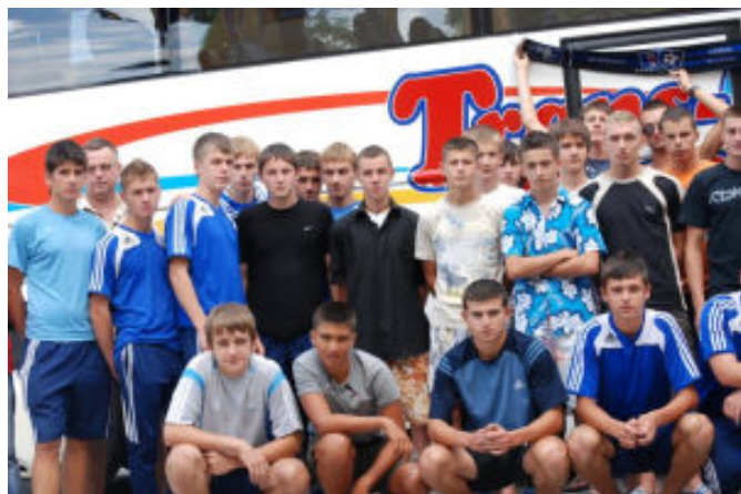
Zawodnicy Strugu wraz z kolegami z Ukrainy przed wyjazdem do Niemiec

Na tym jednak nie koniec, bowiem początkiem sierpnia nasza reprezentacja juniorów młodszych wyjechała na obóz sportowy do Gersheim (Kraj Saary) nieopodal granicy niemiecko-francuskiej. Nieco starsze nadzieje piłkarskie Strugu, wspólnie