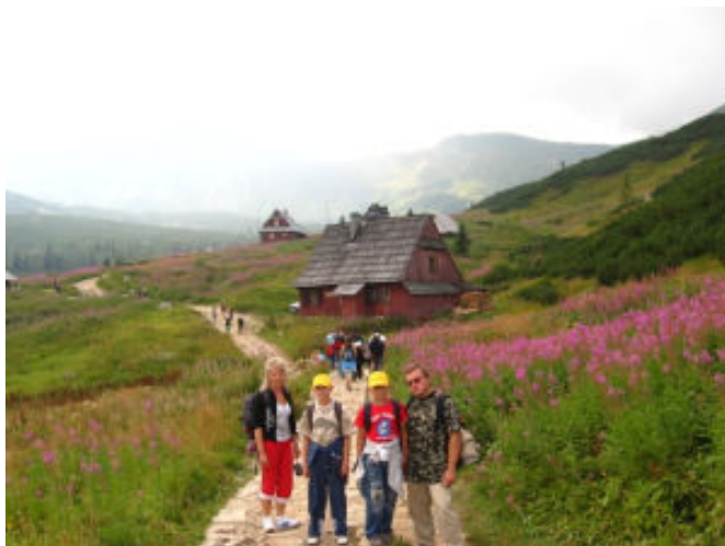
Idziemy w stronę Kasprowego Wierchu

Drugiego dnia wyjechaliśmy do Zakopanego, skąd spod kolejki na Kasprowy Wierch wyruszyliśmy w Tatry szlakiem do