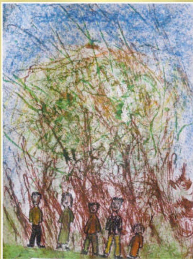
Szymon Ziarnik - SP w Budziwoju