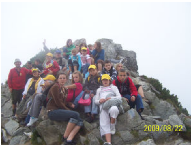
Wychodzimy na Kościelec Mały

Doliny Gąsienicowej, której nazwa pochodzi od nazwiska dawnych właścicieli. Dotarliśmy do schroniska Murowaniec położonego na wysokości 1500 m n.p.m. w Dolinie Suchej Wody Gąsienicowej. Zostało ono zbudowane w latach 1921 - 1925, a następnie przebudowywane do obecnego okazałego kształtu. W nim zrobiliśmy przerwę, dla zebrania energii na dalszą trasę. Naszym celem było zdobycie szczytu Kościelec Mały 1863 m n.p.m. oraz obejrzenie jezior w Kotle Gąsienicowym. W drodze ze schroniska podziwialiśmy cuda natury i piękno gór. Nasz szlak przeciął niedźwiedź, co zostało utrwalone fotograficznie. Ciągłe wspinanie się pod górę było dla niektórych uciążliwe, lecz nie ma niczego bez wysiłku. Tak więc wszelka słabość została przełamana dla osiągnięcia szczytu. Kiedy weszliśmy na szczyt, widok na panoramę gór i jezior zachwyił swym urokiem i majestatem. Po krótkim odpoczynku na górze przystąpiliśmy do zejścia ku Czarnemu Stawowi Gąsienicowemu znajdującemu się na wysokości 1624 m n.p.m. Sam staw ma powierzchnię 17,94 ha oraz głębokość 51 m, znajduje się na nim wysepka porośnięta kosodrzewiną o powierzchni 310 m 2 . Kolor wody ma barwę szafirową. Po odpoczynku przy Czarnym Stawie udaliśmy się w drogę powrotną, pochwyceni przez zmianę pogody na desz-