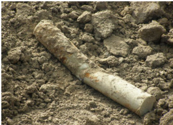
Niewypał znaleziony na budowie to pocisk artyleryjski o długości 50 cm, pochodzący z czasów II wojny światowej

Na placu budowy supermarketu „Biedronka” w Tyczynie odkryto pozostałości po II wojnie światowej.