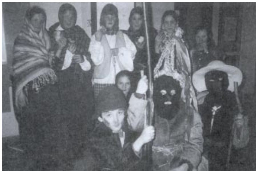
Powiatowy Przegląd Folkloru Obrzędowy dla Dzieci „Szczodroki”