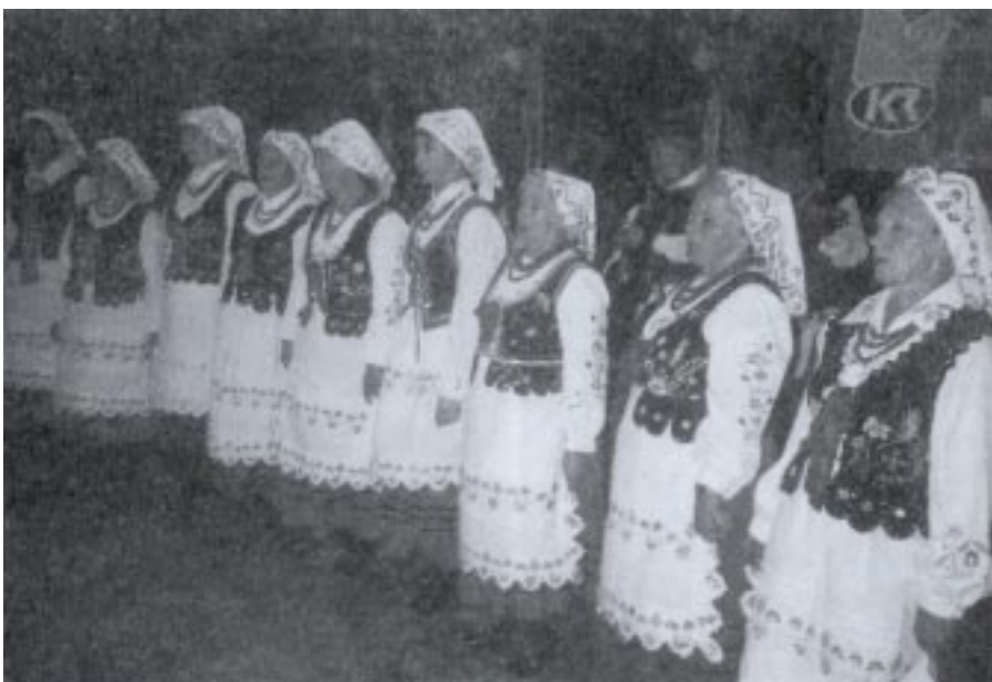
„Matysowianki” podczas Wojewódzkiego Przeglądu Wiejskich Zespołów Śpiewaczych