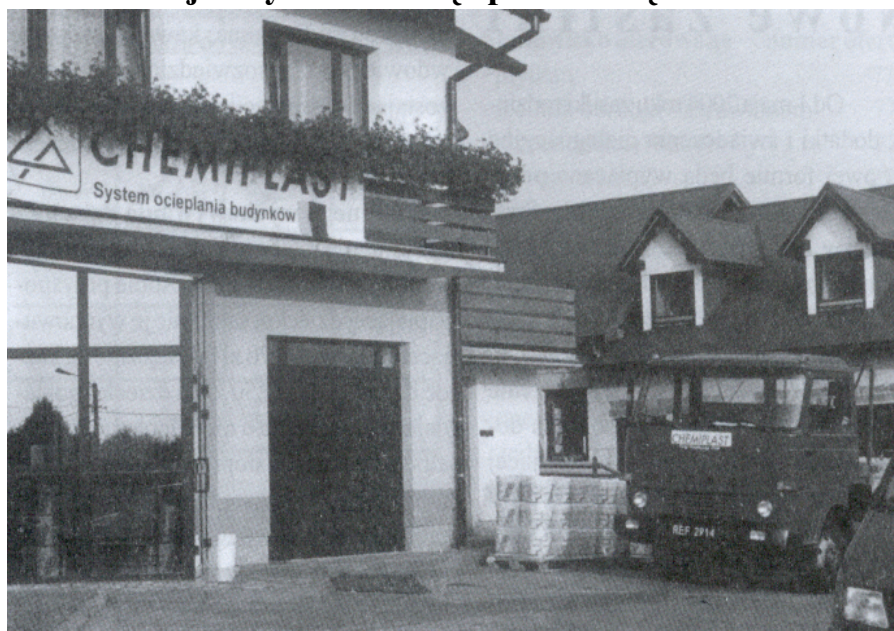
Siedziba firmy w Białej (u góry)

Poniżej: budynek na osiedlu Nowe Miasto w Rzeszowie, elewacja wykonana przez firmę „Izol-Mont”