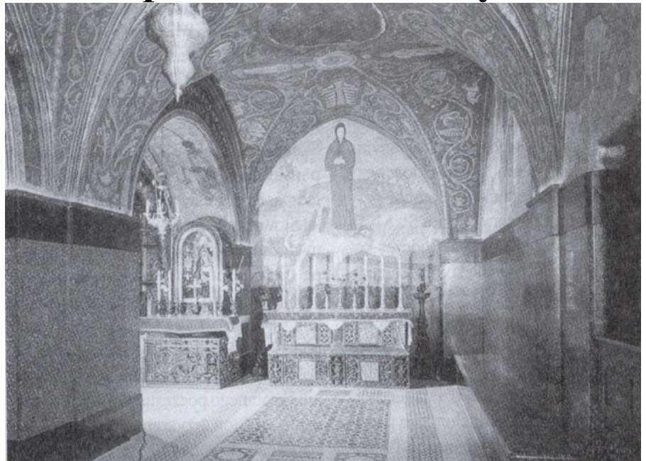
Kaplica w Bazylice Świętego Grobu (IV w. n.e.)

Najdroższym klejnotem tego miejsca jest franciszkańskie sanktuarium Getsemani. Już w IV w. stała tutaj bizantyjska świątynia mająca w prezbiterium cenną relikwię - „Skałę Agonii”, na której Syn Boży klęczał rozmodlony przeżywając straszne cierpienia fizyczne i duchowe. Na początku VII w. Persowie zniszczyli tę świątynię. W XII w. na jej ruinach Krzyżowcy zbudowali kościół, po ich klęsce zamieniony na stajnię, a później zburzony. Od tam chrześcijanie nabożeństwa odprawiali w Grocie, która od 1392 r. należała do Franciszkanów. W XVII w. zakonnicy wykupili od muzułmanów ruiny tych świątyń wraz z Ogrodem Oliwnym i ośmioma prastarymi drzewami oliwkowymi. Na początku XX w. Franciszkanie przystąpili do budowy nowej świątyni, trzeciej już z kolei na tym miejscu. Świątynię poświęcono Agonii Chrystusa. Najcenniejszą relikwią, jak kiedyś, jest skała, która upamięt-