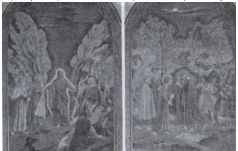
Mozaiki zdobiące wnętrze Bazyliki Narodów w Getsemani

że klęczy u źródeł wiary, w miejscu gdzie Bóg okazał swoją nieskończoną miłość i wszedł na trwałe w dzieje rodzaju ludzkiego i każdego z nas. Od samego początku chrześcijanie odwiedzali to miejsce, modlili się i przechowywali w pamięci te dwa wydarzenia - śmierć i zmartwychwstanie Pana Jezusa. Bazylika Grobu Bożego przechodziła smutne koleje losu. Wielokrotnie burzono ją i odbudowywano. Obecnie opiekę nad świątynią, tą z czasów Krzyżowców, sprawują czterej współwłaściciele - Grecy, katolicy, Ormianie i Koptowie. W Kaplicy Kalwarii pod ołtarzem, który stoi na szczycie Golgoty, gdzie był wbity Krzyż Chrystusa modlimy się. Bez pośpiechu adorujemy Chrystusa Ukrzyżowanego. O to miejsce ocieramy krzyże i inne dewocjonalia zakupione