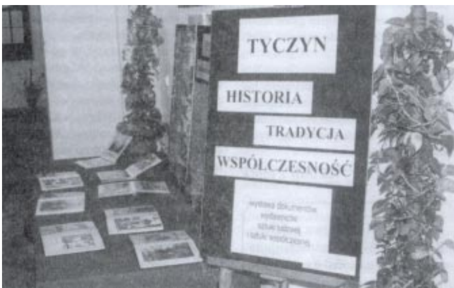
Wystawa dokumentów, wydawnictw, sztuki ludowej i współczesnej