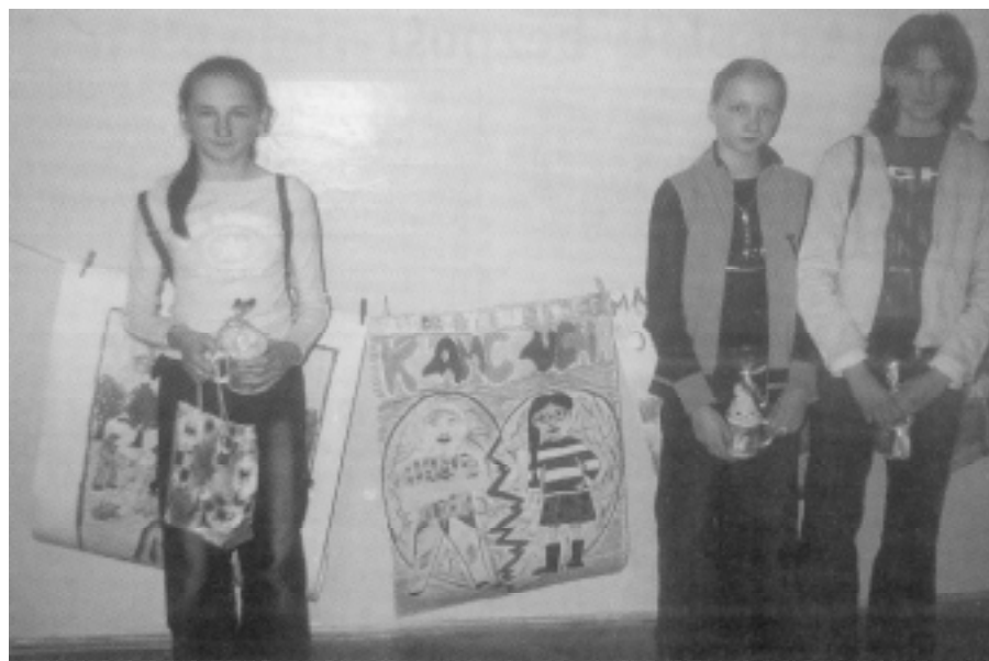
Finalistki konkursu plastycznego (od lewej):