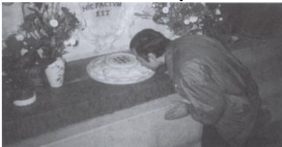
Rok 1994. Autor tekstu w Nazarecie, w Grocie Zwiastowania, przy ołtarzu z napisem: „Tu Słowo stało się Ciałem”

W tym czasie Nazaret był osadą składającą się z kilkanastu grot-mieszkań wydrążonych w skalistym zboczu górskim. Urodzajna okolica służyła mieszkańcom Nazaretu swym zbożem na chleb, winną latoroślą na wino, kwiecistymi łąkami na rozweselenie duszy i paszą dla bydła. Góry, które wznoszą się wokół miasteczka