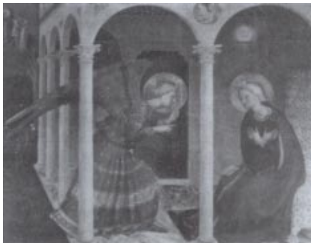
„Zwiastowanie” - obraz Beato Angelico

Opuszczając Nazaret można się dziwić, że w miejscu przesiąkniętym Ewangelią oraz obecnością Jezusa, Marii i Józefa życie toczy się jak gdzie indziej - hałas ruchu ulicznego, handel i ludzie goniący za własnymi sprawami. To przypomina nam jakże bardzo ważną sprawę, że tak jak w owej codzienności Nazaretu dokonało się Zbawienie świata, tak i przez nasze codzienne, szare życie, ale przeżywane w łączności z Jezusem i w miłości do Matki Bożej i św. Józefa, ma dokonać się zbawienie każdego z nas.