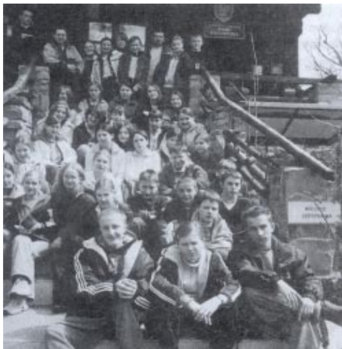
Gimnazjaliści przed wejściem do Ośrodka Edukacyjnego Babiogórskiego Parku Narodowego