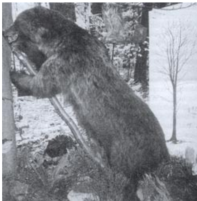
Ekspонат z wystawy stałej Muzeum Babiogórskiego