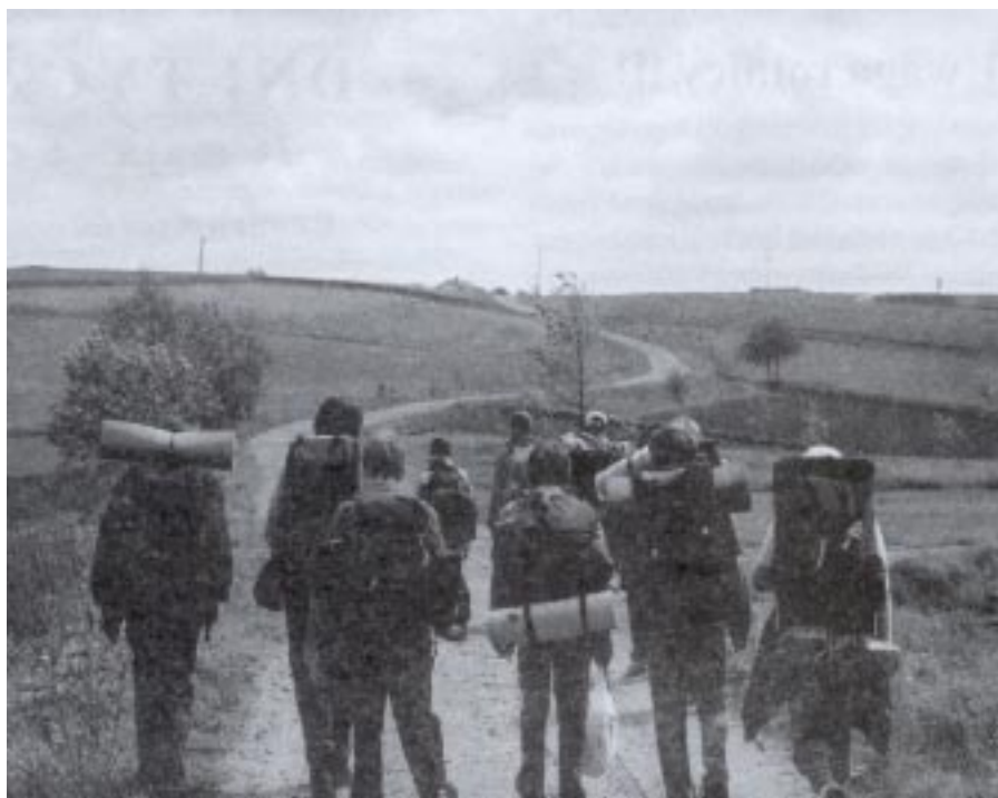
Grupa młodzieży wędrująca przez Łany Bielskie