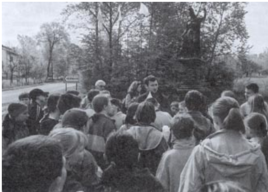
Odprawa uczestników marszu na orientację przed wyruszeniem na trasę

W zawodach startowały też ekipy SP z Pustyni k. Dębicy oraz SP Nr 27 z Rzeszowa. Na ogłoszenie wyników przybył burmistrz Gminy Tyczyn Kazimierz Szczepański , który w ciepłych słowach powitał uczestników, pogratulował zwycięzcom i zaprosił na kolejne imprezy, które będą organizowane na terenie Gminy. W zakończeniu marszów brała także udział