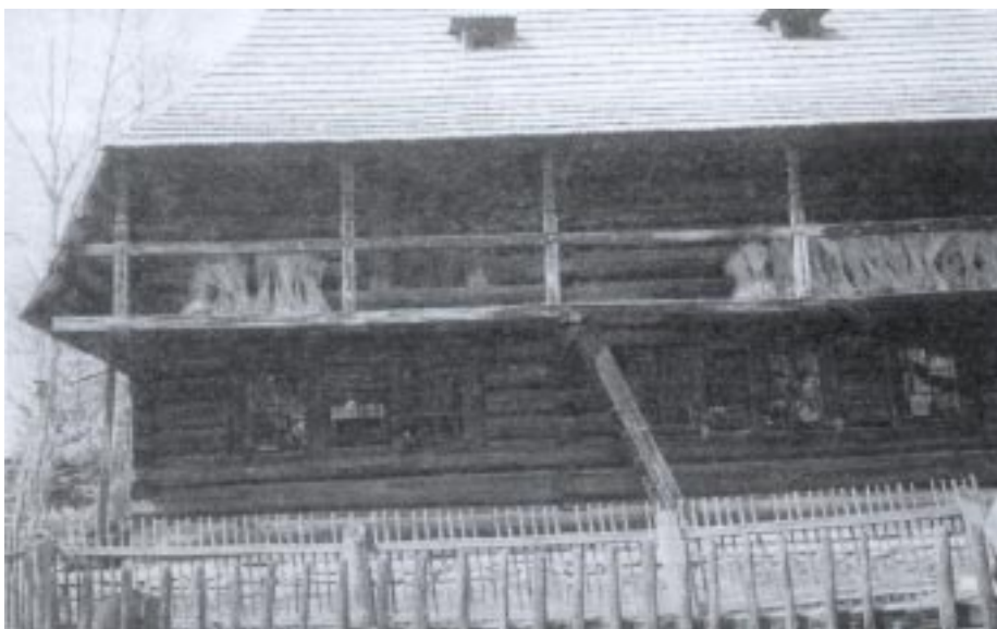
Skansen Orawski w Zubrzycy Górnej - chałupa Paś-Filipka