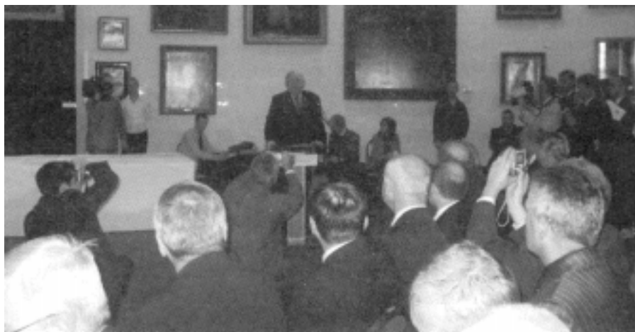
Marszałek Sejmu Józef Oleksy składa gratulacje laureatom

mieszkańców i inwestorów. Priorytetem w tym zakresie, obok tworzenia nowych miejsc pracy, są najczęściej media techniczne, inwestycje drogowe, w dziedzinie ochrony środowiska i zaopatrzenia w wodę oraz inwestycje oświatowe.