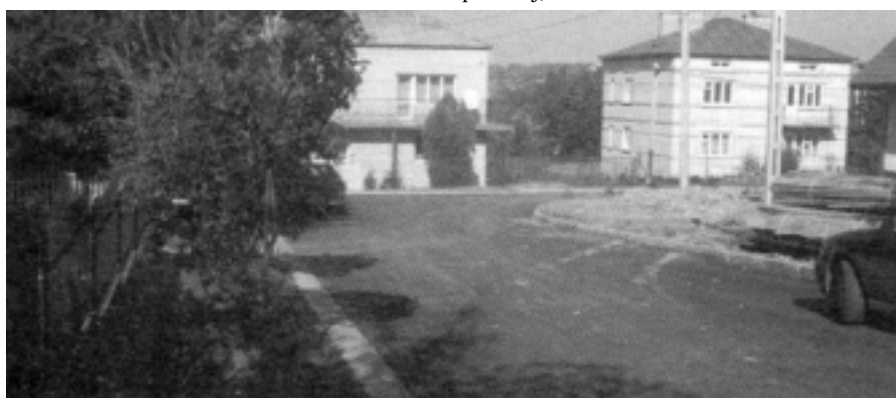
...łączenie między ul. Konopnickiej i Sienkiewicza

Wartość wykonanych prac wynosi 333.776 zł, z czego pomoc finansowa uzyskana z programu SAPARD stanowi kwotę 133.708,91 zł (70% kosztów kwalifikowanych), natomiast środki własne Gminy wynoszą 200.067 zł. 10 września br. Gmina złożyła w Agencji Restrukturyzacji i Modernizacji Rolnictwa w Rzeszowie niezbędne dokumenty, na podstawie których Agencja prześle na nasze konto kwoty przyznanych dotacji.