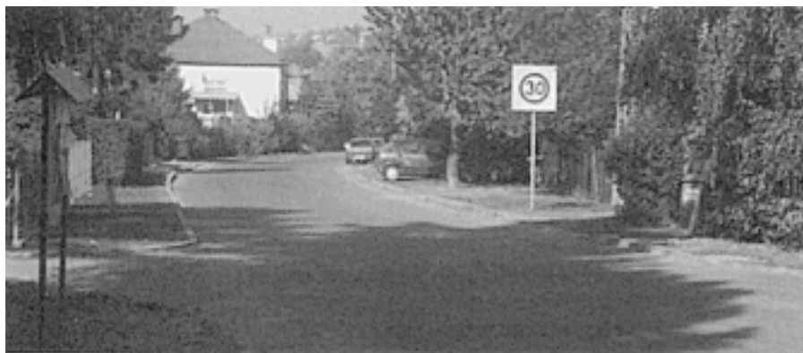
Osiedlowe ulice są teraz wygodne i bezpieczne: ciąg ulicy Betańskiego i Wodzikich,