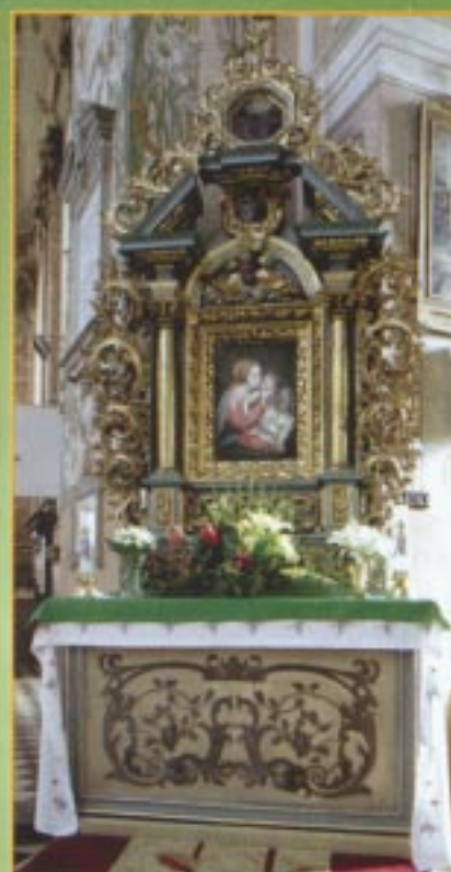
Ołtarz MB z Dzieciątkiem