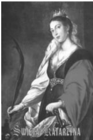
Obraz św. Katarzyny w ołtarzu głównym kościoła w Nowym Targu

Św. Katarzyna patronuje zakonowi katarzynek, filozofom chrześcijańskim,