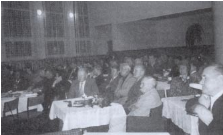
Sala Domu Ludowego w Kielnarowej wypełniona była po brzegi