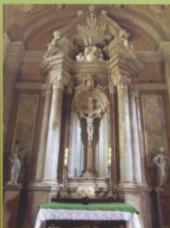
Ołtarz św. Trójcy