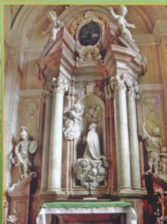
Ołtarz św. Stanisława Kostki