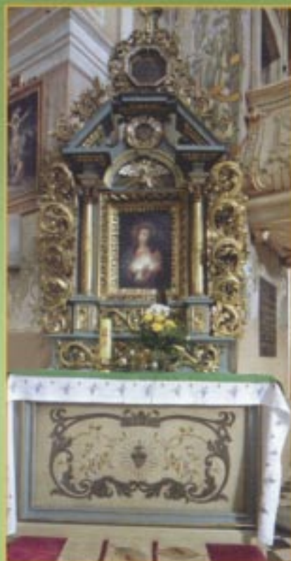
Ołtarz Najśw. Serca Pana Jezusa

Biała Borek Stary Budzów Hermanowa Kielnarowa Matysówka Tyczyn