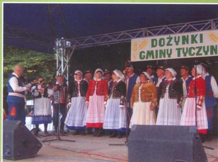
Wrzesień 2005. Dożynki Gminy Tyczyn.