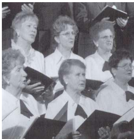
Śpiewa parafialny chór z Tyczyna