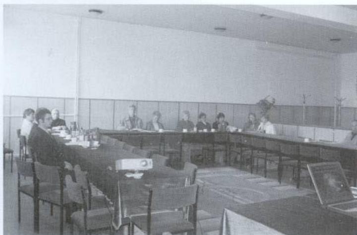
Przedstawiciele organizacji pozarządowych na spotkaniu w Urzędzie Gminy i Miasta

14 kwietnia 2005 r. w Urzędzie Gminy i Miasta w Tyczynie odbyło się spotkanie z organizacjami pozarządowymi w ramach wdrożenia akcji Przejrzysta Polska. W spotkaniu udział wzięli przedstawiciele 12 stowarzyszeń z terenu gminy. Podczas spotkania przedstawiciele Urzędu zachęcali zebranych do współpracy przy tworzeniu „samorządu z zasadami”. Rozdano ankiety dotyczące oceny potrzeby utworzenia punktu informacyjnego, który zwiększyłby możliwość dostępu do informacji o usługach świadczonych przez Urząd Gminy. Zadanie to zostało pozytywnie ocenione przez stowarzyszenia. Uczestnicy mieli także możliwość wybrania z listy tych zadań, które ich zdaniem powinny zostać dodatkowo zrealizowane. Opinia ta miała pomóc skorygować podjęte zadania, aby wprowadzane rozwiązania faktycznie służyły mieszkańcom i były dostosowane do ich potrzeb.