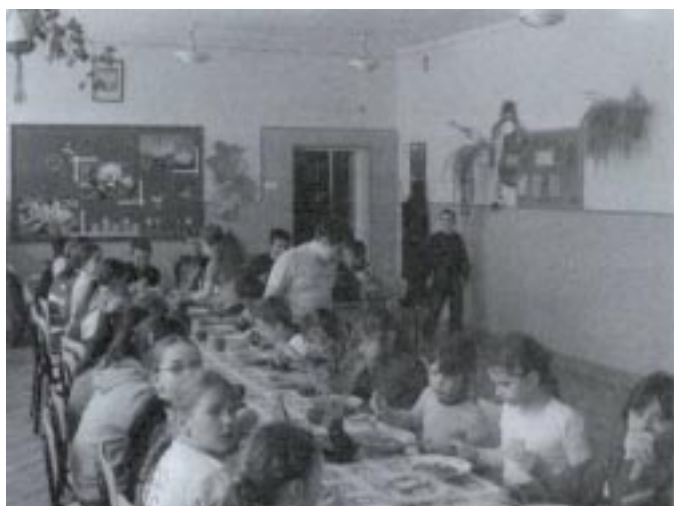
Szkolna świetlica (jadalnia)

Tegoroczne ferie też były czasem pracy, tym razem w świetlicy szkolnej, która zarazem pełni funkcję jadalni. Z podłogi zerwano sfatygowane płytki PCV a na ich miejsce poło-