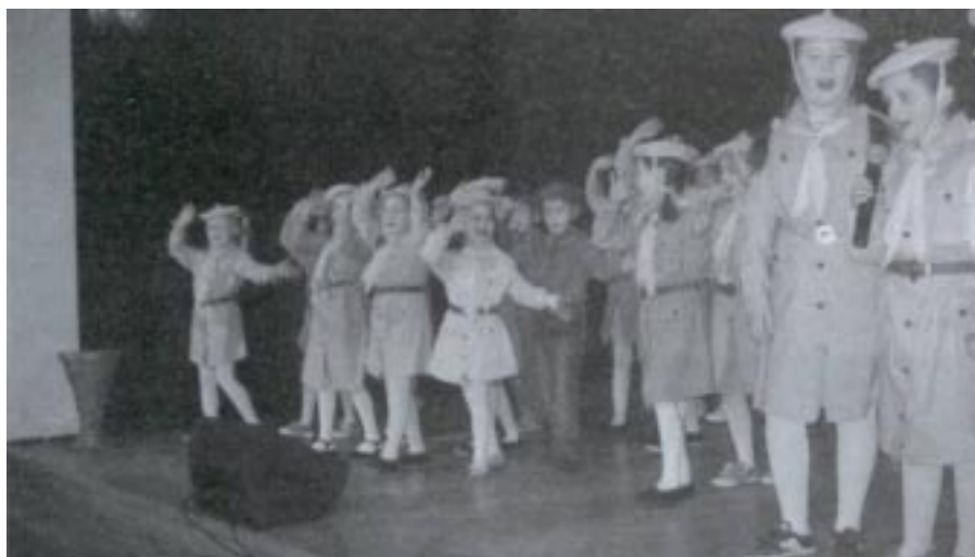
Gromada zuchowa „Wesołe Krasnoludki”