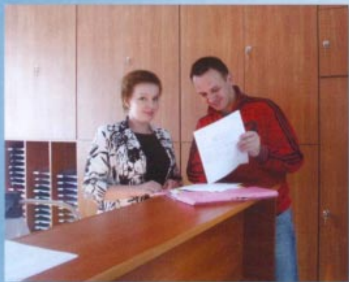
Biuro informacji i obsługi mieszkańców

Karty Usług są wydawane są w Biurze Informacji i Obsługi Mieszkańców, gdzie każdy mieszkaniec gminy