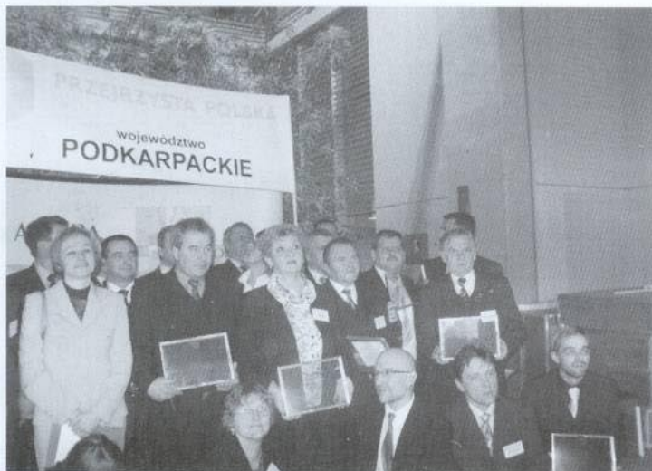
Burmistrz Gminy Tyczyn w gronie narodzonych samorządowców z województwa podkarpackiego