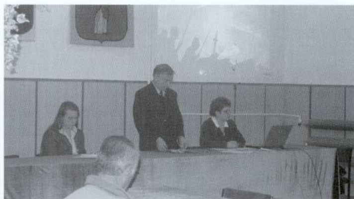
Spotkanie przedstawicieli Urzędu z organizacjami pozarządowymi