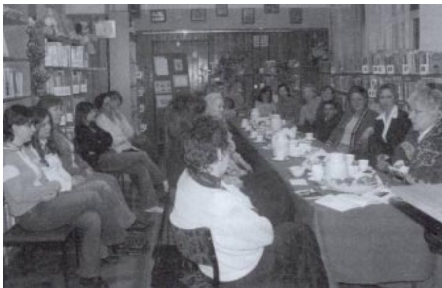
Uczestnicy wieczorku poetyckiego