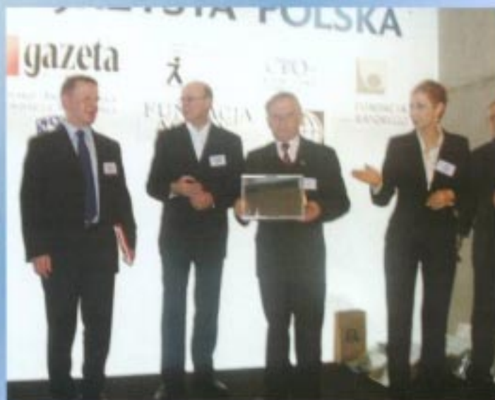
Burmistrz Kazimierz Szczepański z certyfikatem akcji „Przejrzysta Polska”