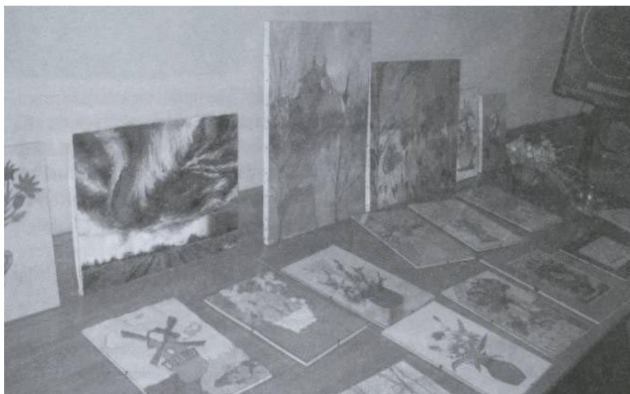
Prace podarowane na aukcję