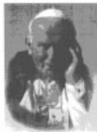
Papież Jan Paweł II

DOCTOR HONORIS CAUSA UNIVERSYTETU RZESZOWSKIEGO