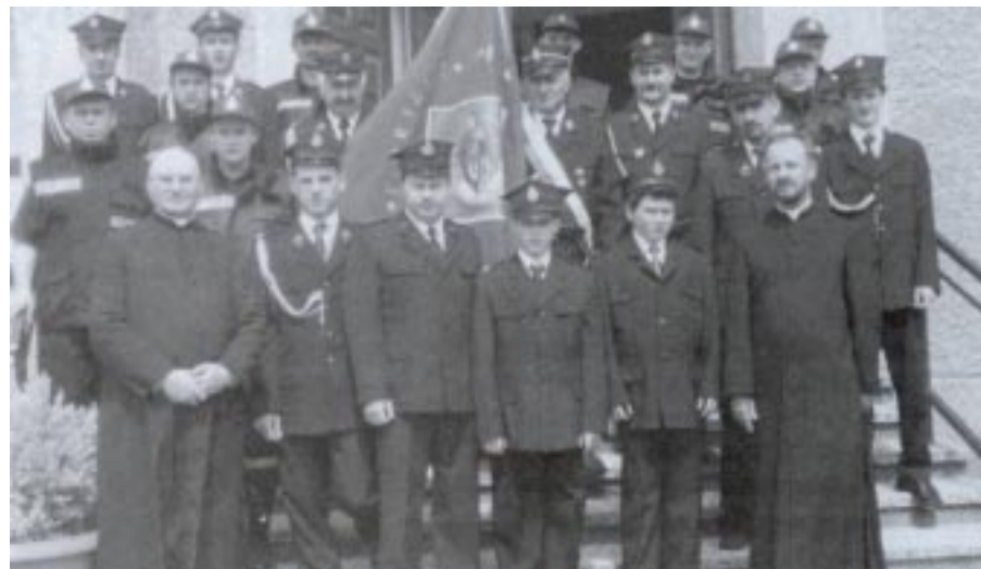
Strażacy OSP Kielnarowa po Mszy św. w dniu 7 maja br.