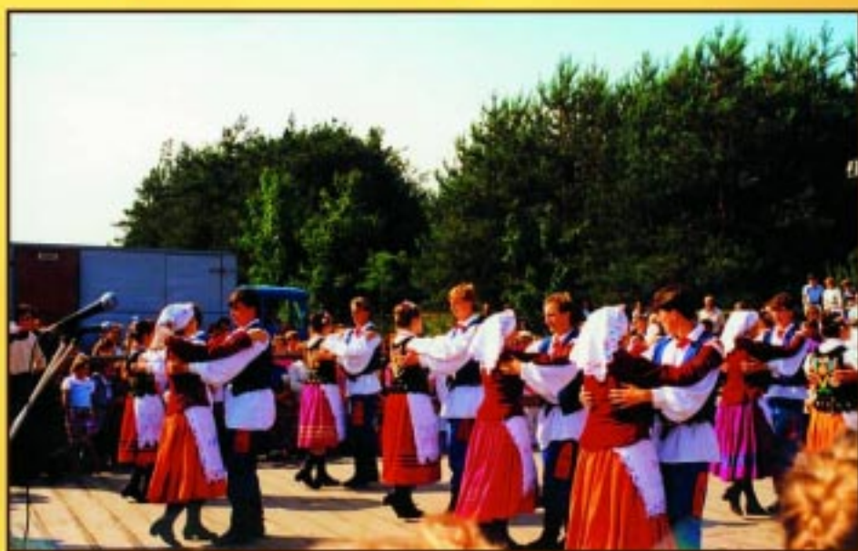
12 czerwca 1994. Plenerowy występ w Katowickim Parku Leśnym; gospodarzami tej imprezy byli „Masztalscy”.

Lipiec 1995. Zespół doskonale wkomponował się w atmosferę imprezy ogólnopolskiej „Country w Bieszczadach”, jaka odbywała się w amfiteatrze w Lesku. Wyróżnieniem był występ w towarzystwie gwiazd muzyki country.