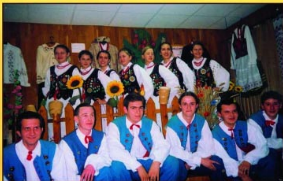
Rok 2005. Zespół uświetnił odbywającą się w Klubie Country uroczystość 40-lecia Koła Gospodyń Wiejskich w Budziwoju-Kolonii, przedstawiając tańce amerykańskie, wiankę tańców krakowskich i rzeszowskich oraz poloneza.