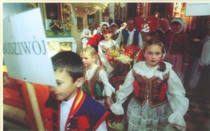
Członkowie Zespołu „Budziwojce” i dzieci w ludowych strojach w orszaku dożynkowym