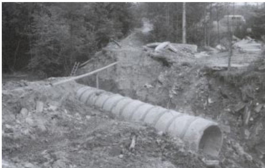
Przebudowa przepustu w drodze Matysówka II Strona

Trwają prace przy przebudowie przepustu o średnicy 200 cm o długości 20 mb. w ciągu drogi gminnej. Dokonano rozbiórki starego przepustu, oczyszczono kręgi betonowe, wykonano podbudowę pod nowy przepust, ułożono kręgi betonowe, wykonano przyczółki betonowe przy wlocie i wylocie przepustu. Obecnie trwają prace polegające na zagęszczeniu nawierzchni przy przepuszczeniu. Termin zakończenia prac przy przepuszczeniu i przebudowie drogi przewiduje się na koniec września 2006 r. Wartość wykonanych prac wyniesie 149.961 zł. Wykonawcą robót jest MPDiM Rzeszów.