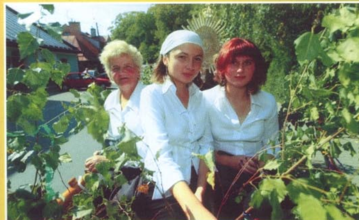
Umajony wóz z dożynkowym wieńcem z Czerwonek