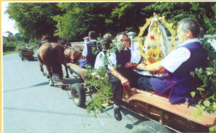
Bryczka z wieńcem z Białej