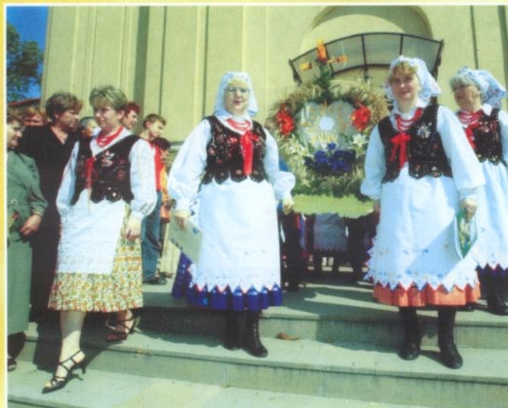
Wieniec z Tycyna