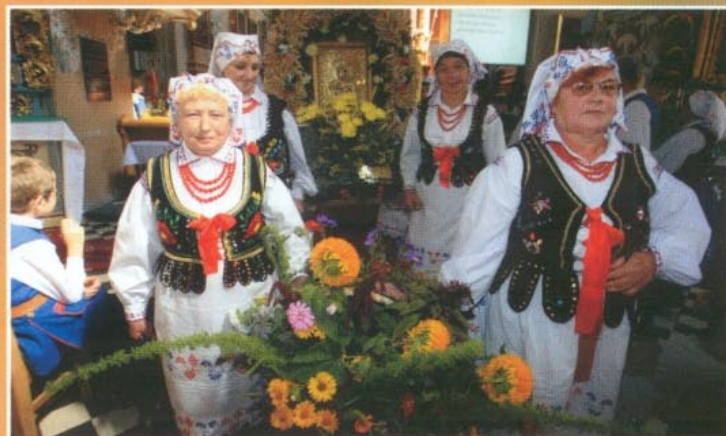
Wieniec z Matysówki