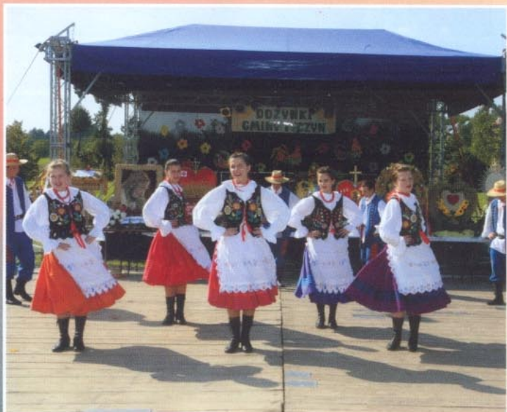
Występ Zespołu „Country” z Budziwoja Kolonii