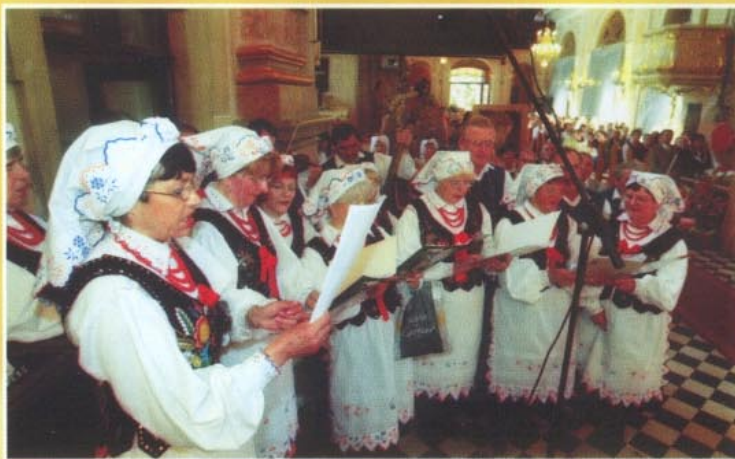
„Tyczyniacy” pięknie śpiewali podczas dziękczynnej Mszy św.