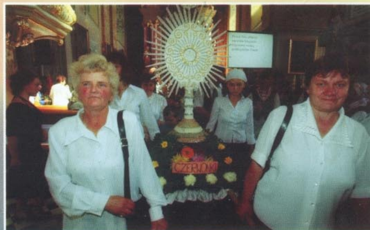
Wieniec w kształcie hostii z Czerwonek