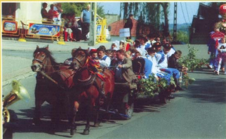
Po Mszy św. dożynkowy korowód ruszył na plac „Za Pałacem”. Nz. przystrojony drabiniasty wóz z Budziwoja