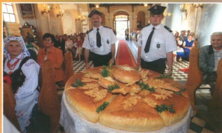
Strażacy z Borku Starego z dożynkowym chlebem