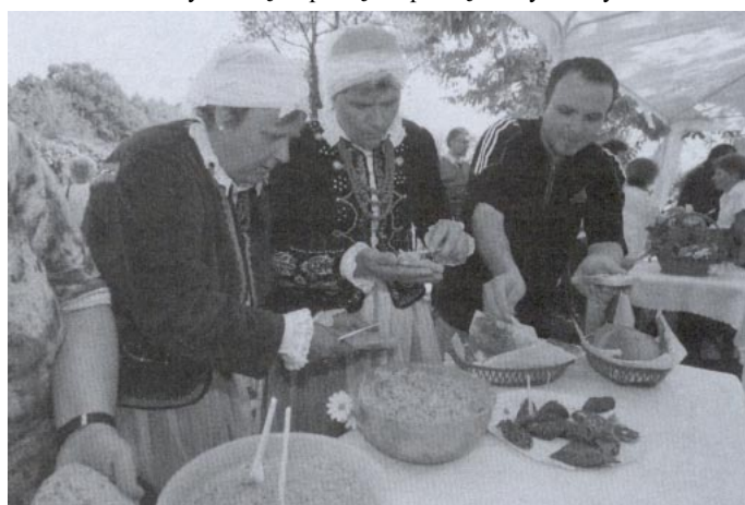
Każda miejscowość przygotowała stół z regionalnym jadłem. Nie brakło tam wybornego smalcu ze skwarkami, pierogów, proziaków...