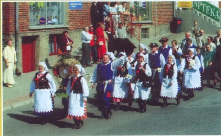
Wieniec z Tyczyna nieśli „Tyczyniacy”