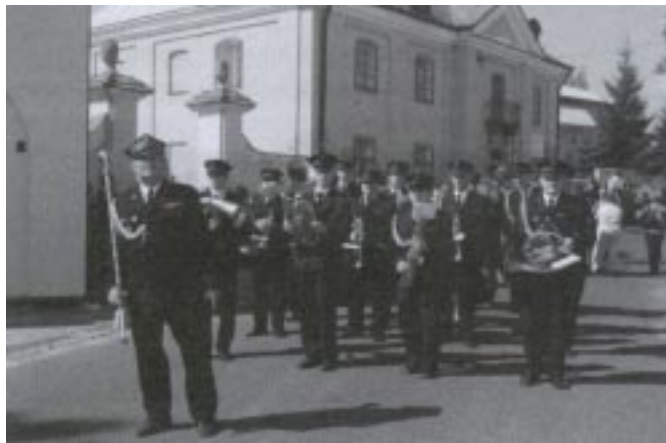
Barwny korowód prowadziła Orkiestra Dęta z Borku Starego