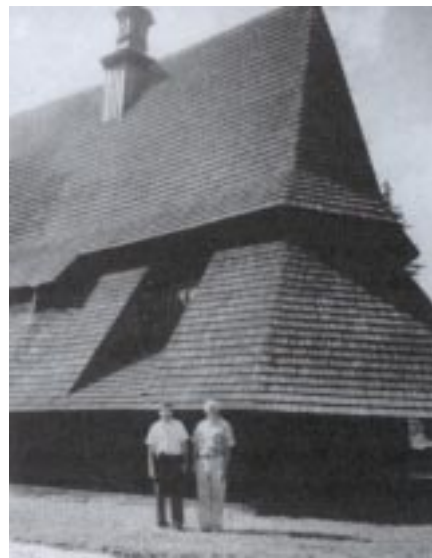
Cerkiew w Sekowej zaliczona jest do światowego dziedzictwa kultury