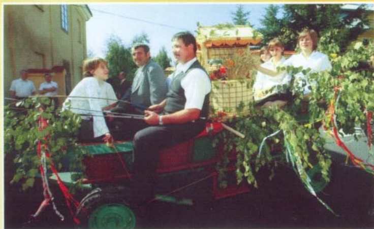
Na bryczce, w asyście konnej banderii - wieniec z Kielnarowej