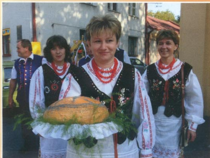
Dożynkowe dary z Białej