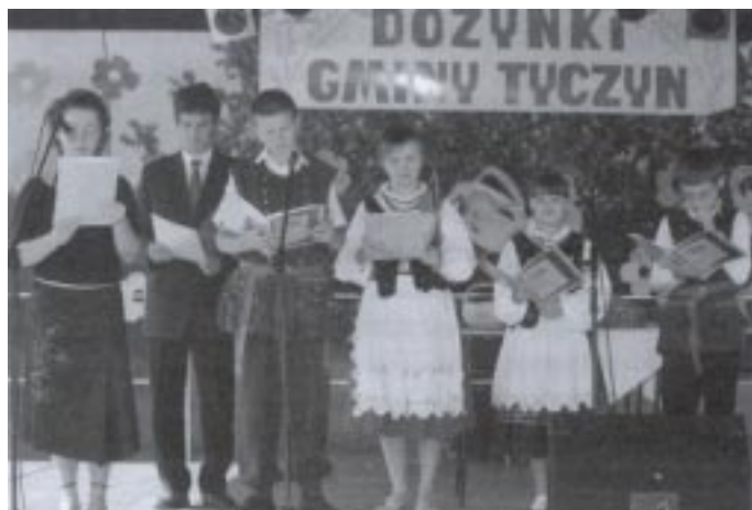
Dożynkową imprezę rozpoczęli recytatorzy

Wśród dożynkowych darów były kwiaty, miód i bajecznie kolorowe kosze owoców i warzyw