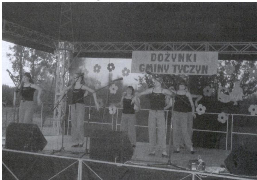
Na pożegnanie lata zatańczyły „Katarzynki”