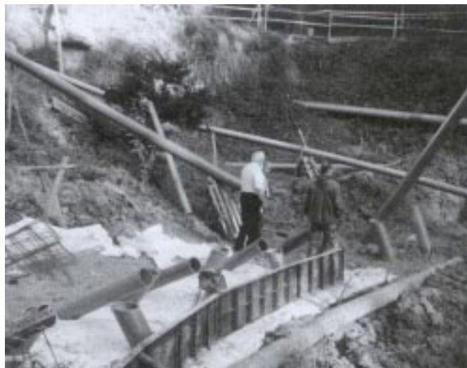
Trwają prace przy zabezpieczeniu osuwiska

17 sierpnia 2006 rozpoczęto roboty budowlane pod nazwą „Zabezpieczenie osuwiska w rejonie Kościoła Klasztoru