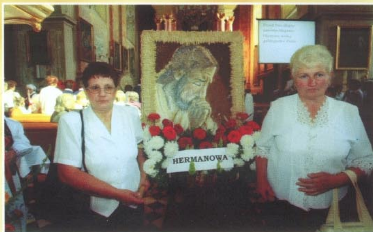
Wieniec z Hermanowej