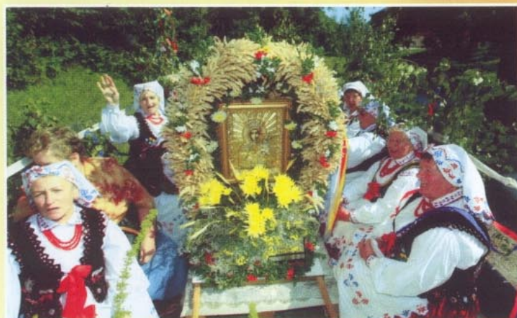
Rozśpiewany wóz „Matysowianek”