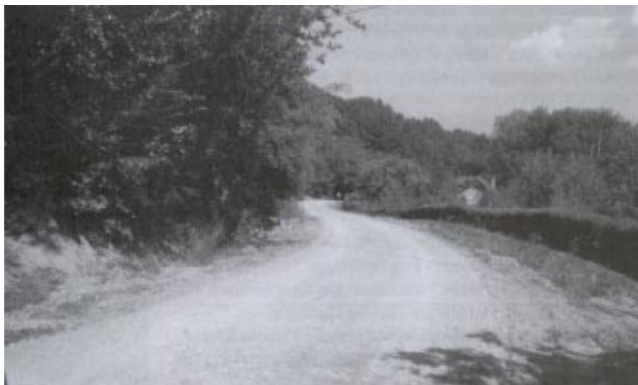
Droga Hermanowa Kościół Łazy po remoncie

Obecnie wykonywane są prace przy przebudowie drogi z pospółki i tłucznia kamiennego. Przebudowa drogi obejmuje odcinek o długości 440 mb. łącznie z położeniem masy bitumicznej na ogólną kwotę 108.558 zł. Termin zakończenia prac planowany jest na 23. września br. Wykonawcą robót jest DROGBUD Strzyżów.