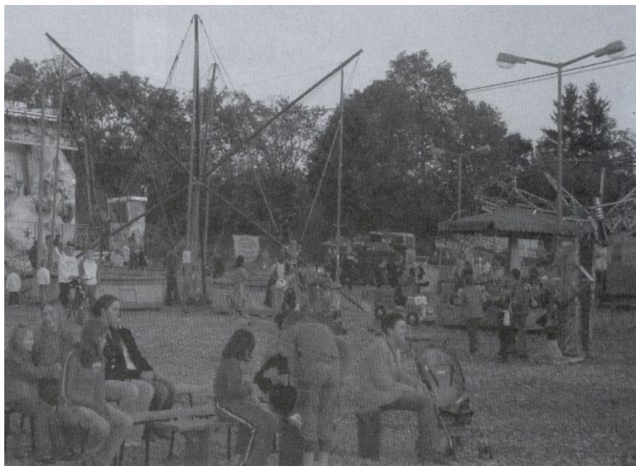
Dla najmłodszych atrakcją było wesołe miasteczko

Do atrakcji naszego pobytu w Kamiannej należała degustacja miodu i pasiecznego grzańca.