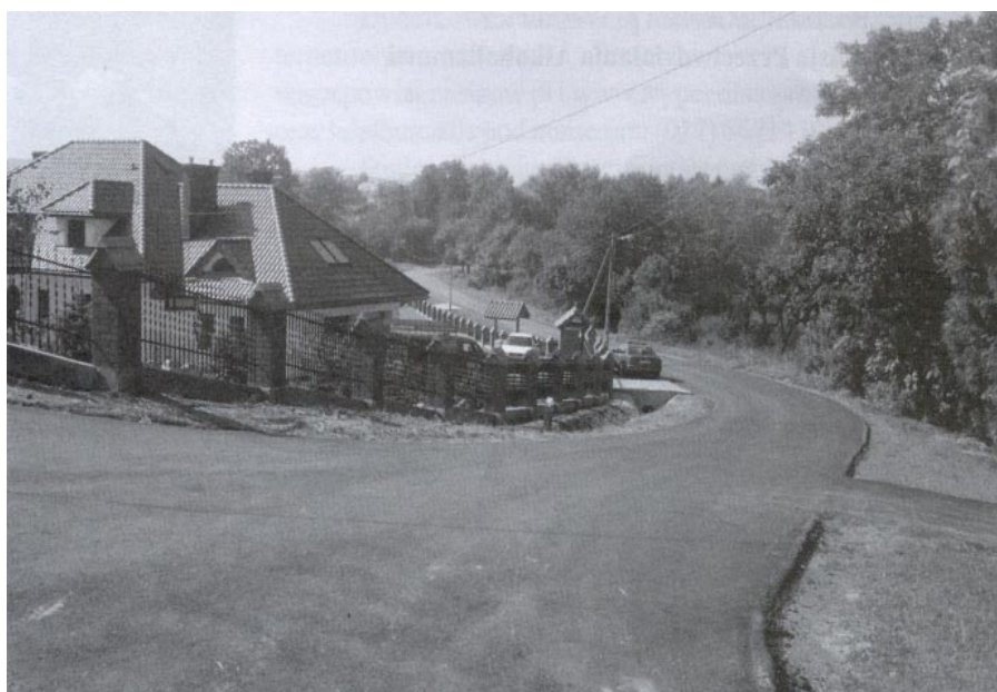
Odnowiona ul. Ogrodowa w Tyczynie

Wydana została decyzja o warunkach zabudowy i zagospodarowania te-