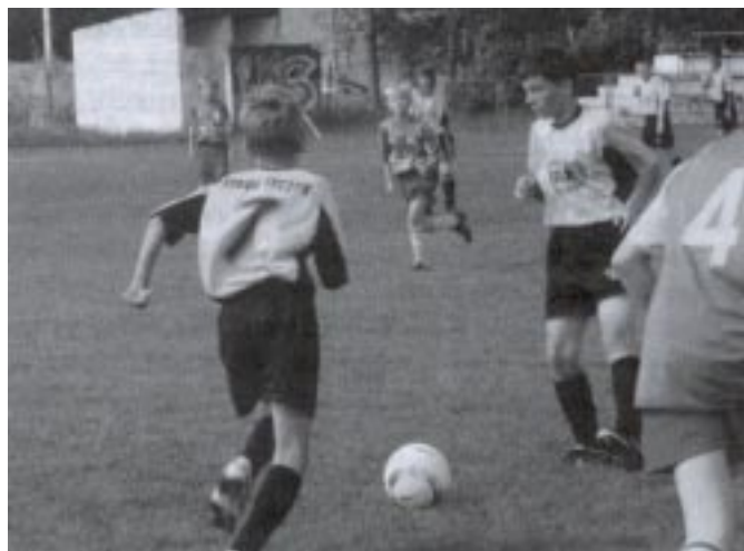
Pojedyńki były wyrównane i zacięte

3 września br. na stadionie LKS Strug w Tyczynie odbył się I Turniej trampkarzy z okazji 26 rocznicy podpisania Porozumień Sierpniowych oraz powstania NSZZ „Solidarność”. Impreza miała charakter edukacyjno-sportowy i spotkała się z dużym zainteresowaniem klubów prowadzących pracę z młodzieżą. Uroczystego jej otwarcia dokonał wiceprezes ds. młodzieży LKS