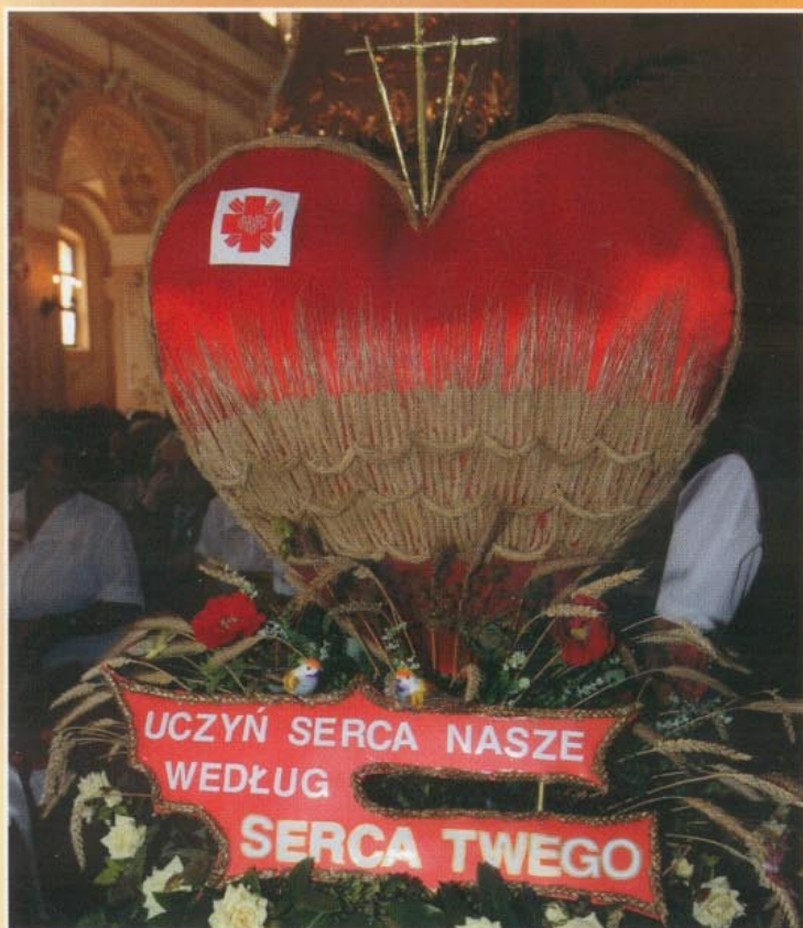
Wieniec przygotowany przez Caritas Parafii Hermanowa