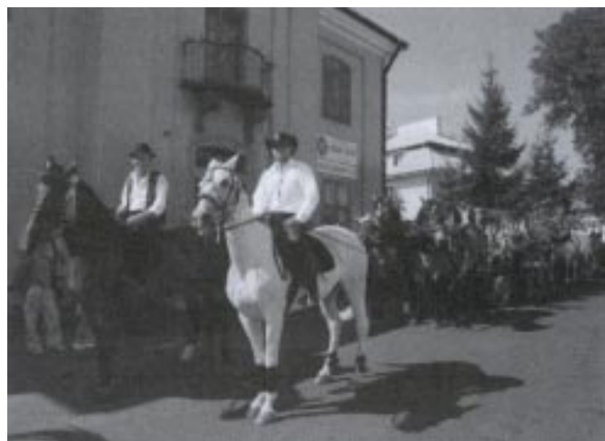
Umajone wozy przejechały ulicami miasta