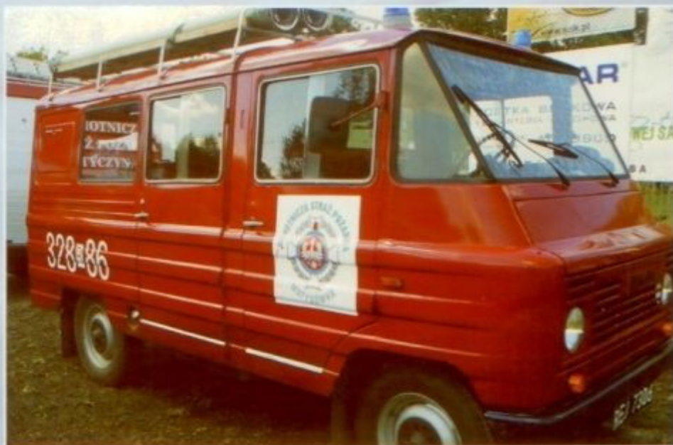
Samochód pożarniczy ŻUK - A06B (1984), lekki, wyposażony w motopompę

niczego. Jednostka zrzesza 53 członków, w tym 46 czynnych.