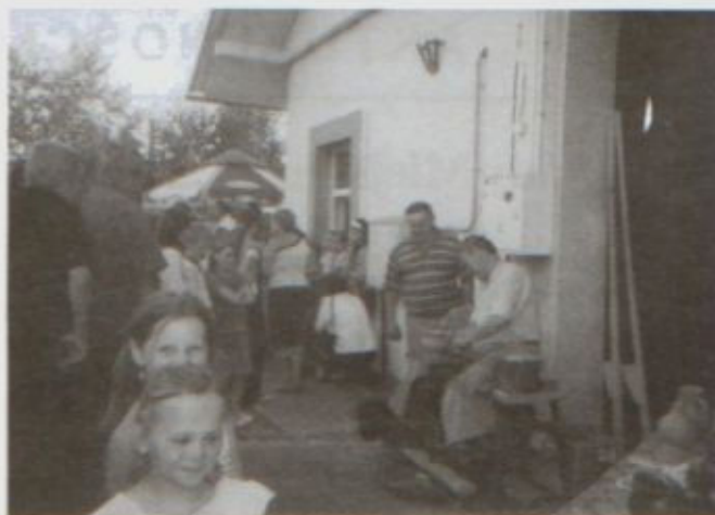
„Nie święci garnki lepią”