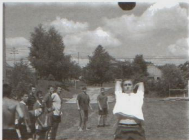
Rzut piłką lekarską

Dużym powodzeniem cieszyły się konkurencje siłowe. Nic dziwnego, skoro w spartakiadzie brali udział sami chłopcy.