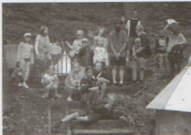
Borek Stary. Przy źródelku musimy się spieszyć bo zaczyna padać