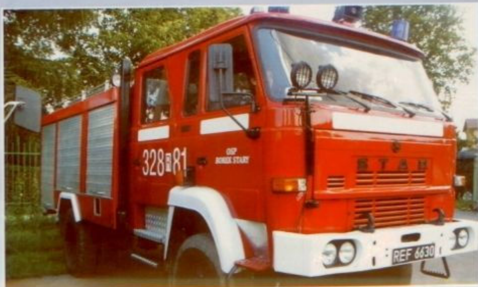
OSP Borek Stary dysponuje samochodem pożarniczym STAR 244 wyposażonym w zbiornik na wodę, autopompę i motopompę