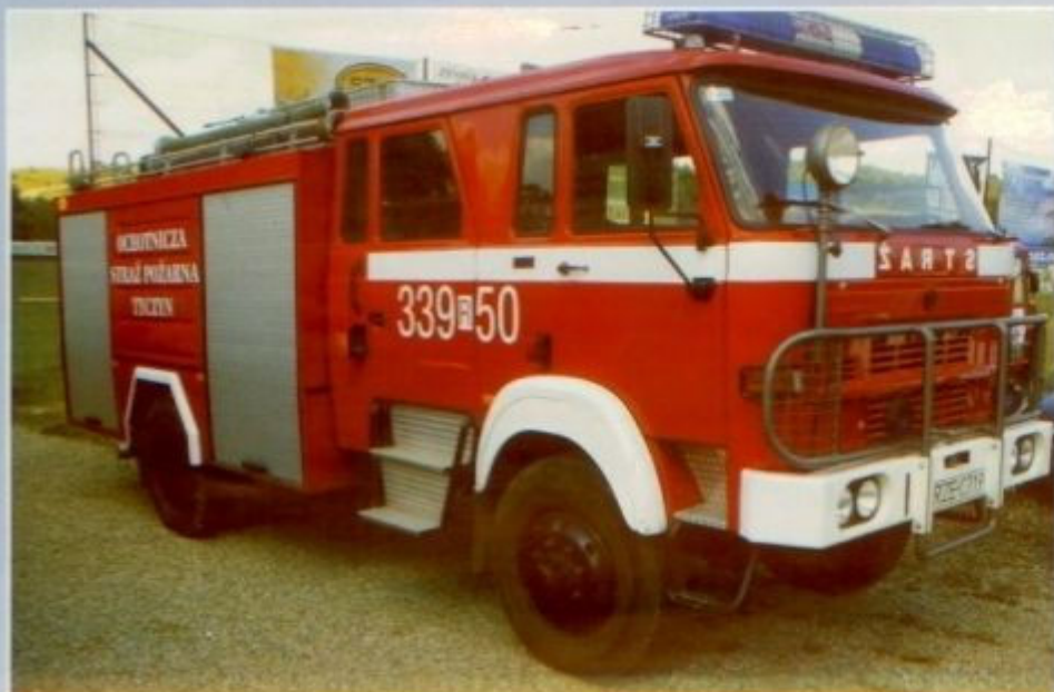
Samochód pożarniczy STAR (1982) ze zbiornikiem na wodę, wyposażony w autopompę i motopompę