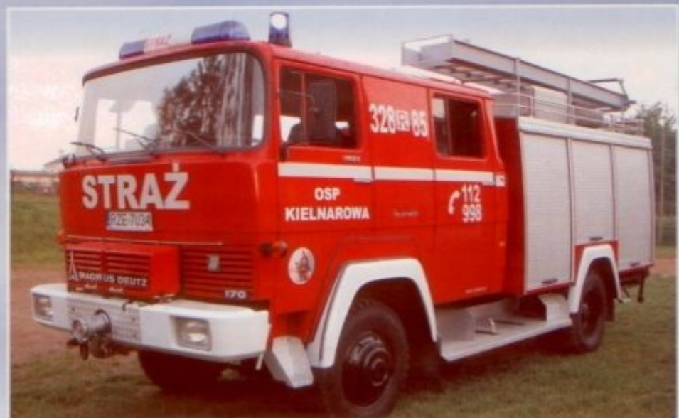
Samochód pożarniczy MAGIRUS DEUTZ FM 170 (1981), ze zbiornikiem na wodę, wyposażony w autopompę i motopompę