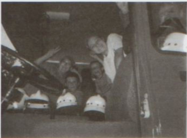
Dzieci w strażackim samochodzie