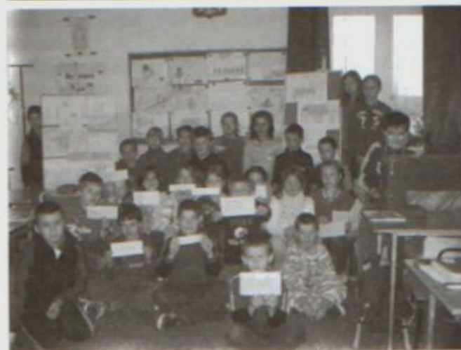
Prezentacja projektu „Niestraszna nam ortografia”

wie oraz część rodziców. Do efektów pracy należą m.in. tomiki wierszy, program poetycko - muzyczny „Od smutku do radości”, plakaty, zbiór ortograficznych rymowanek, rysunków i dyktand. Nauczycieli opiekunów cieszyła przede wszystkim panująca wśród uczniów atmosfera wspólnego działania i przeżywania radości z sukcesów.