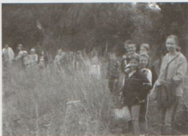
Wszyscy w komplecie, ruszamy chociaż pogoda niezbyt dopisała