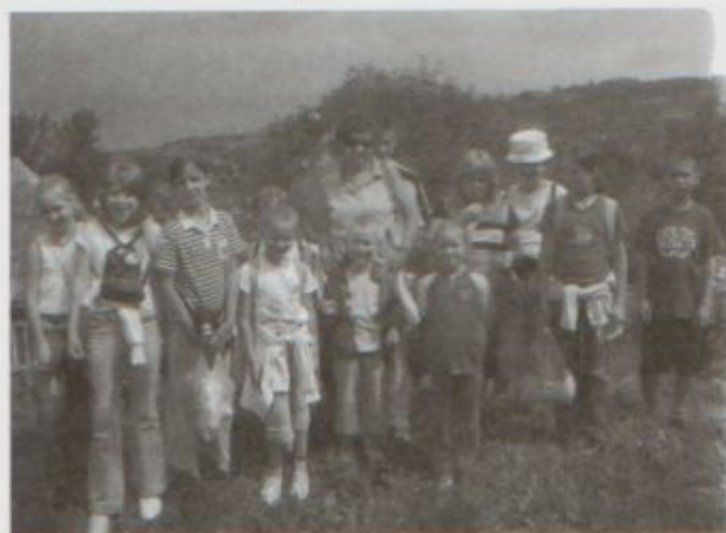
Pułanek. Wędrujemy dalej, zostawiając za sobą deszczowe chmury