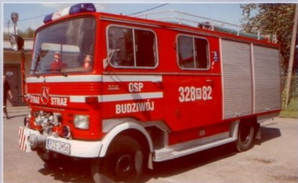
Samochód pożarniczy DAIMLER BENZ 6080 (1974) ze zbiornikiem na wodę, wyposażony w autopompę i motopompę

Jednostka dysponuje samochodem bojowym DAIMLER BENZ GBAM (1974) wyposażonym w autopompę, zbiornik na wodę o pojem-