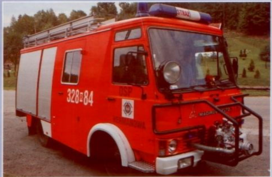
Samochód pożarniczy MAGIRUS DEUTZ 90M 66F (1982) ze zbiornikiem na wodę, autopompą i motopompą