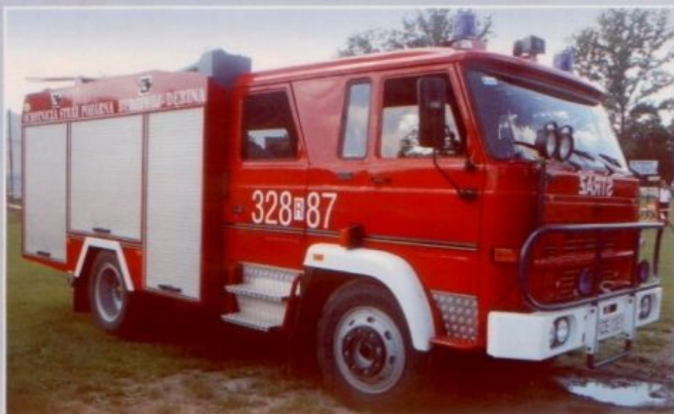
Samochód pożarniczy STAR - 200 (1986, karosaż 2003) ze zbiornikiem na wodę i autopompą

Jednostka jest w posiadaniu sprzętu: samochodu bojowego STAR-200 wyposażonego w zbiornik na wodę 2500 l i autopompę, samochodu pożarniczego ŻUK (1982), motopompy PO-5, agregatu prądowórczego, działka, drabiny 3-częściowej (2004), agregatu