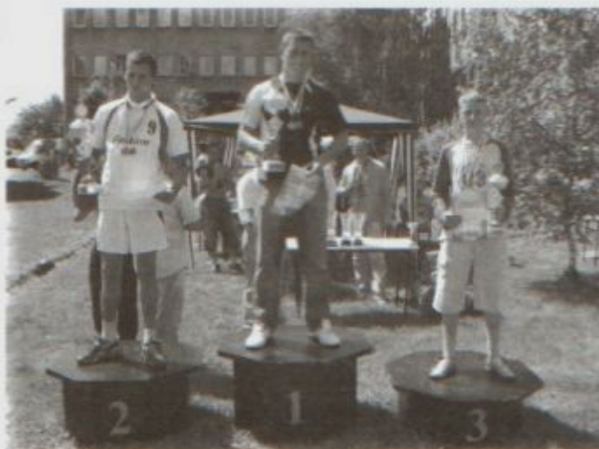
Puchary Starosty za najlepsze wyniki w wieloboju siłowym (drużynowo)

Wszyscy uczestnicy i także ich opiekunowie bardzo dobrze się bawili. W czasie przerwy można było posmakować sta-