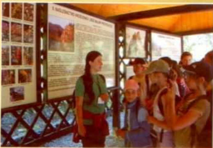
Pani przewodnik opowiada nam o cudach przyrody wąwozu Homole i Pienińskiego Parku Narodowego

Starsi uczniowie poznali malownicze Pieniny. Przeszli Wąwozem Homole podziwiając piękno przyrody, po czym zwiedzili bacówkę, gdzie mogli obserwować jak wyrabia się oscypki, a później zeszli do Jaworek by odwiedzić muzyczną owczarnię, miejsce spotkań i koncertów wielu wybitnych muzyków, nie tylko z Polski.