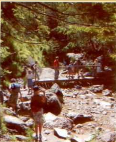
Pilnie liczyliśmy mostki nad wąskim potokiem płynącym wąwozami i podziwialiśmy skaliste zbocza