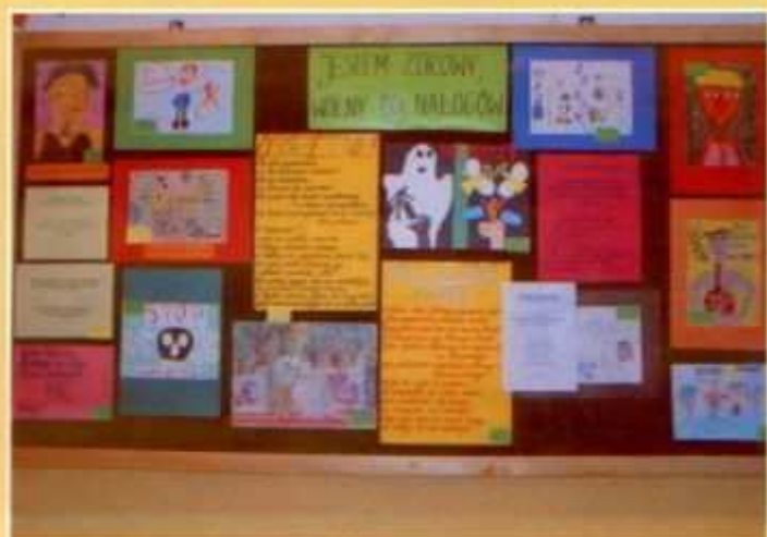
Uczestnicy konkursów prezentują swoje wiersze i prace plastyczne

Od stycznia uczniowie klasy piątej brali udział w programie profilaktyki chorób sercowo-naczyniowych „Szansa dla Młodego Serca”. Projekt ten powstał na zlecenie Ministerstwa Zdrowia, aby uświadomić młodzieży, na czym polega zdrowe żywienie, jakie znaczenie ma wysiłek fizyczny, dlaczego palenie jest szkodliwe i jak radzić sobie ze stresem. Nasza szkoła była jedną z czterech szkół na Podkarpaciu, które realizują program „Szansa dla Młodego Serca”. Na zajęciach uczniowie poznawali zagadnienia dotyczące budowy i fizjologii serca oraz układu krążenia, czynników wpływających na powstawanie chorób sercowo-naczyniowych oraz sposobów na zmniejszanie ryzyka zachorowania na te choroby, na które co roku umiera wielu mieszkańców naszego kraju. 30 stycznia nasze zajęcia z cyklu „Szansa dla Młodego Serca” filmowała ekipa regionalnego oddziału Telewizji Polskiej.