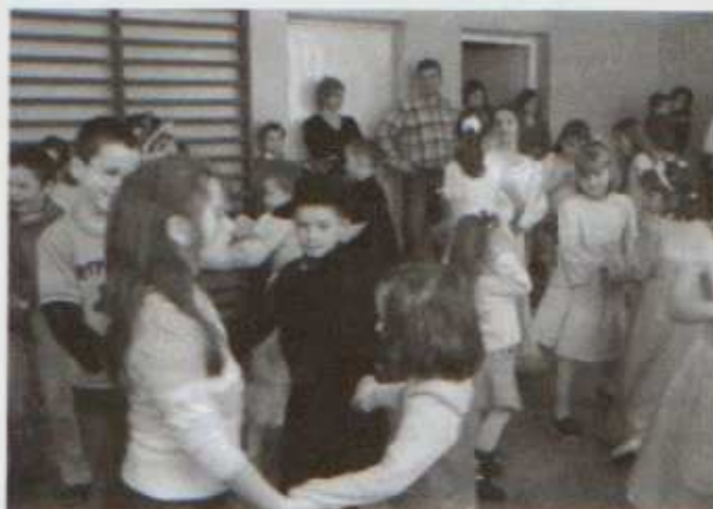
Tańce i gry są nieodłącznym elementem szkolnych zabaw

W ubr. realizowaliśmy też program „Żyć zdrowo, bez nalogów”. Miał on na celu propagowanie wśród uczniów zdrowego stylu życia; zwiększanie świadomości zagrożeń wynikających z picia alkoholu, palenia papierosów; kształtowanie zachowań asertywnych; rozwijanie odpowiedzialności za siebie i innych; umiejętności podejmowania „zdrowych” decyzji. Zorganizowaliśmy wówczas dla uczniów wiele konkursów, zajęć ruchowych, turniejów i rozgrywek sportowych na wolnym powietrzu. Korzystając z pięknej aury chodziliśmy na spacer i wycieczki. Dzieci ze świetlicy zaprosiły do wspólnej zabawy na Święcie Pieczonego Ziemniaka uczniów z Zespołu Szkół Muzycznych Nr 1 z Rzeszowa. Przy ognisku i wórze gitary razem śpiewali piosenki, dużych emocji dostarczyły zabawy i konkursy, a na koniec ze smakiem zjedli upieczone kielbaski i ziemniaki.