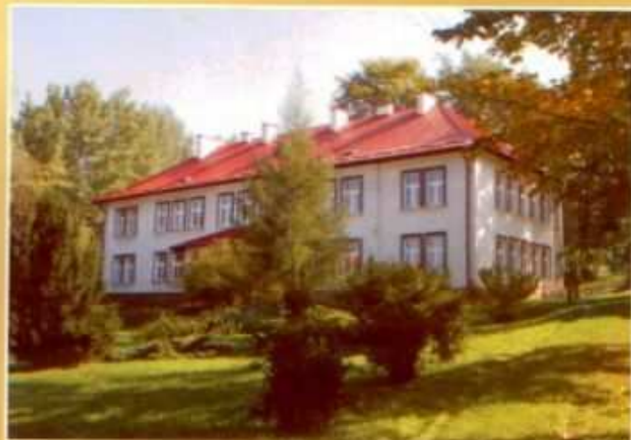
Szkoła Podstawowa w Matysówce

Szkoła Podstawowa w Matysówce jest jedną z siedmiu szkół podstawowych na terenie naszej gminy. W bieżącym roku szkolnym uczęszcza do niej 106 uczniów - 14-ro dzieci do „zerówki” i 92 uczniów do klas I-VI. Pracuje tu 15 nauczycieli, ale tylko 7 z nich na pełne etaty, pozostali realizują ich część, łącząc często pracę w kilku szkołach.