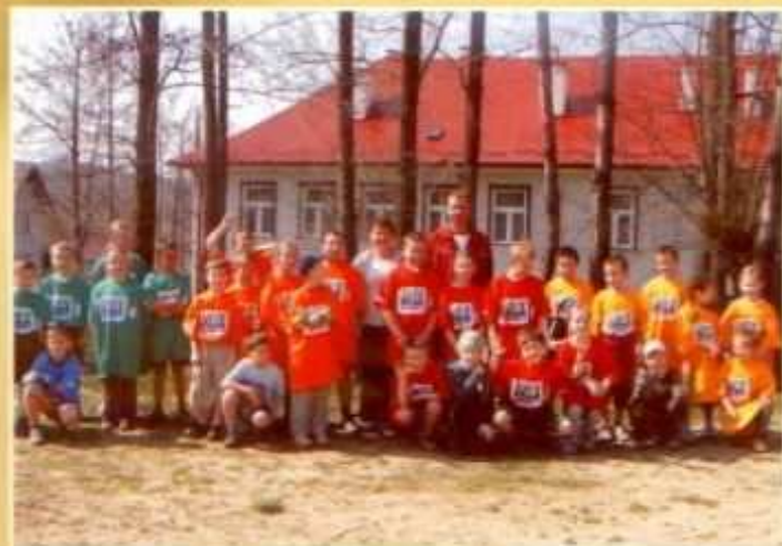
Wszyscy uczniowie uczestniczyli w akcji „Rusz się człowieku”

> Od kilku lat podejmujemy wysiłki aby stać się jedną ze „Szkół Promujących Zdrowie”. W ramach tych starań realizujemy w każdym roku szkolnym specjalne programy prozdrowotne i profilaktyczne.