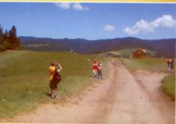
Ze szczytu Palenicy Pieniny nie są już tak wysokie