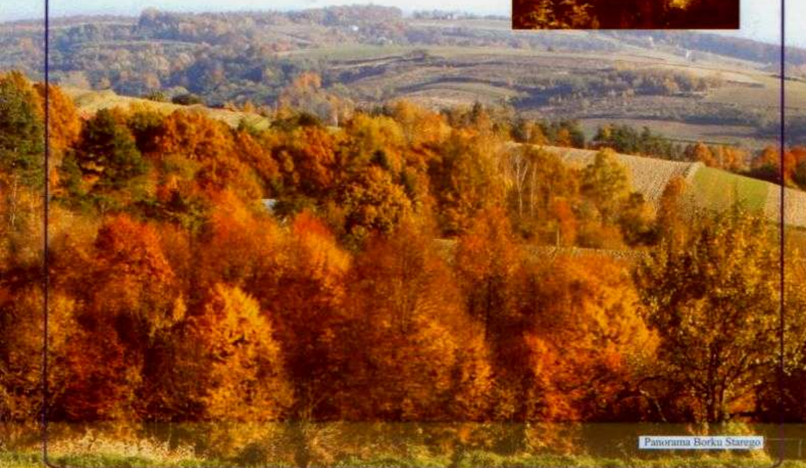
Panorama Borku Starego