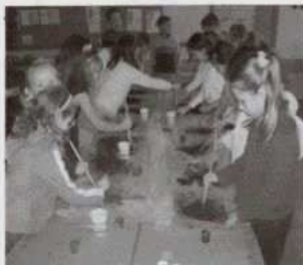
Dzieci z oddziału „0” wykonują smoga