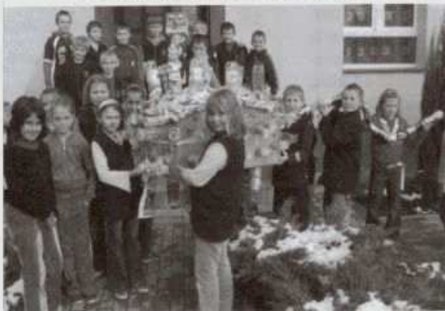
Smog recyklingu klasy IIIb