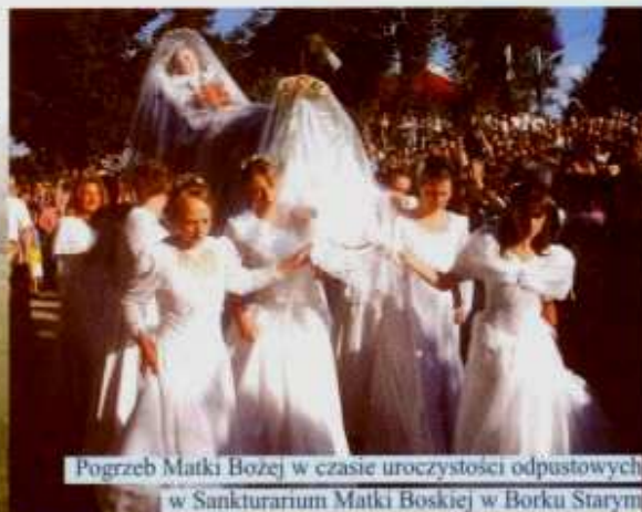
Pogrzeb Matki Bożej w czasie uroczystości odpustowych w Sanktuarium Matki Boskiej w Borku Starym

Do Sanktuarium należą jeszcze dwie osobne kaplice. Ponad klasztorem, na szczycie wzniesienia zwanego Jasną Górą (ok. 320 m) znajduje się kaplica Matki Bożej Bolesnej, zbudowana w 1896/97 r. Stąd rozciąga się piękna panorama doliny Strugu i okolicznych wzniesień. Poniżej - zbudowana w 1779 r. Kaplica św. Anny z obrazem świętej namalowanym w XIX w., za którą od 1894 r. jest zakonny cmentarz.