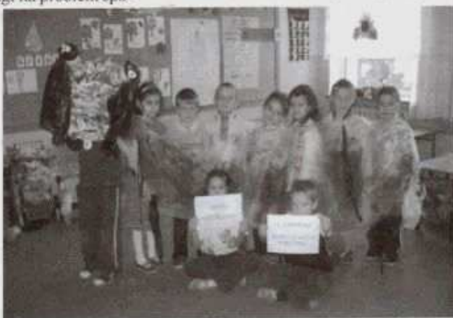
Uczniowie „zerówki” z gotowym smogiem