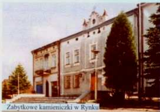
Zabytkowe kamieniczki w Ryнку

6) Figura Serca Jezusowego (przy wjeździe do miasta) upamiętniająca obchody 2000 lat chrześcijaństwa.