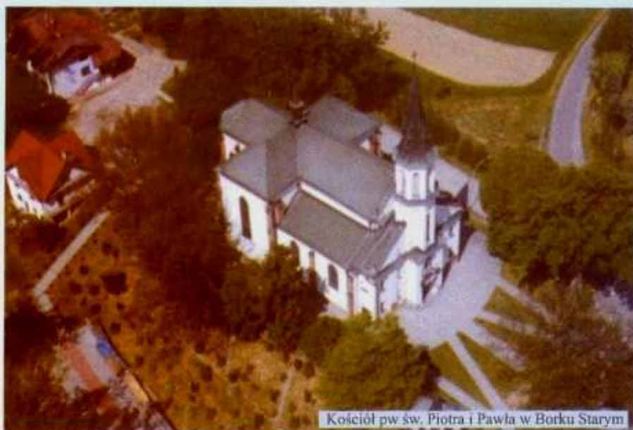
Kościół pw. św. Piotra i Pawła w Borku Starym

Stary młyn wodny - w pobliżu odgałęzienia drogi do Chmielnika. Pochodzi prawdopodobnie z XVIII w., poddawany był pracom remontowym w latach: 1943, 1947 i 1983. Sam młyn od lat jest nieczynny i pozbawiony urządzeń, lecz na rzece zachowały się resztki jazu.