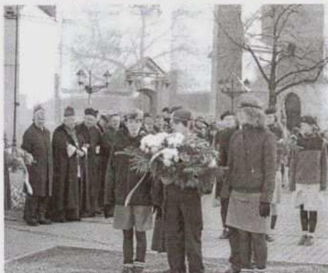
Złożenie kwiatów pod pomnikiem płk. Leopolda Lisa-Kuli

W części oficjalnej, przy pomniku płk. Leopolda Lisa-Kuli odbył się apel harcerski, odczytanie rozkazu komendanta