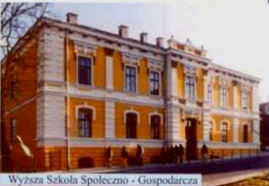
Wyższa Szkoła Społeczno - Gospodarcza