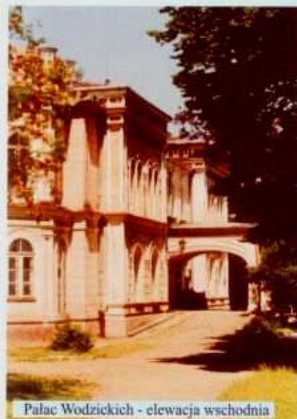
Pałac Wodzickich - elewacja wschodnia

2) Dworek bp. Wacława Betańskiego - Tyczyn ul. Tycznera. Jest to dom parterowy, drewniany (modrzewiowy), na wysokiej podmurówce, z dachem czterospadowym, pokrytym blachą. Założony jest na rzucie prostokąta z przeszkloną werandą przy elewacji północnej i drewnianym nadwieszonym gankiem przy elewacji wschodniej. Dom ten wzniesiony w II połowie XVIII w. był prywatną rezydencją bp. Wacława Betańskiego utrzymaną w stylu dworców szlacheckich. Obecnie jest własnością prywatną.