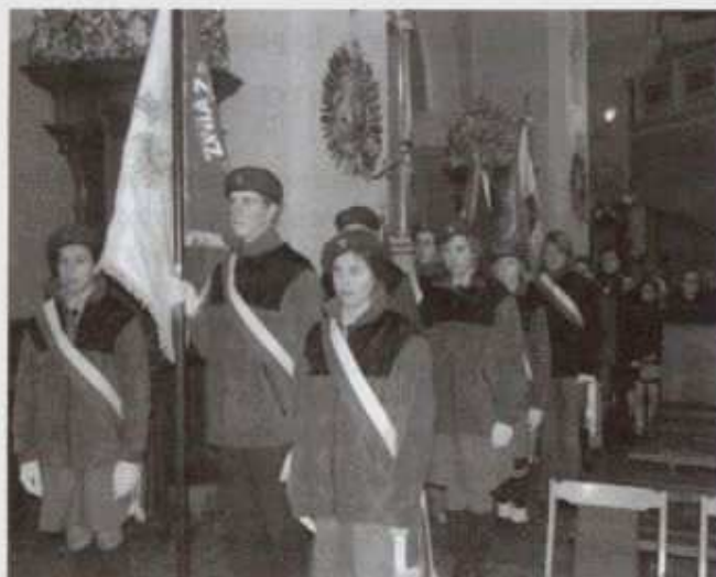
Młodzież ze sztandarem w kościele

Chorągwi Podkarpackiej, akt nadania imienia i prawa do posiadania sztandaru, złożenie kwiatów i zapalenie zniczy. Później uczestnicy przemaszerowali do Teatru, gdzie młodzież