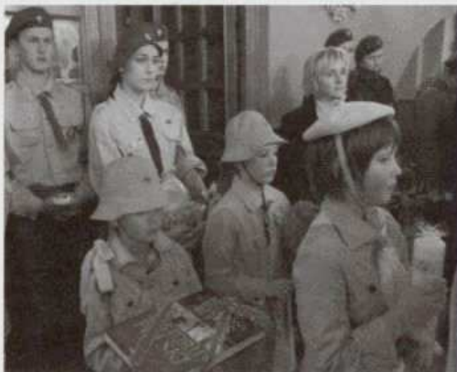
Dary ołtarza niesione przez zuchów i harcerzy