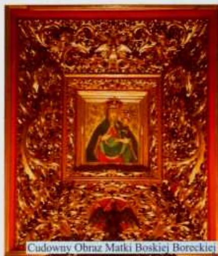
Cudowny Obraz Matki Boskiej Boreckiej