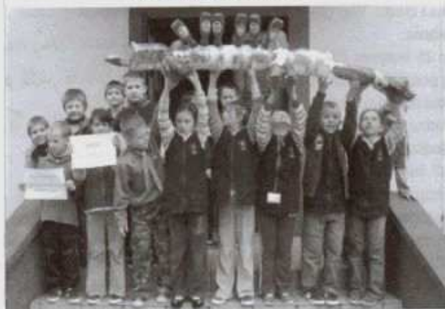
Smog recyklingu 21 Gromady Zuchowej „Ekoludki”