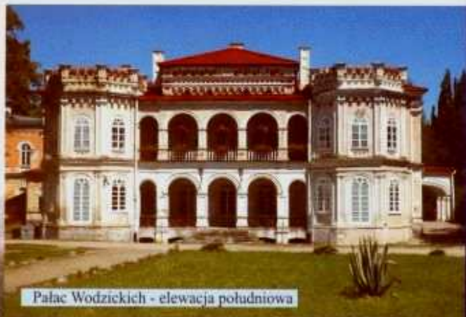
Pałac Wodzickich - elewacja południowa