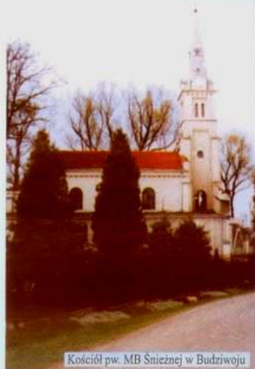
Kościół pw. MB Śnieżnej w Budziwoju