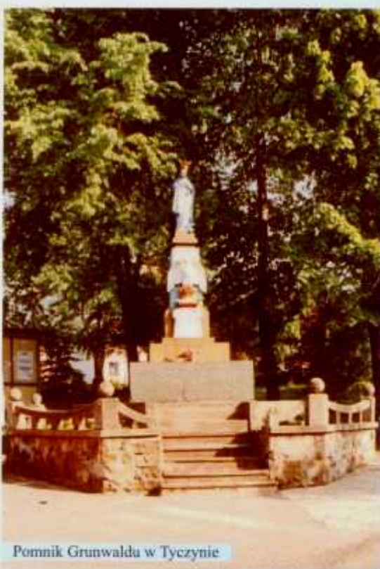
Pomnik Grunwaldu w Tyczynie