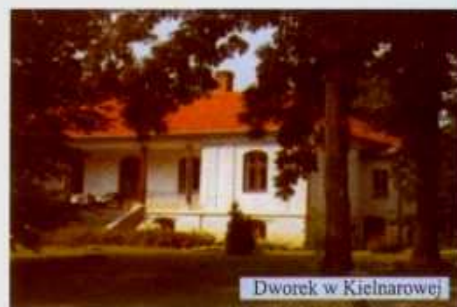
Dworek w Kielnarowej