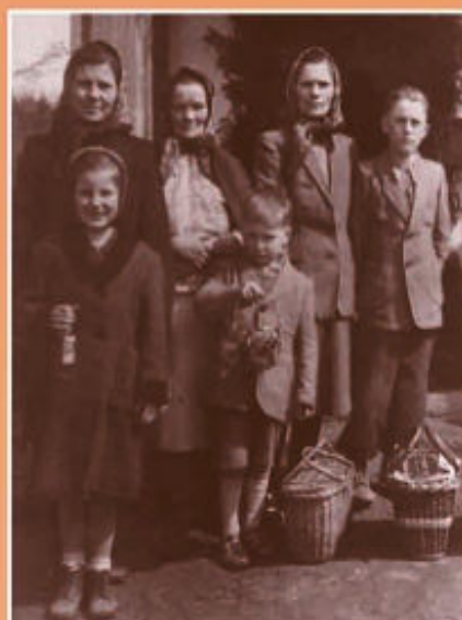
Studzianka, rok 1948. Rodzina Wilków podczas święcenia wielkanocnych pokarmów