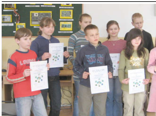
Finałiści konkursu nagrodzeni zostali dyplomami