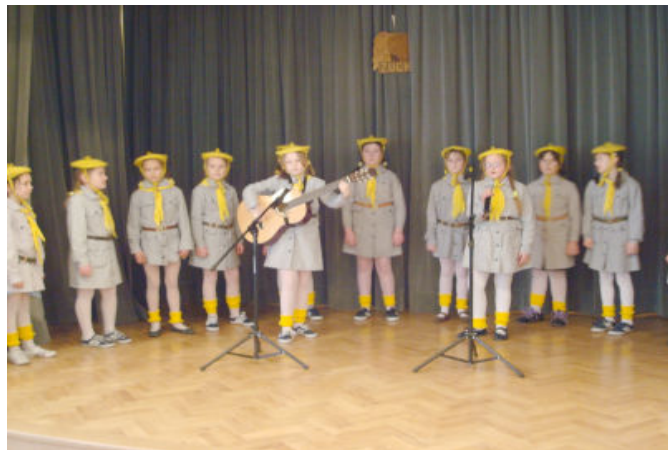
Zdobywcy I miejsca wśród gromad zuchowych - 23 GZ „Wesołe Krasnoludki” z Tyczyna

I miejsce wśród gromad zuchowych zajęła 23 GZ „Wesołe Krasnoludki” z Tyczyna , a II miejsce 21 GZ „Ekołudki”