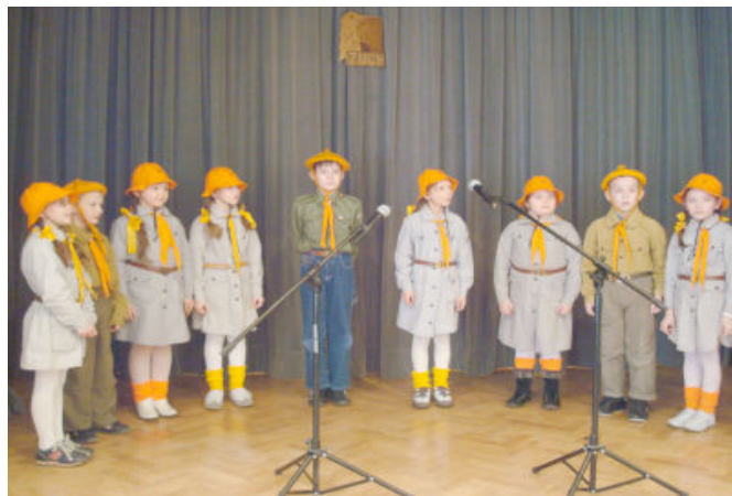
II miejsce zajęła 21 GZ „Ekołudki” z Budziwoja

z Budziwoja. W kategorii harcerzy młodszych I miejsce przypadło 48 DH „Jerzyki” z Budziwoja. Jednym słowem - „nasi” z ZDDS Tyczyn znów wypadli śpiewająco!