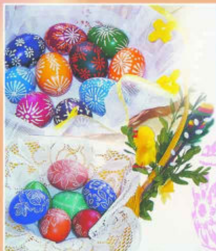
Pisanki wykonane techniką batikową