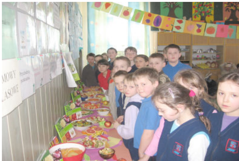
Prezentacja - Owocowo-warzywny mix dla ucznia

owocowych oraz zgromadziły różnego rodzaju soki. Barwne plakaty i opisy wykonanych smakołyków oraz estetyka ekspozycji na pewno spowodowały wzrost apetytu na owoce i warzywa nawet u niejadków. Miłą niespodzianką były rozdawane w tym dniu wszystkim uczniom i pracownikom szkoły jabłka, подарowane przez Radę Rodziców (w pozostałych dniach tygodnia zdrowia każdy mógł je też nabyć w sklepiku szkolnym).