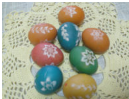
A oto efekty pracy dzieci

< Druga grupa uczniów kl. „0” wraz z panią Basią wykonuje pisanki-naklejanki. Swoim uczniom pomaga wychowawczyni - p. Anita Dobrowolska