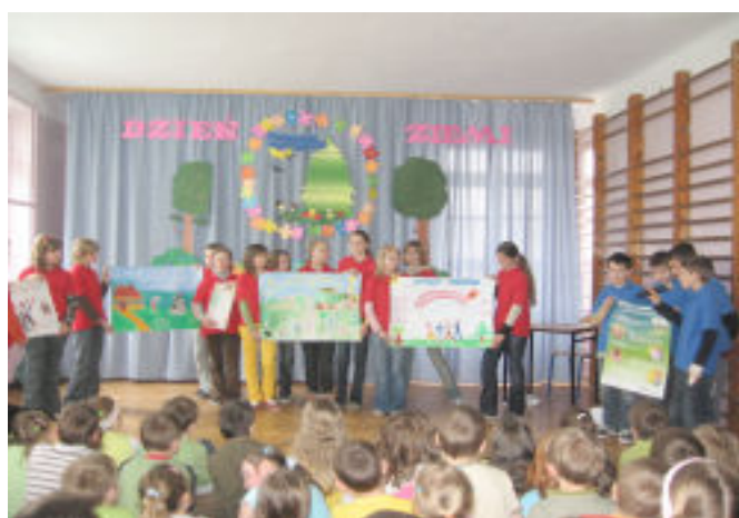
ZSEE - Va