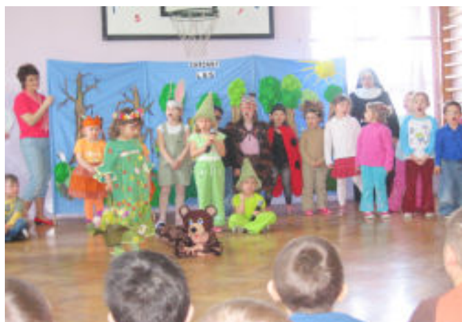
Inszenizacja przedszkolaków z Budziwoju

W klasach odbyły się turnieje wiedzy ekologicznej, praktyczne zabawy z segregacją śmieci, a także układano hasła związane z ochroną Ziemi. Prowadzona jest również zbiórka makułatury i baterii.