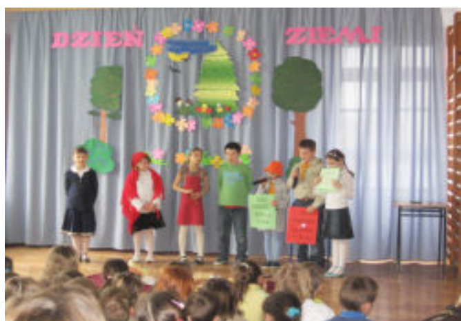
Dzień Ziemi - zuchy