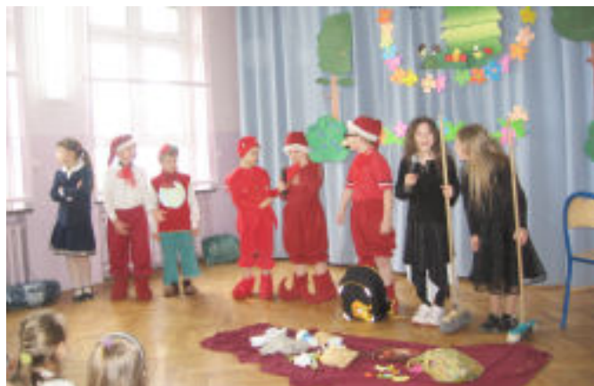
Dzień Ziemi - kl. 1Ia