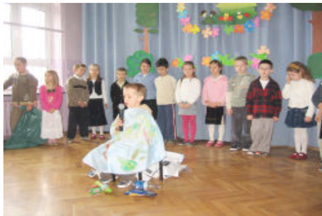
Dzień Ziemi - kl. 0a i 1a (poniżej)