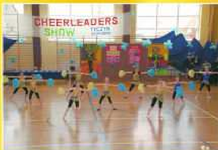
na III miejscu uplasowała się „Tuteżca Trójka” ze Szkoły Podstawowej Nr 3 w Chmielniku

< W czasie obrad komisji gościnnie wystąpił zespół „Wataha” z Tyczyny