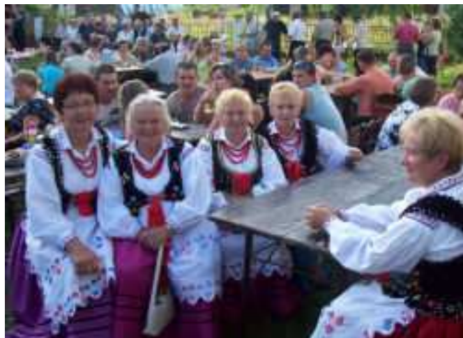
i na pikniku