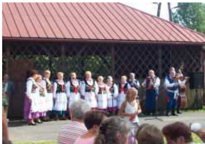
Zespół „Matysowianki” podczas występu z Kapelą Wójta Tycznera