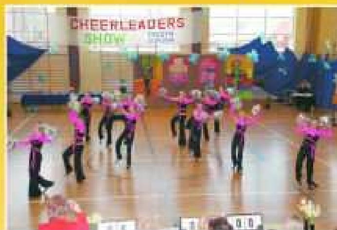
„Eksperyment” (MZSz. nr 4 Krośno) II miejsce