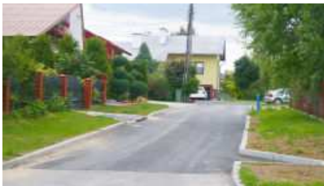
Sięgacz przy ul. Pileckich

Wykonano koryto drogi, podbudowę z kruszyw łamanym, skropiono nawierzchnię, położono masę bitumiczną na trzech sięgaczach na powierzchni 1 096,4 m 2 na wartość 144.426 zł.