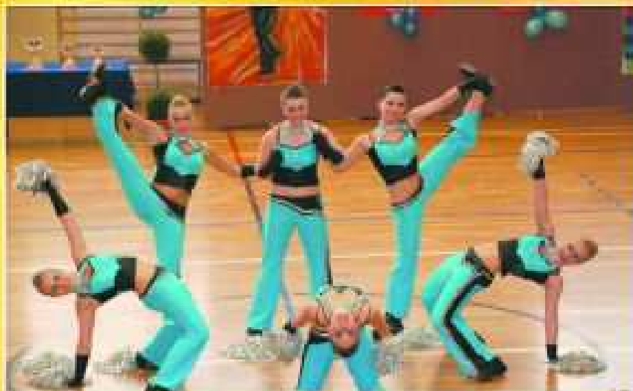
W kat. senior I miejsce wytańczyło „Flimero” z Tyczyny

Organizatorami zawodów byli: Miejsko-Gminny Ośrodek Kultury w Tyczynie, Uczniowski Klub Sportowy przy SP Tyczyn, Publiczne Gimnazjum im. Jana Pawła II w Tyczynie.