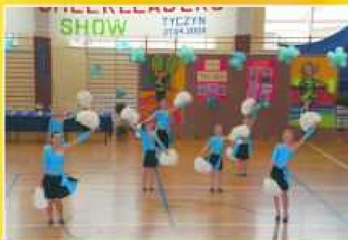
„Largo” SP Hermanowa

Jury skrupulatnie oceniało elementy obowiązkowe, synchronizację - zgodność muzyki z tańcem, dynamikę oraz artystyczne wrażenie. Po prezentacji wszystkich zespołów wyłoniło zwycięzców.