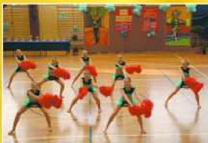
„Expresowdance” (Gimnazjum Sportowe Rzeszów) III miejsce