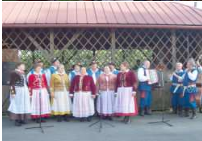
Zespół „Budziwojce” i Kapela Wójta Tycznera