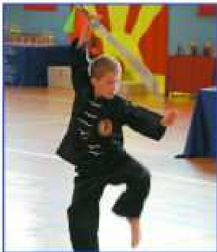
Zawodnik z Rybnika podczas demonstracji kata z bronią (miecz chiński)