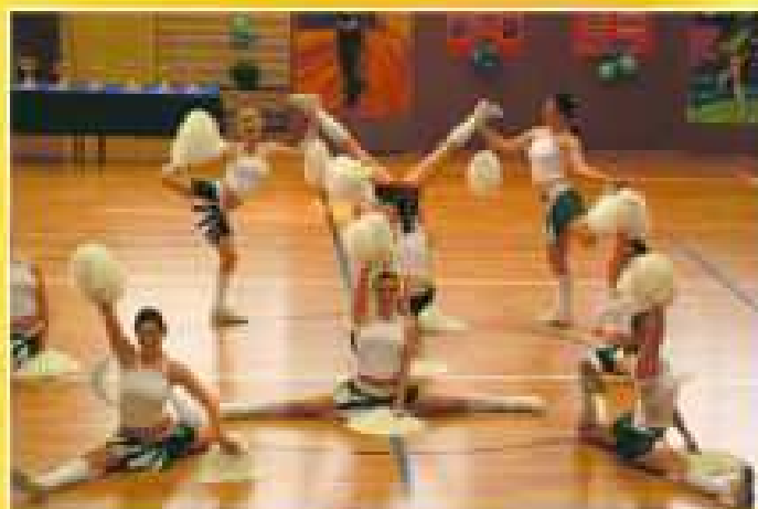
„Anxi” (Gimnazjum nr 6 Rzeszów) III miejsce - kat. senior

Patronat medialny objęła TVP Rzeszów i Gazeta Codzienna „Super Nowości”. Impreza była bardzo udana, wszyscy trenerzy nie kryli zadowolenia z organizacji, a więc do zobaczenia za rok!!!