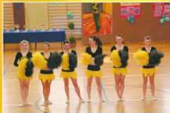
„Znicz” (GOSiR Jarosław) II miejsce - kat. senior