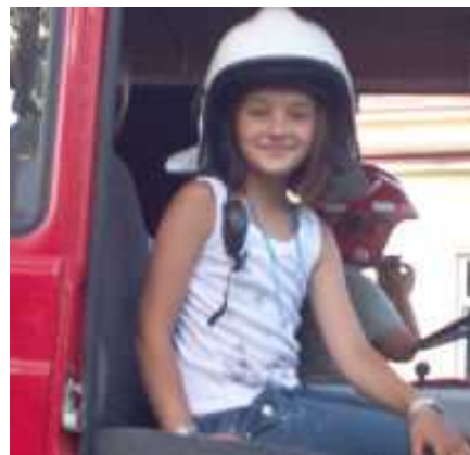
W strażackim wozie

konkursy i zabawy profesjonalnie prowadzone przez clownów-aktorów Teatru „Bazyl” z Radymna .