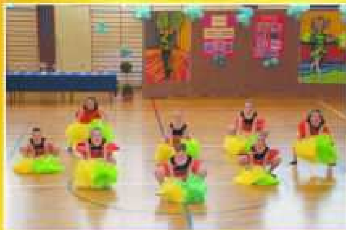
„Dziesięćki” z Rzeszowa wytańczyły II miejsce