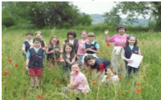
Wyprawa na tzw. „Księżę łąki”

Równie piękne jak samo miasto są okolice Tyczyna. Przekonaliśmy się o tym wędrując polnymi drózkami biegnącymi wzdłuż łąk kwitnących rumianków i pól pełnych maków. Szliśmy trasą wyznaczoną przez przydrożne kapliczki. Wyszliśmy nawet na najwyższe wzniesienie w okolicy, Dalnicę. Byliśmy w miejscu skąd wypływa cudowne źródło, a na koniec doszliśmy aż na Królkę.