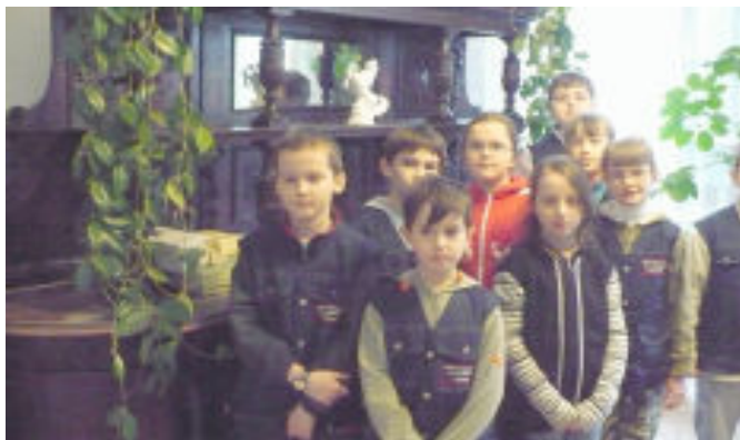
Gabinet z zachowanymi meblami w pałacu Wodzickich

Zaintrygowani tym, jak dawniej wyglądało codzienne życie tyczynian, wybraliśmy się do miejscowego muzeum. Oprócz sprzętów gospodarskich, oglądaliśmy kroniki pełne wycinków prasowych i zapisków pochodzących z ubiegłego wieku. Obejrzeliśmy również stare księgi parafialnych oraz pozółtkłe zdjęcia znajdujące się w zbiorach Miejsko-Gminnej Biblioteki Publicznej.