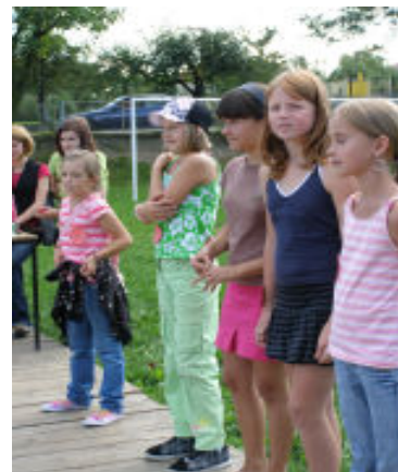
Kandydatki na Mini Miss Tyczyna