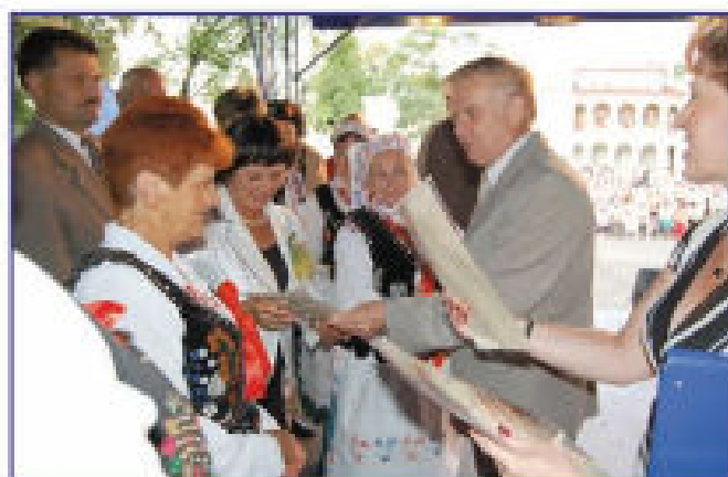
Wręczenie podziękowań dla delegacji dożynkowych