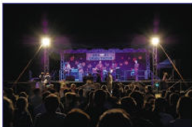
Gwiazda wieczoru zespół „RATATAM”