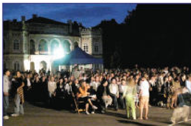
Publiczność w trakcie koncertu