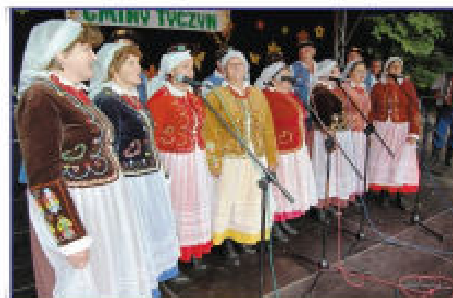
Występ zespołu ludowego „Budziwojce”