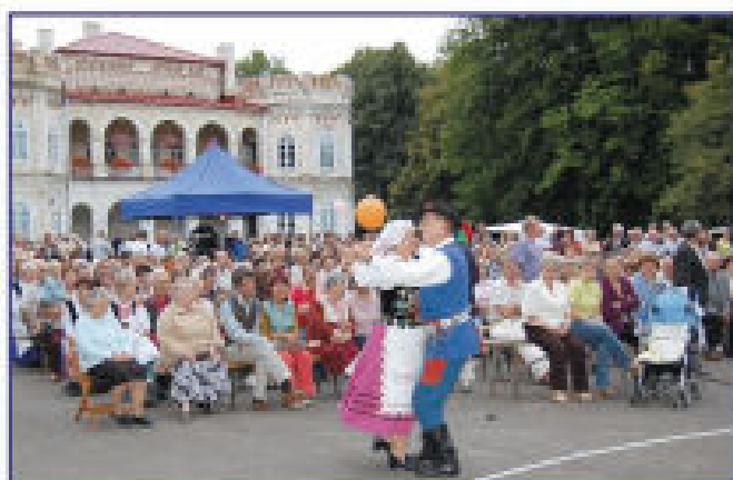
Publiczność oglądająca występy zespołów ludowych