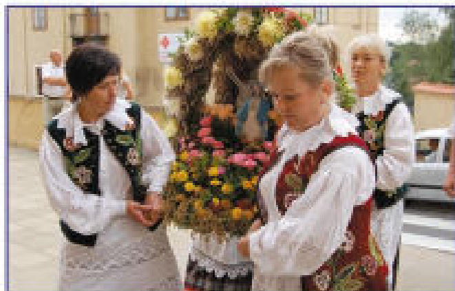
Delegacja z Borku Starego