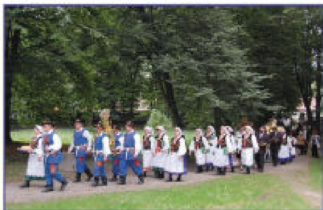
Korowód dożynkowy w parku