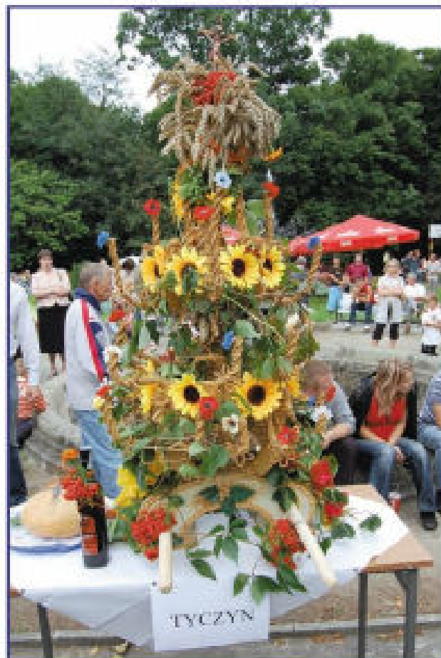
Wieniec dożynkowy z Tyczyna