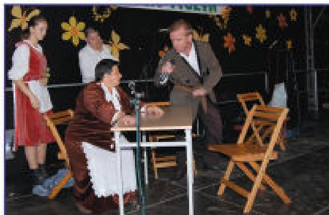
Widowisko „Walki chłopskie” w wykonaniu „Nockowian”