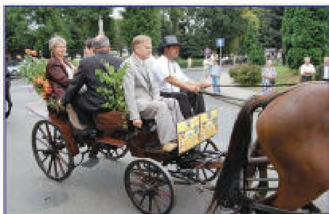
Burmistrz, Przewod. Rady, Dyr. M-GOK, w czasie przejazdu do parku