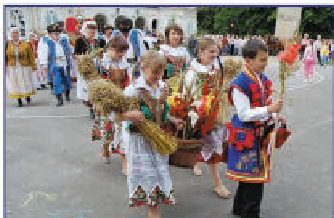
Dzieci z zespołem Budziwojce