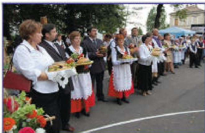
Delegacje dożynkowe z darami do burmistrza