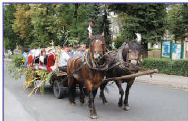
Barwnie przystrojonymi wozami przyjechały do Tyczyna m.in. Budziwojce