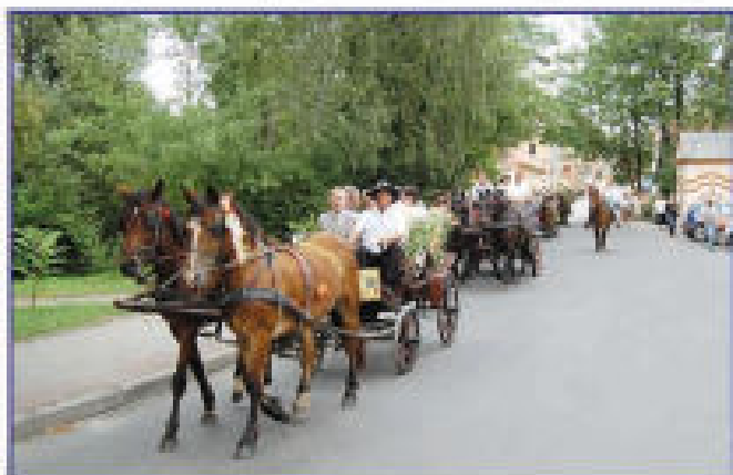
Barwny korowód dożynkowy ulicami Tyczyna