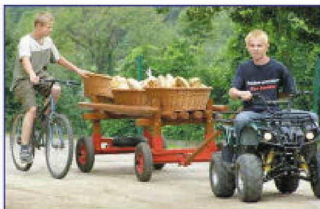
Transport pieczywa z piekarni „Misia Jana”