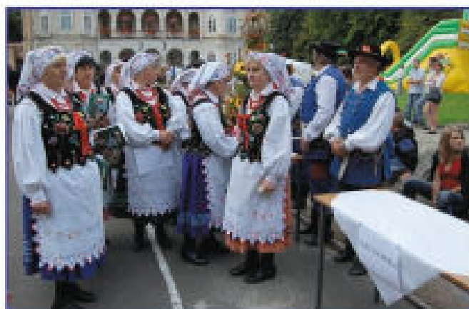
Tyczyniacy w oczekiwaniu na występ