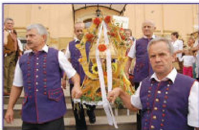
Delegacja z Białej