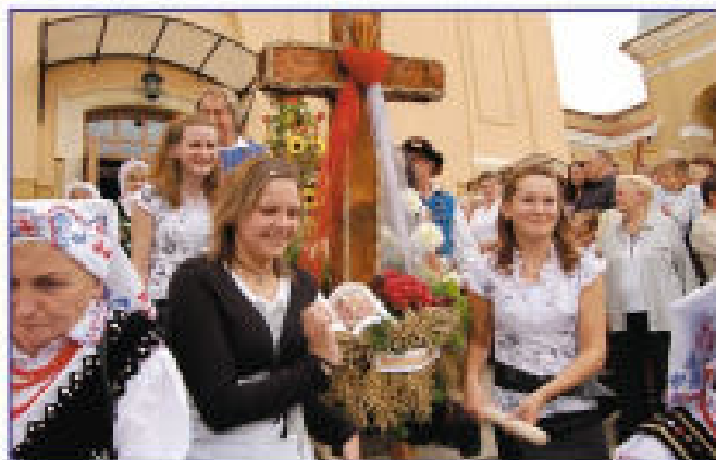
Delegacja z Hermanowej