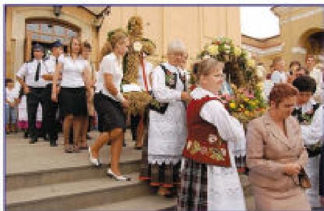
Delegacje z wieńcami po Mszy Świętej