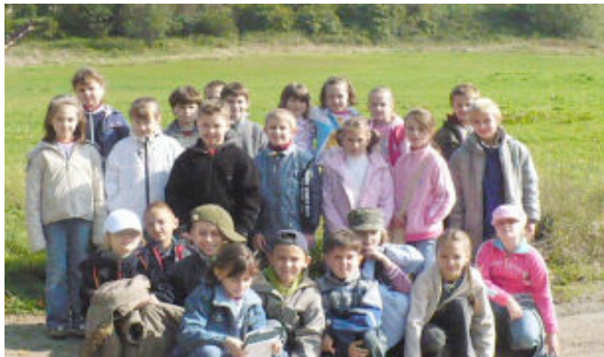
Uczniowie klasy IIIa na tle pozostałości wałów ziemnych