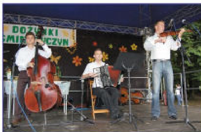
Występ zespołu folkowego „Karczmarze”