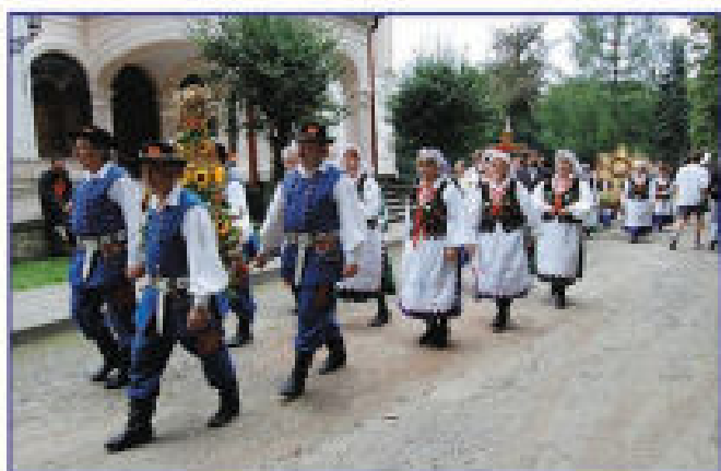
Tyczyniacy idący na czele korowodu dożynkowego