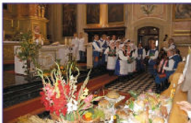
Uroczysta Msza Dożynkowa w kościele pw. Świętej Trójcy i św. Katarzyny w Tyczynie