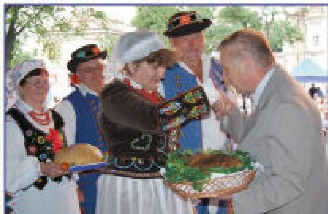
Składanie darów na ręce Burmistrza Tyczyna