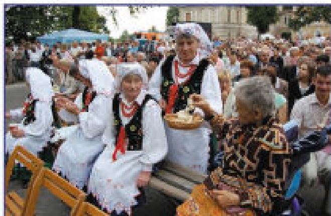
Częstowanie chlebem gości dożynkowych