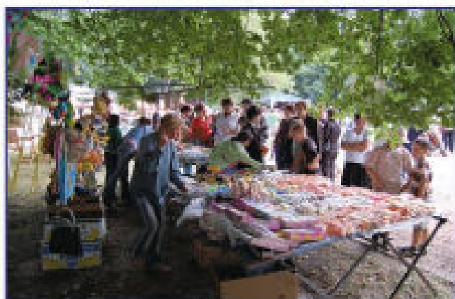
Stoisko handlowe tzw. kramy