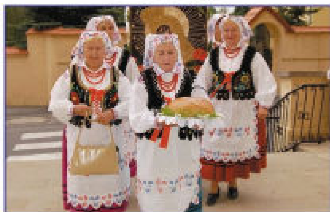
Delegacja z Matysówki