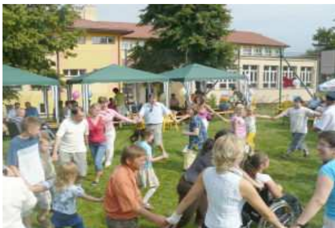
Uczestnicy imprezy podczas gier i zabaw

Impreza miała charakter otwarty, pozwoliła osobom uczestniczącym aktywizować swoje zdolności muzyczne, plastyczne i ruchowe. Dostarczyła dużo radości i dobrej zabawy podczas licznych konkursów i gier. Wyzwoliła pozytywne relacje w grupie. Mieszkańcy Gminy Tyczyn mogli dostrzec skalę i problemy członków naszego Stowarzyszenia.