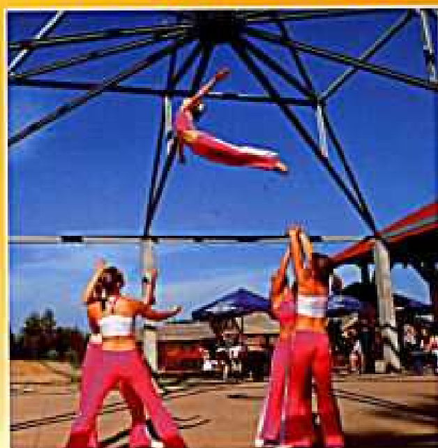
„Flimero” w trakcie pokazu