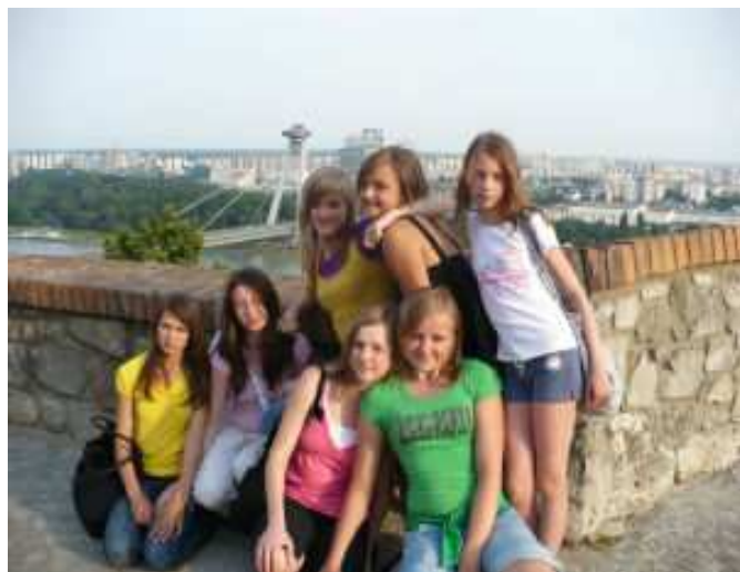
... i Bratysławy