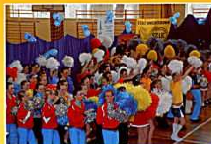
Tyczyn 2008. Rozpoczęcie zawodów

Stroje, w których występują dziewczynki na zawodach i pokazach są szyte przez panie Marię Plutę i Marię Sikorę, za co im serdecznie dziękujemy.