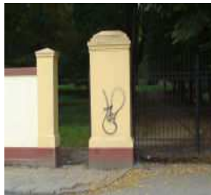
Zniszczony mur parkowy w Tyczynie

Wydaje mi się, że gdyby przyszło odrestaurować niejednemu tatusiowi jedną lub kilka elewacji zdewastowanych