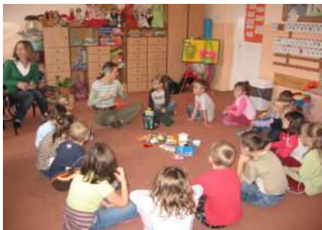
Zajęcia ekologiczne w „zerówce”

Zespołowo największym zaangażowaniem wykazała się klasa III b . Łącznie zebrano: 1671,20 kg makulatury, 1613 sztuk plastikowych butelek typu PET, 929 aluminiowych puszek oraz 2199 baterii.