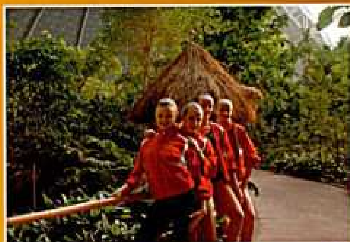
Niemcy 2008. Dziewczęta w Tropical Islands po zawodach