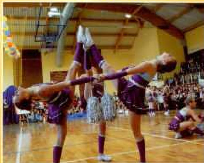
Tyczyn 2007. Występ „Flimero” na I Otwartych Mistrzostwach Cheerleaders Szkół Gimnazjalnych i Licealnych woj. podkarpackiego