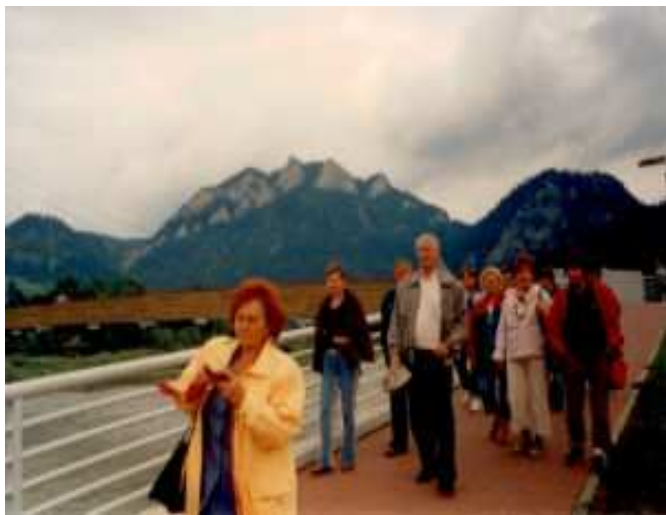
Most łączący Polskę i Słowację z widokiem na Trzy Korony

Z Ludźmierza udaliśmy się w trasę do Zakopanego. Kolejną linową wyjechaliśmy na Gubałówkę, gdzie podziwialiśmy panoramę Tatr.