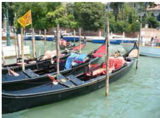
Klasyczna przejażdżka gondolą traktowana jest jako atrakcja turystyczna

Koszty wyjazdu na Mistrzostwa Europy były wysokie ale udało się dzięki ludziom dobrej woli, pomocy Pana Burmistrza, dotacji Urzędu Wojewódzkiego, własnym środkom finansowym zarobionym przez dziewczęta oraz wydatkom pokrytym przez samych rodziców.