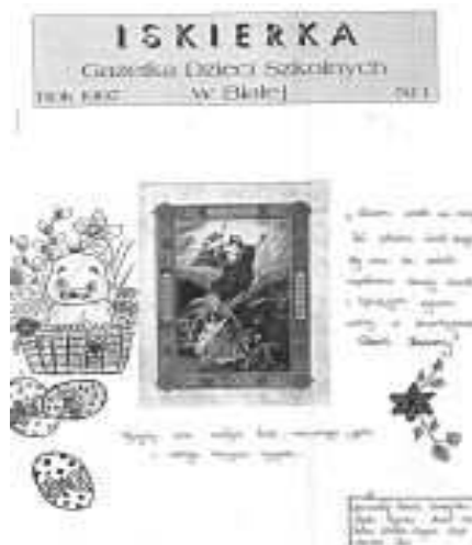
Numer „Iskierki” z 1997r.

Zaistnienie gazetki szkolnej miało duży wpływ na poczucie, że uczniowie są wspólnotą szkolną. Mieli decydu-