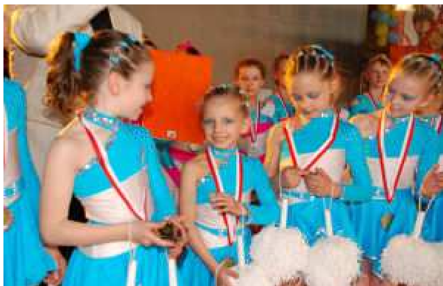
Tarnów 2008. Najmłodsze cheerleaderki w Polsce w kat. do lat 14 wywalczyły srebro

Wspólnymi siłami i dużym zaangażowaniem przyczyniliśmy się do sukcesów zespołu. Dziękuję z nadzieją, że w roku 2008/2009 nasza współpraca będzie równie udana, albo jeszcze lepsza.