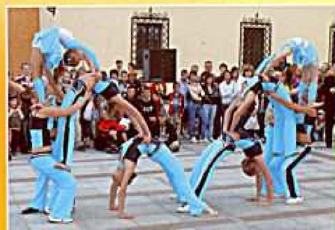
Turnów 2008. Pokaz na Rynku