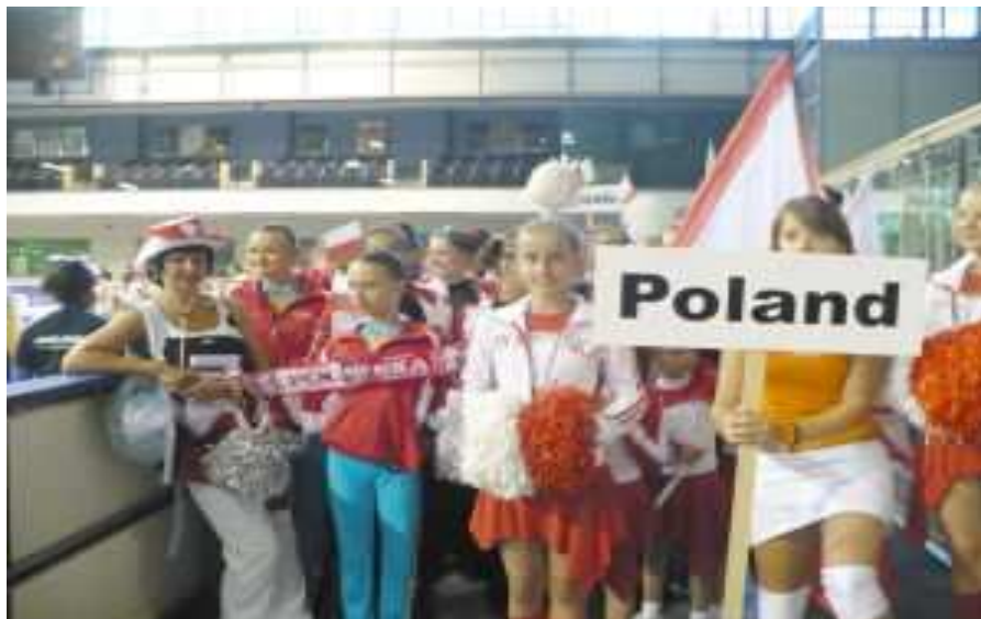
Polskę reprezentowały zespoły z Tyczyna, Tarnowa i Słupska

Udział w Mistrzostwach był dużym wyzwaniem i niezapomnianą przygodą. Zapoznałyśmy się z wieloma zespołami, podglądałyśmy najlepszych uczestników, do których niewątpliwie należą państwa skandynawskie. Ciężką, długą podróż wynagrodziło nam zwiedzanie Bratysławy, Ljubljany i miasta na wodzie - pięknej Wenecji.