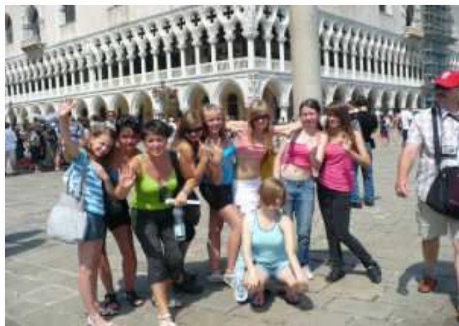
Po zawodach był czas na zwiedzanie Wenecji ...