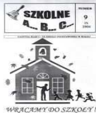
Numer „Szkolnego ABC”

Wielu uczniom zależy na doskonaleniu swoich umiejętności z języka angielskiego i chce zgłębiać ten przedmiot