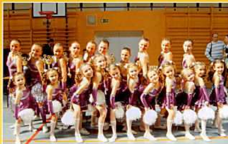
Warszawa 2007. Turniej Międzynarodowy, złote medalistki