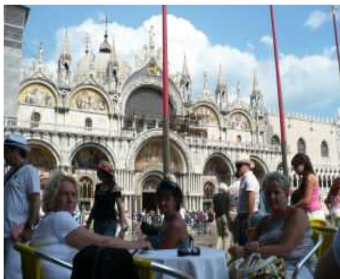
Czas na odpoczynek