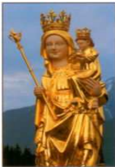
Matka Boża Ludźmierska

Wieczorem odbyło się ognisko przygotowane przez przyjaciela stowarzyszenia. W niedzielę uczestniczyliśmy we