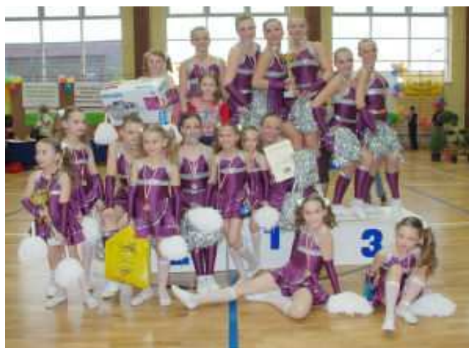
Tyczyn 2007. I Mistrzostwa Województwa Podkarpackiego I m. w kat. junior, I m. w kat. junior młodszy

4 października br. (sobota) czeka nas kolejne wyzwanie - Międzynarodowy Turniej Eurogala 2008.