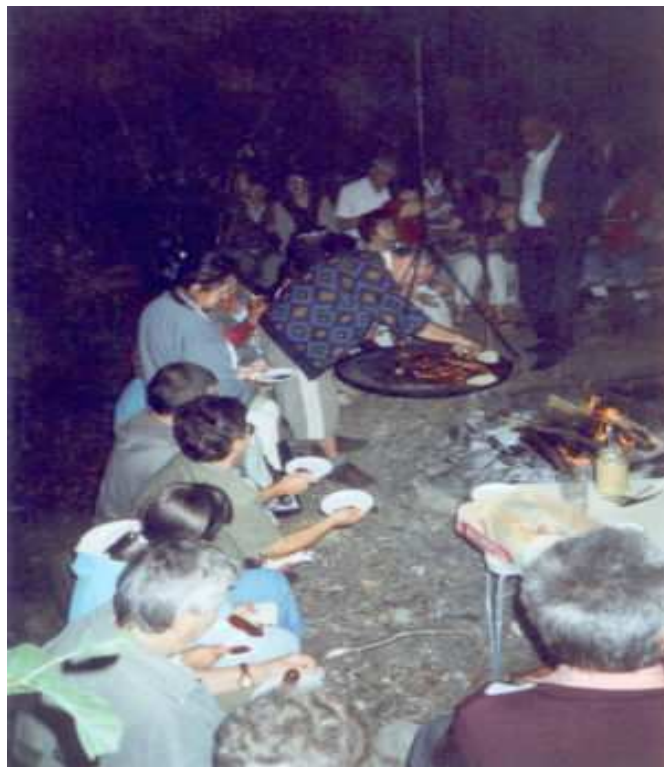
Miłym zakończeniem dnia była biesiada przy ognisku, którą przerwał niespodziewany deszcz