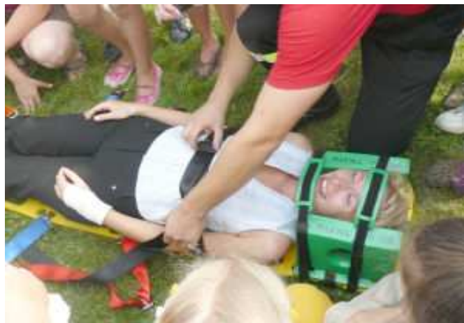
Pokazy ratownictwa medycznego w wykonaniu tyczyńskich strażaków

Uczestnicy cieszyli się zwłaszcza z wręczanych medali, których na co dzień nie otrzymują, gdyż ich status materialny i sprawność psychofizyczna wyklucza z rywalizacji ze zdrowymi rówieśnikami.