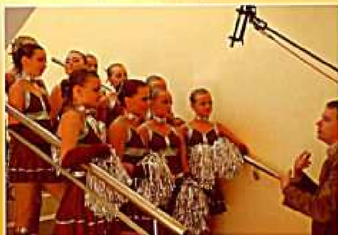
Tyczyn 2007. I Mistrzostwa Województwa Podkarpackiego - wywiad dla TVP Rzeszów