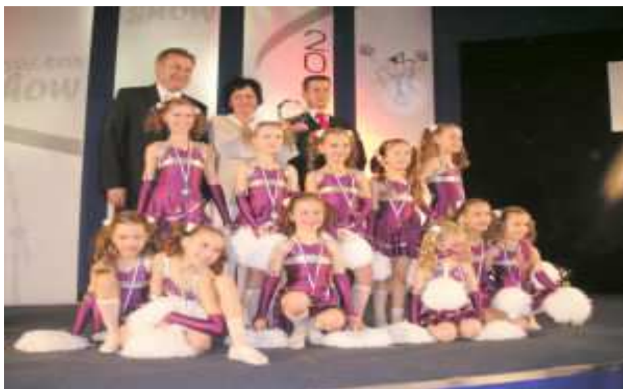
Sosnowiec 2007. Ogólnopolski Turniej Cheer Dance Show

Dziękuję władzom miasta, dyrekcji SP, sponsorom i współorganizatorom imprez oraz Rodzicom pomagającym przy organizacji turnieju, dowożącym dzieci na zawody, oferującym swój czas, trud i dobre serce.