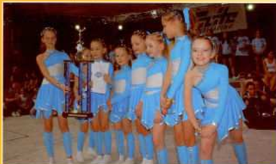
Niemcy 2008. Turniej Międzynarodowy III Elite Beach Cup - zdobywczyńie II miejsca w kat. Pee Wee (młodzież)