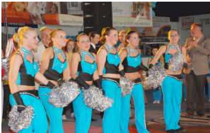
Tarnów 2008. Łzy szczęścia - mamy awans do Mistrzostw Europy 2009

Lata 2006-2008 obfitowały w ważne wydarzenia. „Flimero” aktywnie uczestniczyło w imprezach sportowych i odnosiło liczne sukcesy.