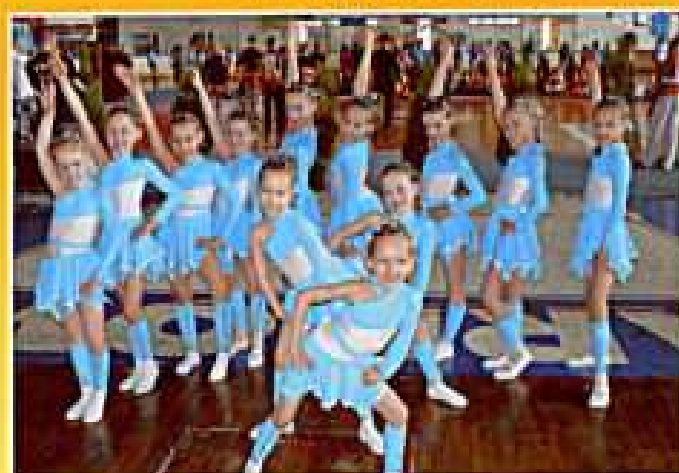
Turnów 2008. Wdzięczne maluchy na Mistrzostwach Polski lubią być widoczne