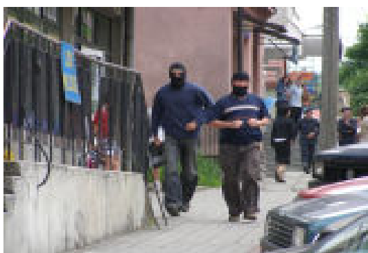
Napad na sklep „GS” przez nieznanych migrantów wymagał interwencji policji.