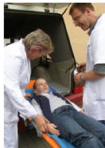
Pomocy medycznej po wydostaniu dziewczynki z pożaru udzielili jej pielęgniarki i lekarze z tyczyńskiego Ośrodka Zdrowia