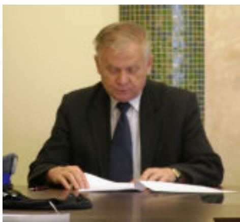
Szef Gminnego Zespołu Reagowania zebrał informacje o sytuacji w gminie i wydał członkom sztabu polecenia.