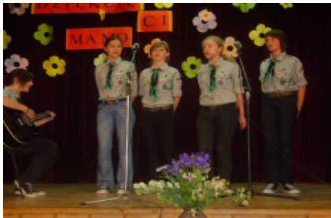
Występ harcerek z 48 Drużyny Harcerskiej „Jerzyki” im. św. Jerzego z Budziwoja

W podzięce za trud włożony w wychowanie, 24 maja br. w Domu Ludowym w Budziwoju, dzieci i młodzież przygotowali program artystyczny pt. „Dziękuję ci Mamo”. Mamy