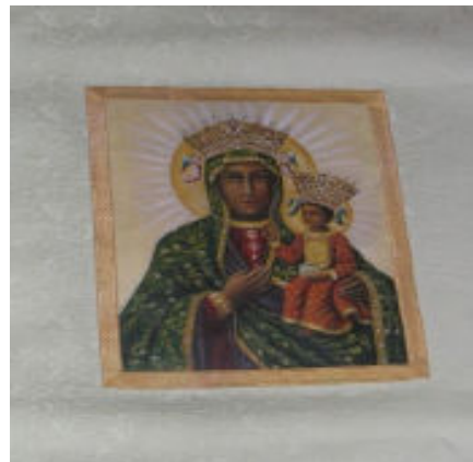
i po renowacji