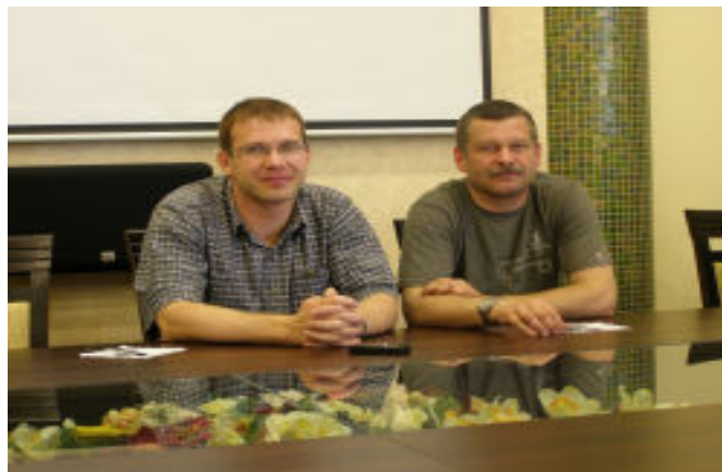
W ćwiczeniach obronnych wzięły udział także służby medyczne z Ośrodka Zdrowia w Tyczynie

O godz. 12.10 dyżurny Stałego Dyżuru podał informację o rozwinieciu akcji kurierskiej doręczania dokumentów powołania żołnierzom rezerwy. Prowadzący i wykonawcy otrzymali i rozdysponowali 100 kart powołania dla żołnierzy rezerwy w celu ich doręczenia przez kurierów. Wezwani kurierzy otrzymali karty powołania i wyruszyli w trasy doręczeń. Po powrocie dokonali rozliczenia z doręczalności tych kart, a następnie sporządzony został meldunek z wyników i przebiegu akcji kurierskiej.