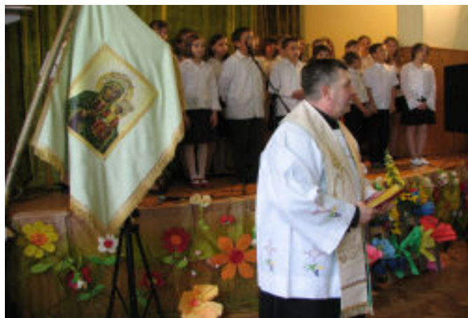
Poświęcenie odnowionego sztandaru

Ufundowanie sztandaru świadczy o silnym ruchu chłopskim, a uroczystość poświęcenia w 1938 r. miała charakter wielkiej manifestacji, w której wzięli udział nie tylko mieszkańcy Borku, ale także okolicznych miejscowości. Datę ufundowania sztandaru udało się ustalić na podstawie nazwisk wygrawerowanych na gwoździach umieszczonych w drzewcu, bowiem wśród nich były nazwiska dwóch księży, którzy przebywali w naszej Parafii w tym samym czasie (informację tę przekazała Kuria Biskupia z Przemyśla).