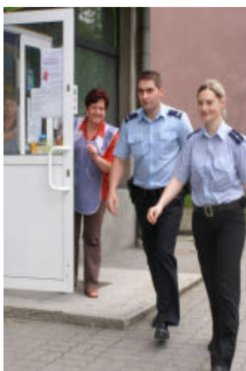
Dzięki wskazaniu funkcjonariuszom kierunku ucieczki rabusiów przez jedną z ekspedientek napadniętego sklepu, udało się ich szybko złapać.