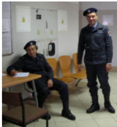
Panowie, którzy pełnili funkcje porządkowo-ochronne legitymowali wszystkie osoby wchodzące na teren Urzędu Miejskiego.