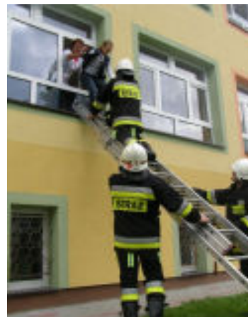
Pozorowany pożar został sprawnie ugaszony, a Karolinka uwięziona w płonącej szkole, uratowana.