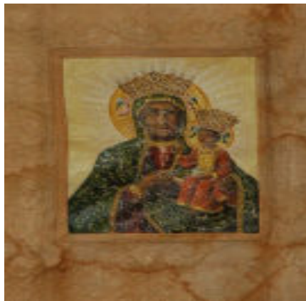
Sztandar przed renowacją