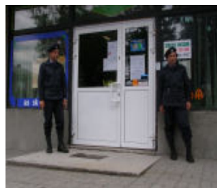
Drużyna porządkowo-ochronna pilnuje napadniętego sklepu.