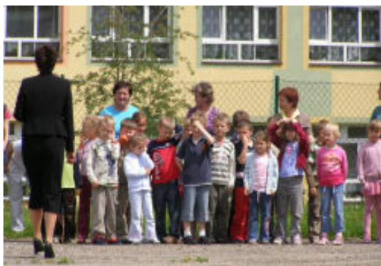
Jedną z akcji w ramach ćwiczeń obronnych, była ewakuacja SP w Tyczynie.