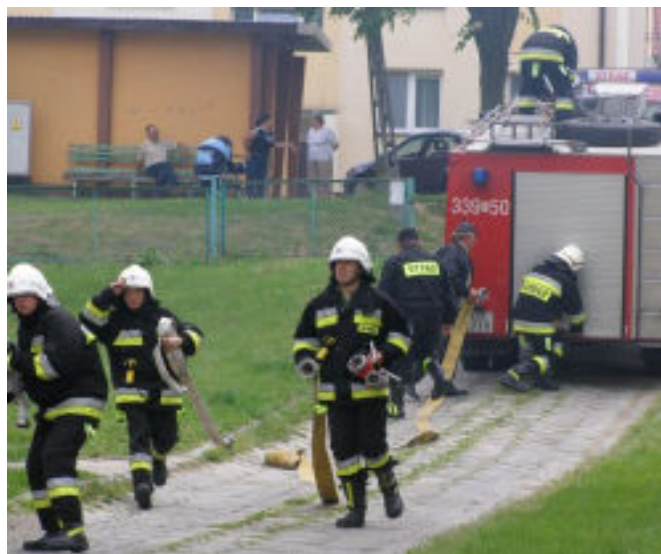
Przyjazd straży pożarnej był ciekawym wydarzeniem nie tylko dla dzieci. Również okoliczni mieszkańcy chętnie oglądali akcje prowadzone przez strażaków.