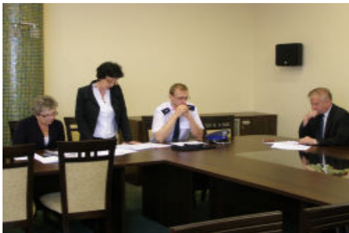
Członkowie sztabu kryzysowego przedstawiają sposoby reagowania na zagrożenia i możliwe plany działania.