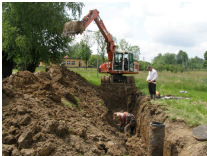
Kanalizacja Tyczyn, Osiedle 600-lecia

do wymogów Unijnych w zakresie: przeprowadzenia przetargu, wyboru wykonawcy robót i realizacji zadania. Do wniosku wykazano cały zakres wodociągu w przedziale na lata 2010 i 2011.