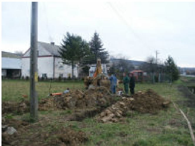
Kanalizacja Borek Stary