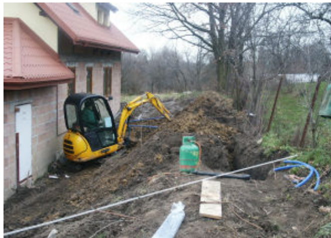
Budowa wodociągu Tyczyn - Mokra Strona

Zakończono budowę wodociągu realizowanego przez firmę „Awers” Sp. z o.o. ze Zgłobnia i wykonano wodociąg z rur PE o średnicy 50 do 110 mm o łącznej długości 621 mb. Doprowadzono wodę do 32 posesji rurami PE o średnicy 40 mm i długości 625 mb. Zrealizowany wodociąg oprócz doprowadzenia wody dla nowych odbiorców połączy pierścieniem sieć miasta Tyczyn z wodociągiem Kielnarowskim. Dzięki