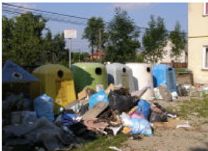
Wysypisko za Domem Ludowym w Budziwoju