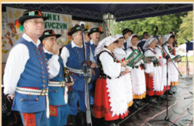
„Tyczyniaci” tuż przed występem