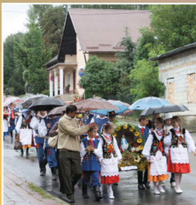
„Mali Hermanowiaci” niosą wieniec na czele korowodu dożynkowego