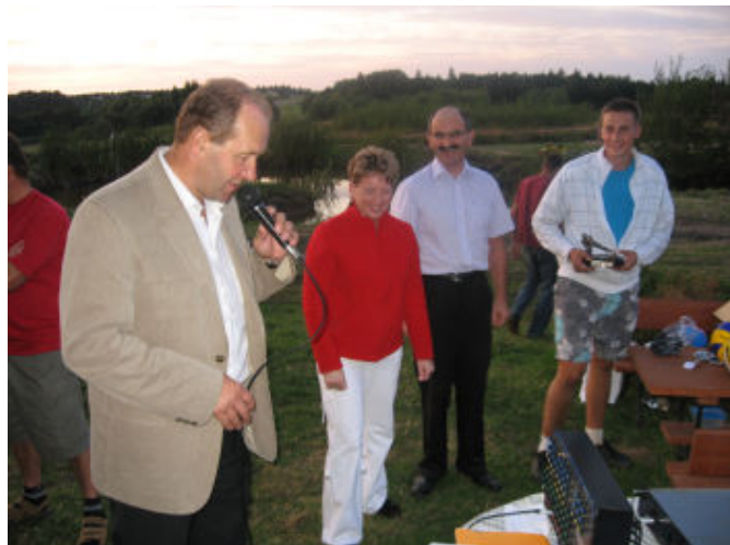
Zakończenie turnieju, wręczenie nagród