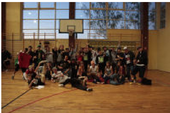
Pamiątkowe zdjęcie uczestników turnieju i organizatorów