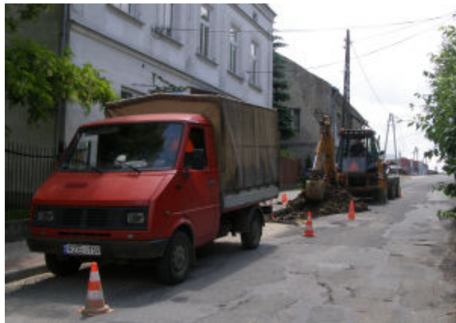
Remont wodociągu staromiejskiego w Tyczynie, ul. Kilińskiego

Zakończony został remont wodociągu w ul. Kilińskie-go. Wymieniono stare rurociągi na nowe z polietylenu w całości wodociągu istniejącego w zwartej zabudowie najstarszej części miasta Tyczyna.