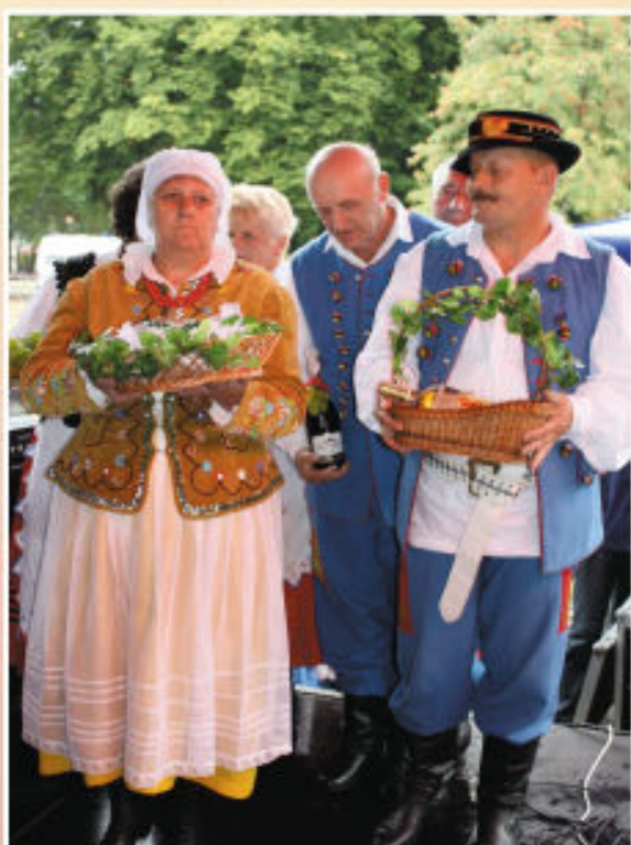
Delegacja z Budziwoja idzie z darami do Burmistrza Tyczyna