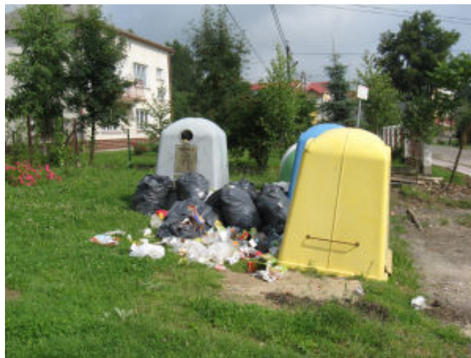
Pojemniki na śmieci w Hermanowej koło Domu Ludowego

są wszelkiego rodzaju odpady, Gmina rozważa możliwość ich likwidacji.