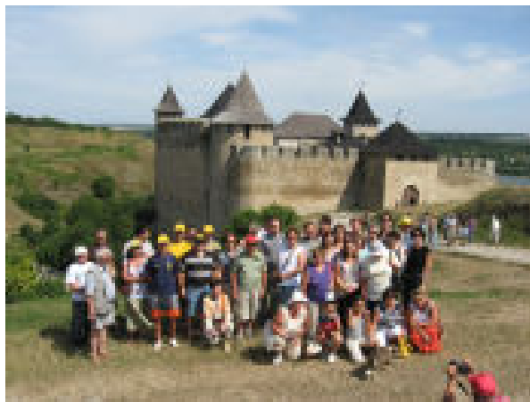
Uczestnicy wycieczki przed twierdzą w Chocimiu