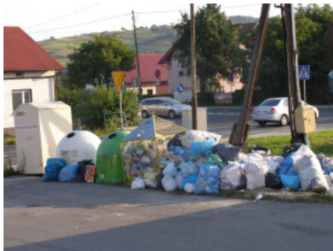
W Tyczynie obok pojemników leżą sterty śmieci

Wobec ciągle pogarszającej się sytuacji przy pojemnikach na surowce wtórne, przy których notorycznie podrzucane