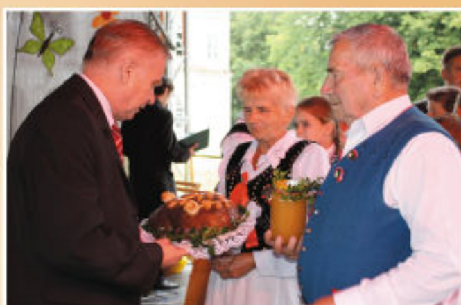
Pięknie wypieczone chleby trafiły na ręce Burmistrza