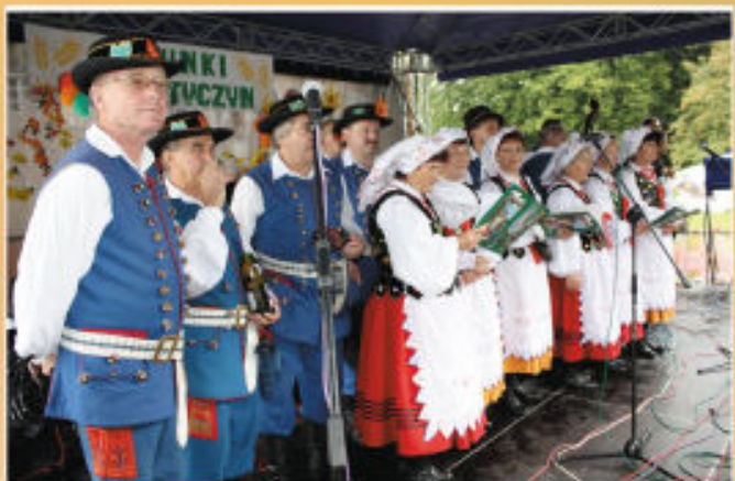
„Tyczyniaci” tuż przed występem