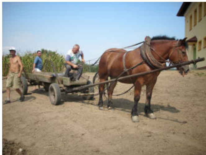
Bez tego sprzętu nie dalibyśmy rady