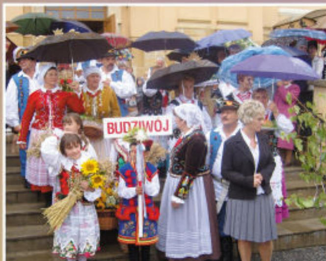
Delegacje Dożynkowe wychodzą z kościoła po uroczystej Mszy Świętej