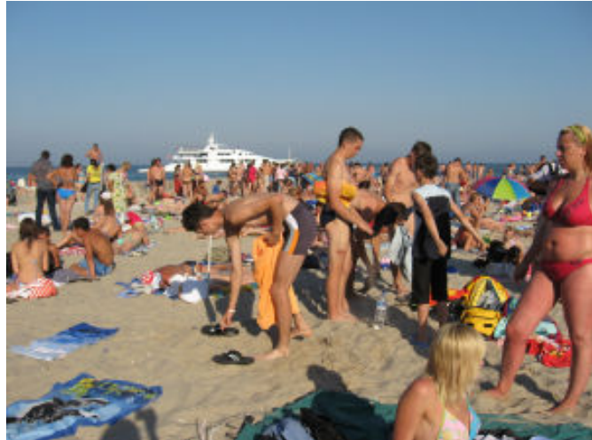
Wypoczynek nad Morzem Czarnym - plaża Złoty Brzeg

Czas pobytu na Wschodzie dał także możliwość lepszego poznania życia naszych sąsiadów na co dzień. Oprócz czę-