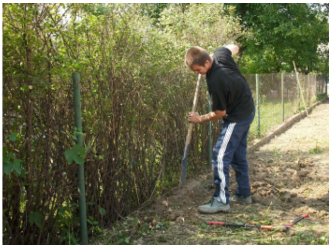
Najtrudniej było wykarczować krzewy przy ogrodzeniu

Z pomocą pośpieszyli również nasi radni, pan sołtys oraz jak zwykle niezawodni rodzice. Pracy było niemało, należało wykonać odprowadzenie wody opadowej z rynien oraz zniwelować i uporządkować teren przed budynkiem, usunąć olbrzymie pniaki pozostałe po wycince topoli obok drogi dojazdowej,