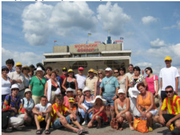
Przy Odesskim porcie

Tym co zaskakuje, jest wielonarodowość mieszkańców skupionych przy Morzu Czarnym. Najlepszym tego przykładem jest miasto Odessa, w którym mieszkaliśmy. Żyje w nim ponad 120 różnych narodowości, tworzących specyficzny klimat wielokulturowości i różnorodności, które się nawzajem uzupełniają w egzystencji codziennej.