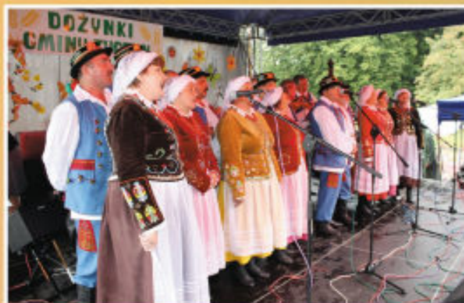
Występ zespołu ludowego „Budziwojce”