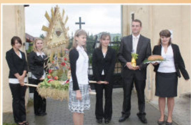
Młodzież ze Stowarzyszenia „Wspólne Dobro” z Hermanowej po raz pierwszy uczestniczyła w uroczystościach Dożynkowych