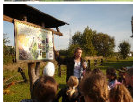
W nadleśnictwie Głogów Małopolski