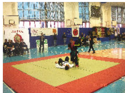
Pokaz realnej samoobrony w pięciu sekwencjach w wykonaniu Michała Kocura