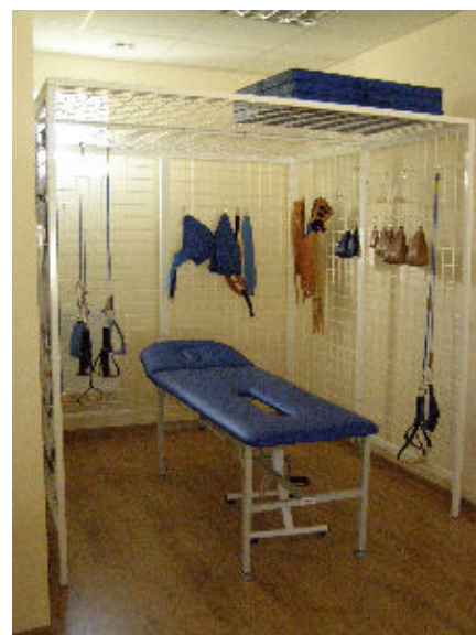
Pomieszczenie do rehabilitacji pacjentów