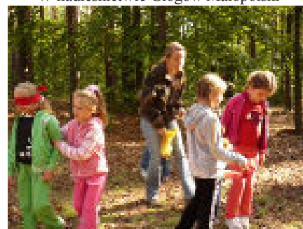
Zabawy ekologiczne w borze