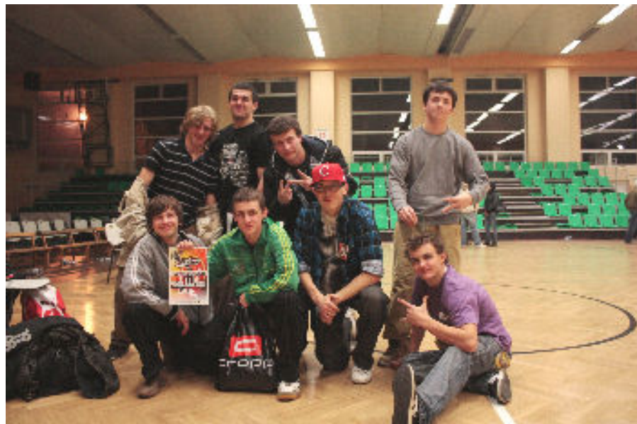
Pamiątkowe zdjęcie z zawodów w Przemyślu

Skladam serdeczne podziękowania wszystkim tym, którzy uczestniczyli w pożegnaniu mojej Mamy, oraz dziękuję za wszystkie intencje