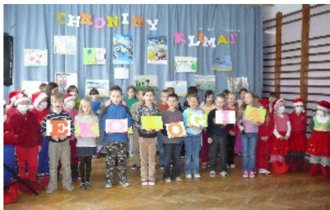
Kl. II a