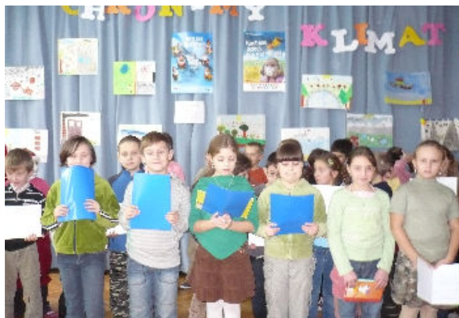
Kl. III a