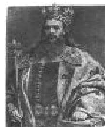
Kazimierz III Wielki Jana Matejko