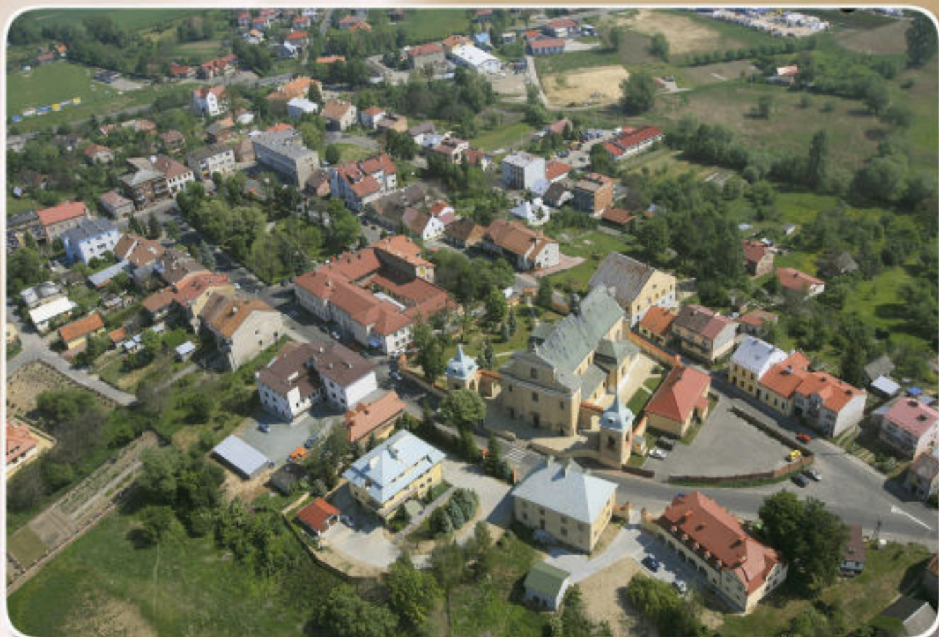
Tyczyn miastem Kazimierza III Wielkiego