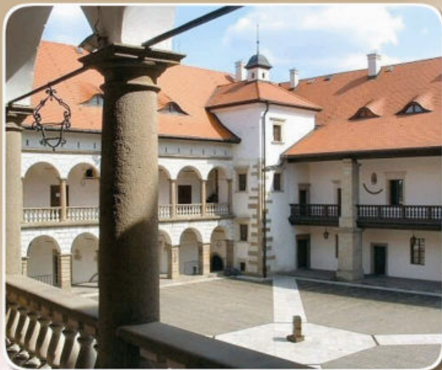
Zamek królewski w Niepołomicach wybudowany z rozkazu Kazimierza III Wielkiego, widok na dziedziniec

Do Stowarzyszenia należy 147 miast związanych z działalnością fundacyjną lub osobą króla Kazimierza Wielkiego, w tym pięć miast położonych na terenie Ukrainy. W województwie podkarpackim jest 25 miast należących do Stowarzyszenia, są to: Baranów Sandomierski, Brzozów, Dębica, Dębowiec, Domaradz, Dukla, Frysztak, Jasło, Jaślicka, Jodłowa, Kołaczyce, Krosno, Leżajsk, Lubaczów, Łańcut, Odrzykoń, Osiek Jasielski, Pilzno, Przemyśl, Przyszów, Raniżów, Ropczyce, Rzeszów, Sanok i Tyczyn.