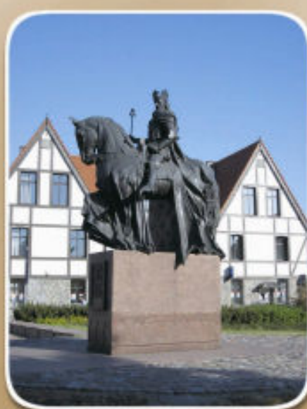
Pomnik Kazimierza III Wielkiego w Bydgoszczy