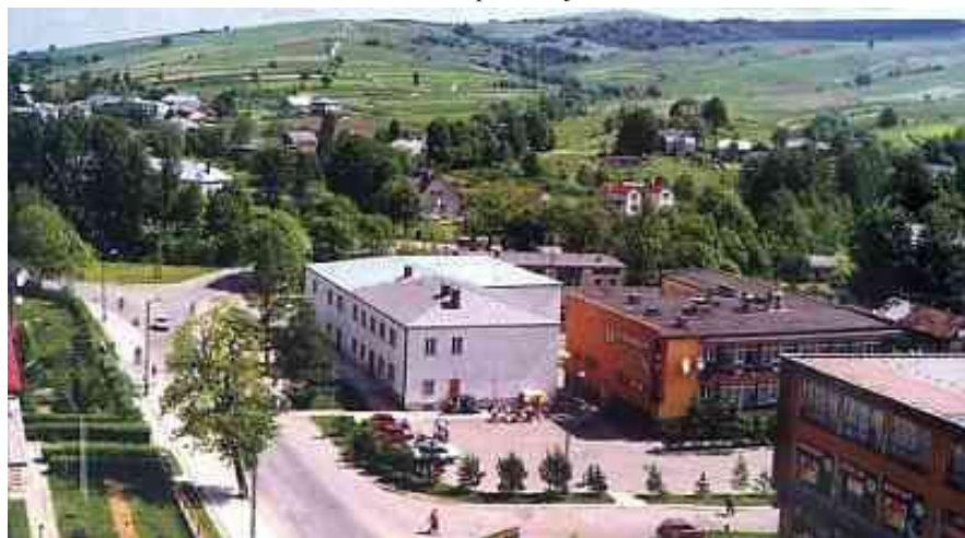
Bukowsko w chwili obecnej