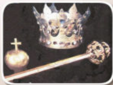
Insygnia koronacyjne Kazimierza III Wielkiego