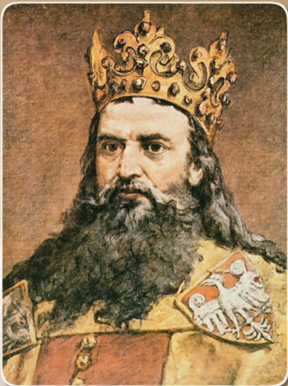
Kazimierz III Wielki, obraz Jana Matejki