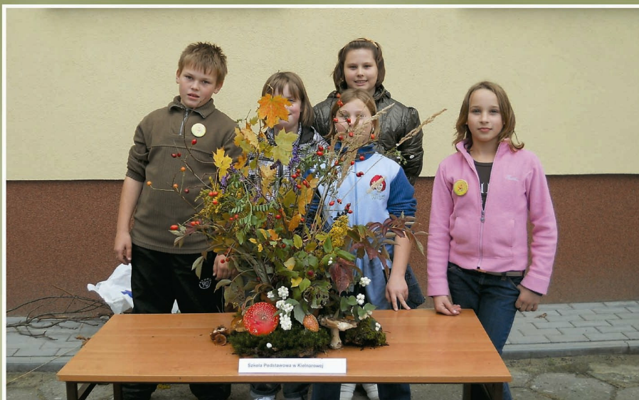
Uczestnicy konkursu plastycznego z wykonaną pracą