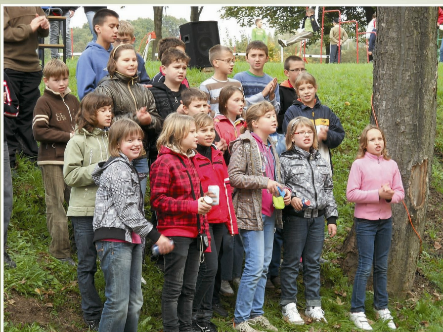
Konkurs na piosenkę rajdową

2 października odbył się XXVIII Rajd Pieszy Uczniów Szkół Podstawowych Gminy Tyczyn. Z pięciu szkół naszej gminy na samodzielnie opracowane trasy, dostosowane do możliwości uczniów i pogody, wyruszyły grupy uczniów wraz z opiekunami. Wszystkie trasy wiodły do Kielnarowej, gdyż nasza szkoła była organizatorem tegorocznego rajdu.