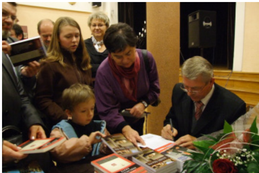
Senator Czesław Ryszka podpisuje swoje książki