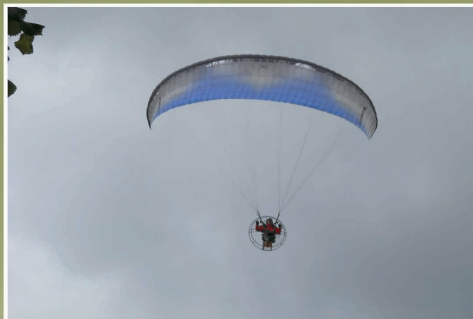
Pokaz lotu na paralotni