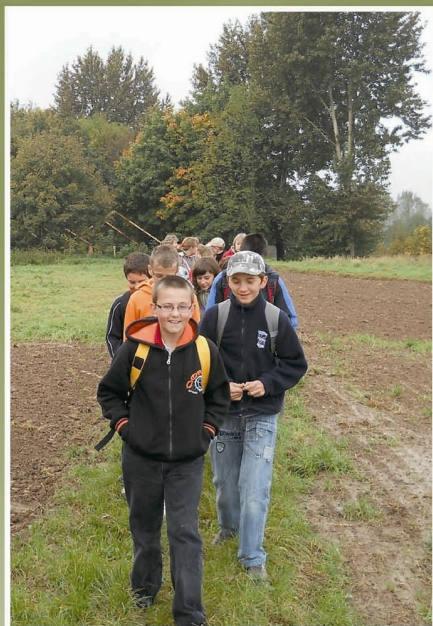
Grupa z SP w Kielnarowej na szlaku