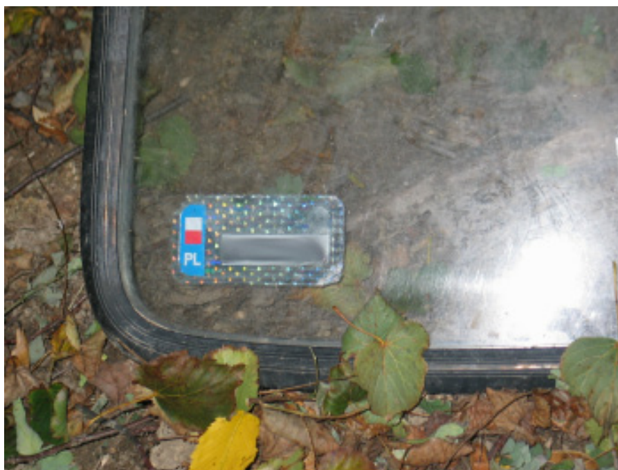
Zdjęcie nadesłane przez „Życzliwego”. Na wyrzuconej szybie widoczne są numery rejestracyjne samochodu, które w związku z ochroną danych osobowych zamazujemy

„Życzliwemu” za przesłany materiał serdecznie dziękujemy! Cieszymy się, że wśród nas są ludzie dla których ochrona środowiska jest ważna. Bez wątpienia właściciel wyrzuconej szyby poniesie zasłużone konsekwencje.