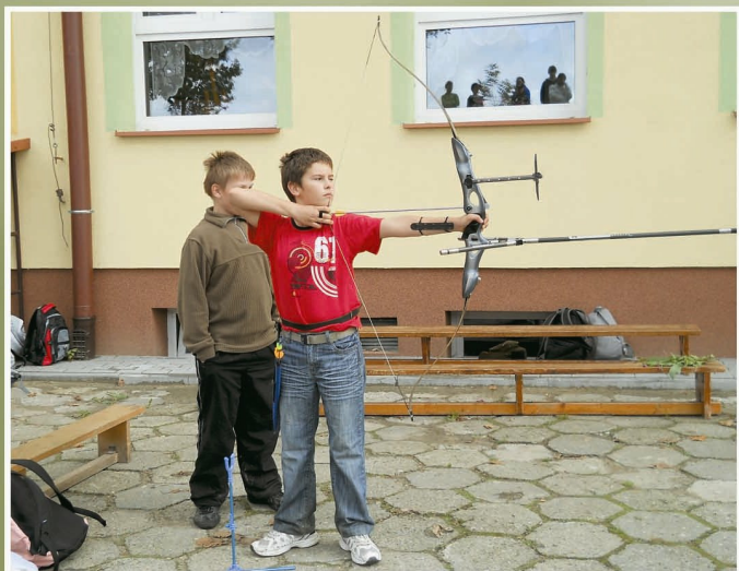
Pokaz strzelania z łuku sportowego