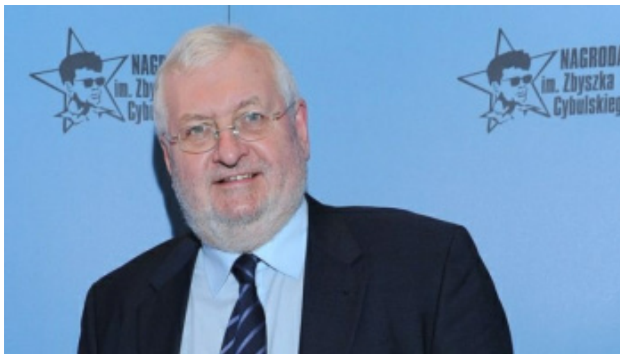
Janusz Zaorski reżyser filmu „Syberiada polska”