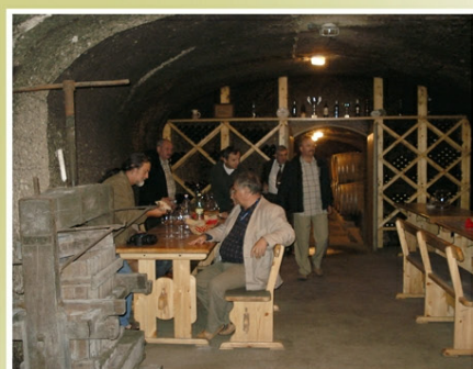
Jednym z elementów szkoleń były degustacje wina