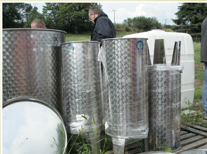
Targi sprzętu i maszyn służących do uprawy i produkcji wina