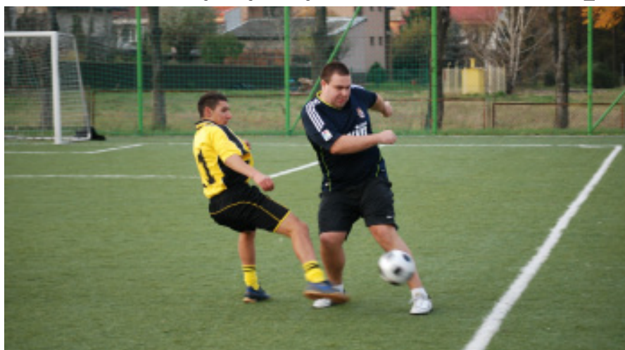
W turnieju nie brakowało emocji i ostrej rywalizacji

Tyczyna 3-2; Nowiny - Jar 2-2 (w karnych 3-2); Głos Tyczyna - Szerbud 2-4.