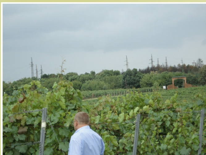
Doświadczalna plantacja w Instytucie Wina w Egerze