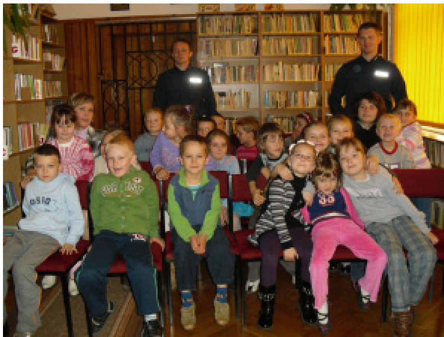
Zerówkowicze z SP w Tyczynie w towarzystwie policjantów

Przedszkolaki i uczniowie SP w Tyczynie czynnie uczestniczyły w spotkaniu, zadawały pytania, dzieliły się swoimi spostrzeżeniami i doświadczeniami. Lekcja ta będzie miała zapewne wpływ na kreowanie pozytywnego wizerunku policjanta i znaczenie jego pracy dla społeczeństwa. Serdecznie dziękujemy Panom Policjantom za pomoc w przygotowaniu spotkań z dziećmi.