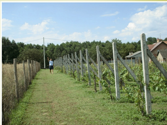
Plantacja winorośli w Strażowie