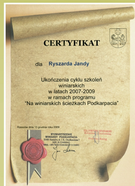
Certyfikat ukończenia cyklu szkoleń w latach 2007-2009, „Na winiarskich szlakach Podkarpacia”