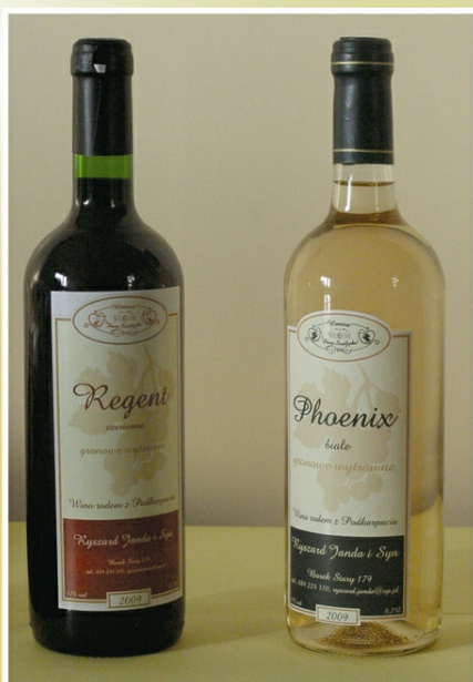
„Regent” i „Phenix” rocznik 2009