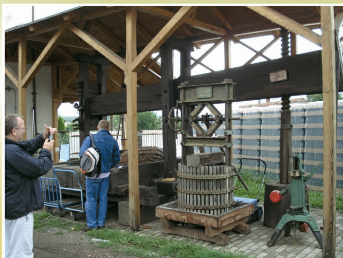
Zabytkowa prasa do wina