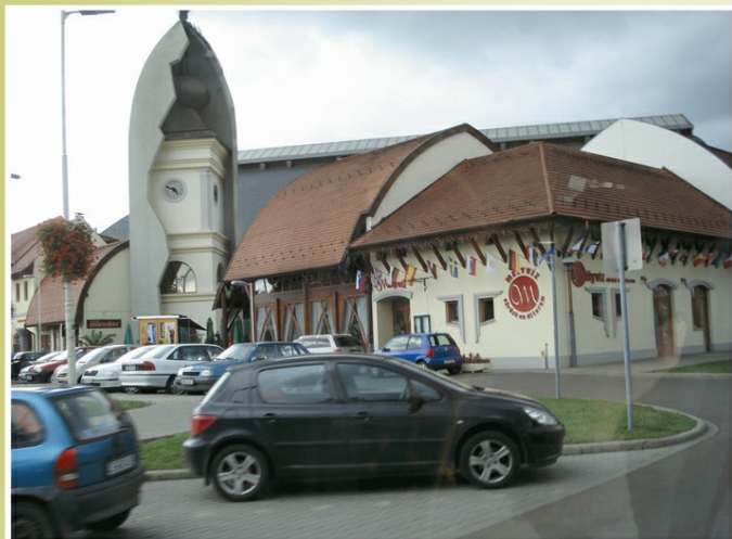
Uczestnicy wyjazdu zwiedzali Eger