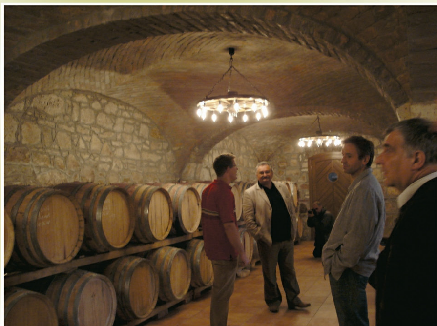
Wnętrze typowej winiarni węgierskiej