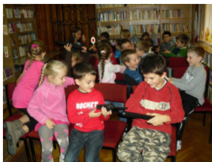
„Zajęcia praktyczne” - czy możemy być policjantami?