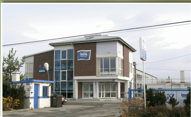
Firma „Bella” w Budziwoju