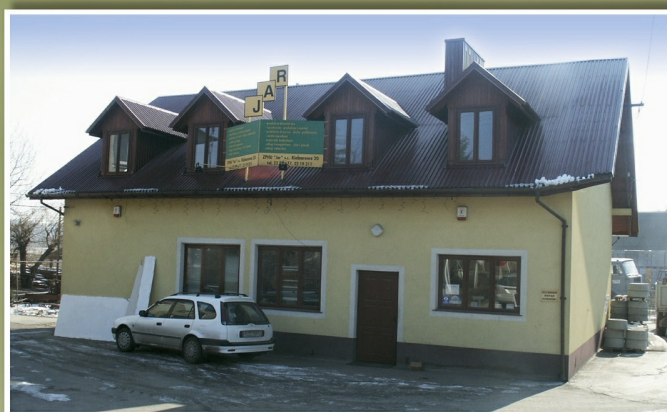
„Jar” w Kielnarowej