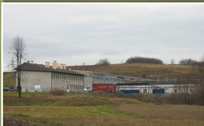
„Rzeszowianka” w Borku Starym