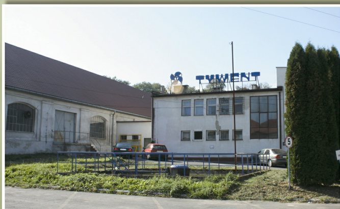
„Tywent” w Tyczynie