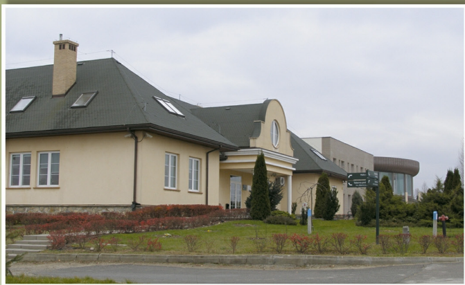
Budynki WSiIZ w Kielnarowej Królce