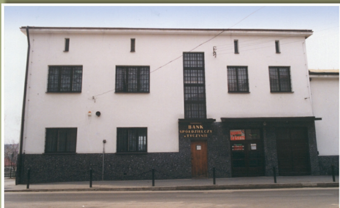
Bank Spółdzielczy w Tyczynie przed i po remoncie