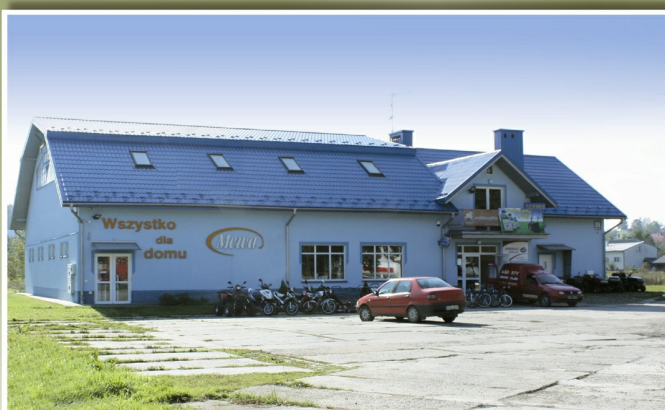
Sklep wielobranżowy „Mewa 2” w Tyczynie