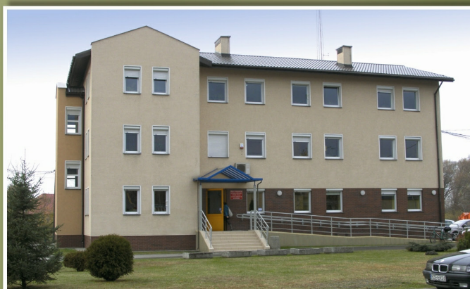
„MPGK” w Białej