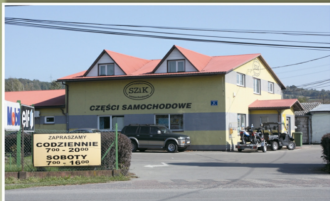
„SZiK” w Tyczynie