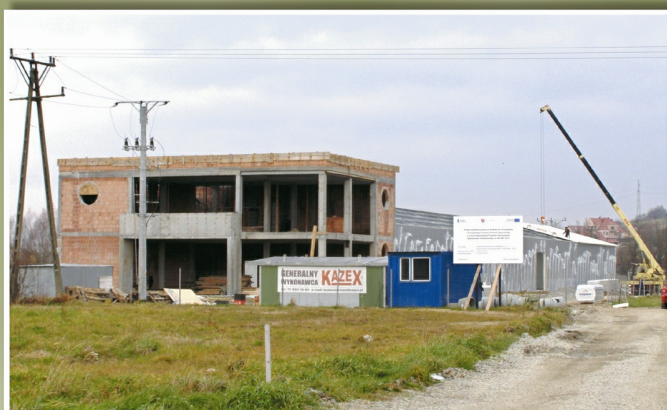
W Tyczynie powstaje firma produkująca meble