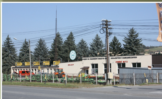
POM w Tyczynie