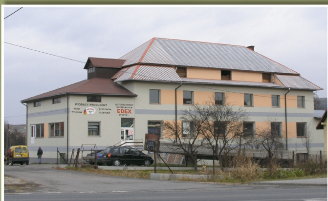
Sklep „Edex” w Tyczynie