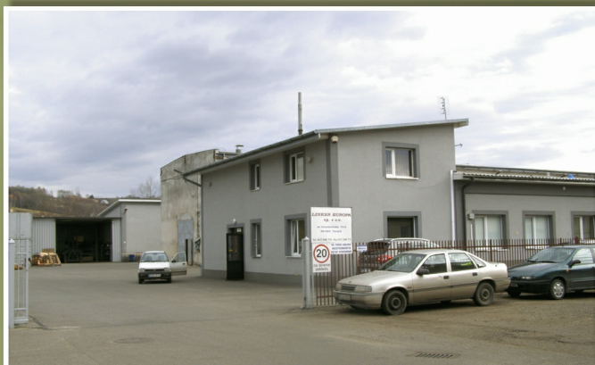
„Linker Europa” w Tyczynie