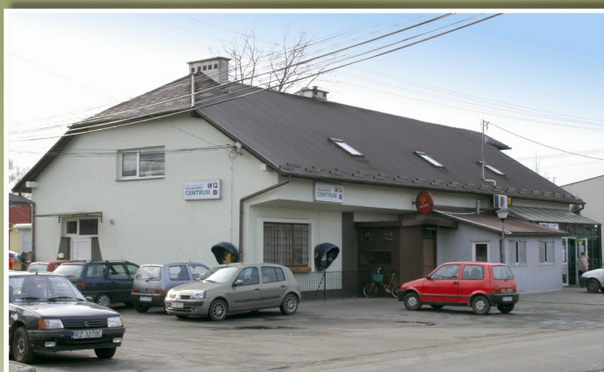
„Delikatesy Centrum” w Budziwoju