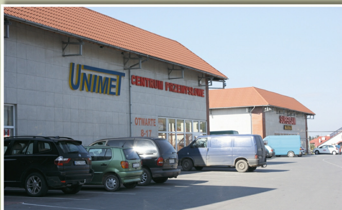
Centrum przemysłowe „Unimet” i Supersam „Marmax”