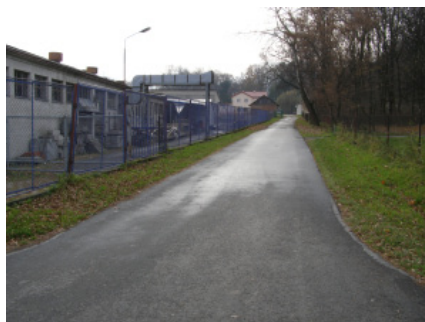
ul. Orkana - boczna

W ramach bieżących remontów dróg wykonano remonty częściowe masą asfaltową na terenie miasta Tyczyna, dróg gminnych na terenie Kielnarowej, Matysówki, Hermanowej, Borku Starego. Utwardzono drogi kruszywem łamany, oczyszczono rowy przydrożne, wykonano chodniki, zatoki przystankowe, przy ul. Orkana i Grunwaldzkiej zakupiono i wbudowano zadaszenia przystankowe oraz trzy zadaszenia przy ul. Mickiewicza w Tyczynie. Wartość wykonanych prac wynosi 458.811,00 zł.