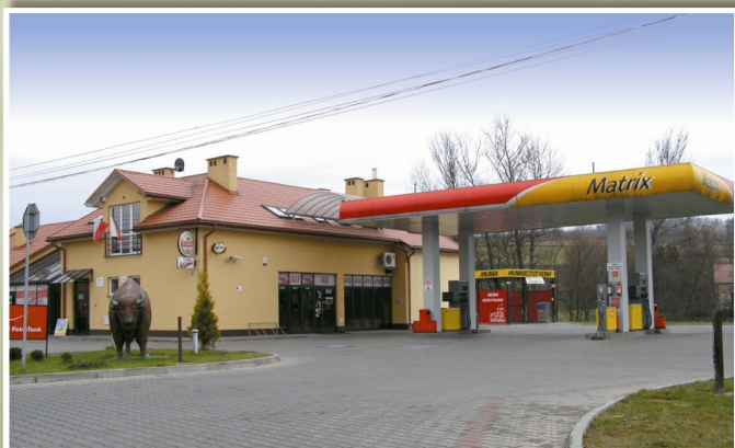
Stacja paliw w Borku Starym