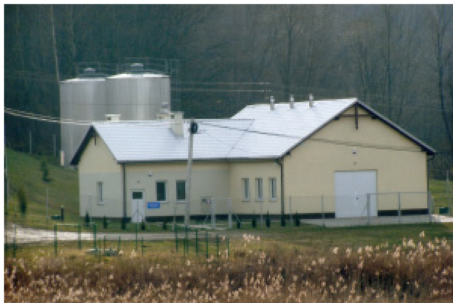
Nowoczesna Stacja Uzdatniania Wody w Tyczynie. Została oddana do eksploatacji w 2005 r.

Rozliczenie za zrzut ścieków pomiędzy eksploatatorem kanalizacji PGK „EKO-STRUG” w Tyczynie, a MPWiK w Rzeszowie odbywa się na podstawie odczytów przepływomierzy ścieków zlokalizowanych w Białej i Matysówce.