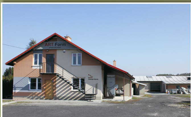
„Art Form” w Hermanowej