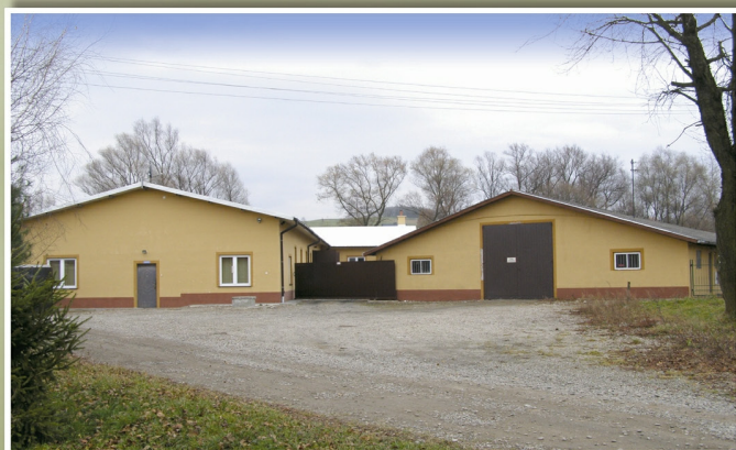
Firma „Bramex” w Borku Starym