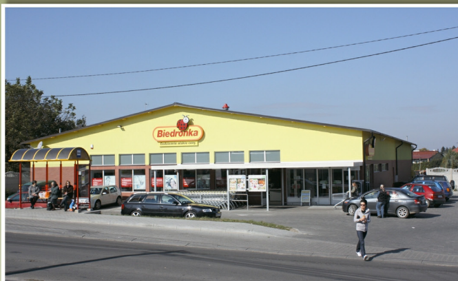
„Biedronka” w Tyczynie