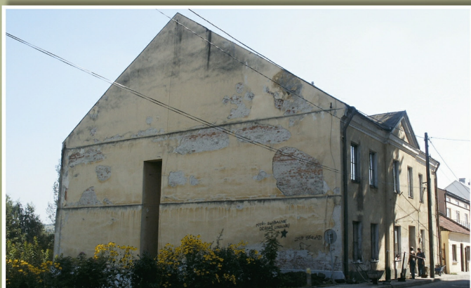
Budynek starej szkoły w Tyczynie przed i po remoncie