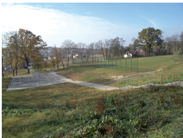
Jedno z boisk przy Szkole Podstawowej w Borku Starym