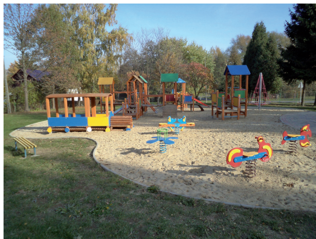
Fragment placu zabaw przy Szkole Podstawowej w Tyczynie

3. Przy Szkole Podstawowej w Tyczynie wykonany został plac zabaw dla dzieci za kwotę 109.298,09 zł , przez firmę PDEM Sp. z o.o. z Niebylca.