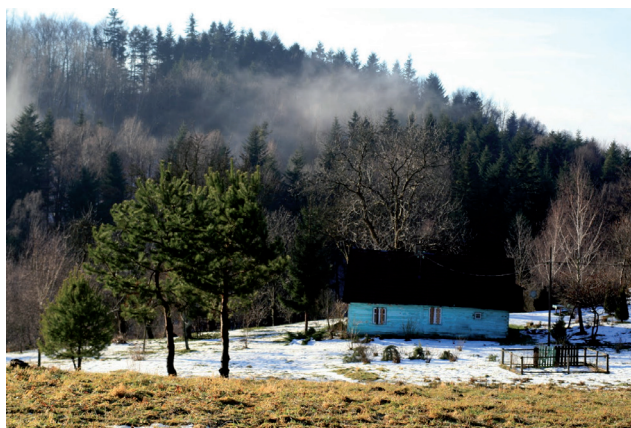
Jeden z pięknych widoków

Haczów - drewniany kościół zbudowany pod koniec XIV w. pw. Wniebowzięcia NMP. Świątynia ta jest największym kościołem drewnianym w stylu gotyckim w Europie,