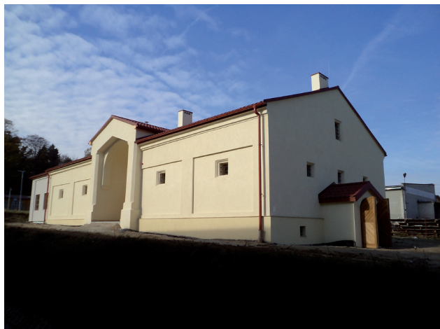
Budynek dawnego Spichlerza po remoncie

W związku z zaleceniami Wojewódzkiego Konserwatora Zabytków wynikła potrzeba opracowania projektu budowlanego zamiennego i ekspertyzy przeciwpożarowej. Należało