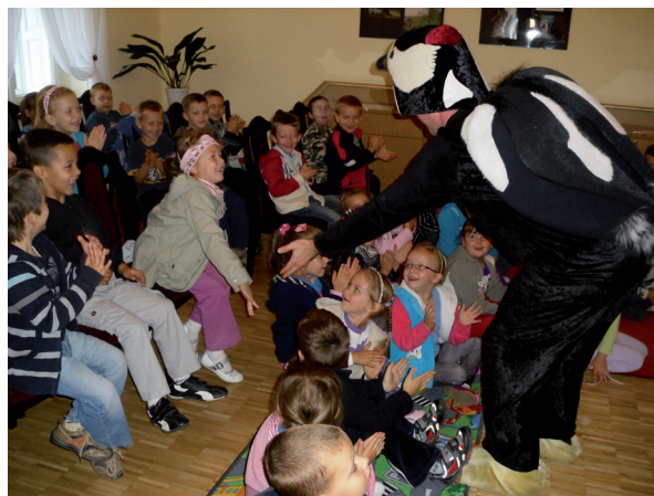
Oto jak bawiły się dzieci w Bibliotece w Tyczynie

W poniedziałkowy ranek 3 października br., Miejska i Gminna Biblioteka Publiczna w Tyczynie gościła aktorów ze Studia Art-Re z Krakowa . Na spotkanie z nimi zaproszone zostały dzieci z dwóch klas 0 z SP w Tyczynie. Podczas zajęć mali czytelnicy mieli okazję występować na scenie i razem z aktorami współtworzyć przedstawienie pt. Żabka i Bocian . Co było jego treścią? Hanusia, główna bohaterka spektaklu, poszukując przygód, oddala się od domu. W swej wędrówce spotyka przyjaciół: Biedronkę, Bociana i Dzięcioła. Bohaterka w ferworze zabawy gubi drogę do domu. Do poszukiwań lekomyślną Hanusią włączają się leśne ptaki i odwieczny wróg żab - Bocian. Okazuje się, że nawet najwięksi wrogowie mogą zostać przyjaciółmi. Każde z przedstawień w wykonaniu aktorów ze Studia Art-Re ma jakieś ważne przesłanie. Spektakl Żabka i Bocian uświadamia małym dzieciom konieczność niesienia pomocy słabszym i młodszych, a także uczy posłuszeństwa i szacunku względem rodziców. Nie jest to ostatnie spo-