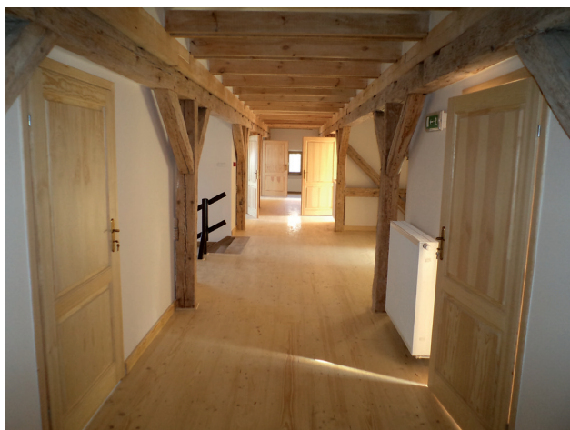
Wnętrze odrestaurowanego budynku dawnego Spichlerza