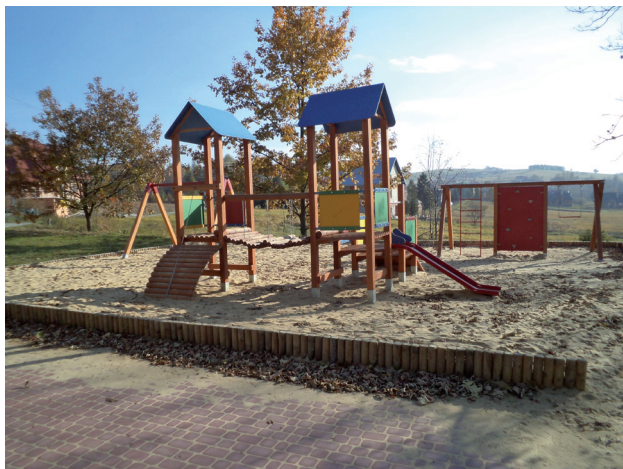
Plac zabaw w kompleksie boisk szkolnych przy SP w Borku Starym

4. Przy Szkole Podstawowej w Borku Starym wykonano kompleks boisk szkolnych, obejmujący: pełnowymiarowe bo-