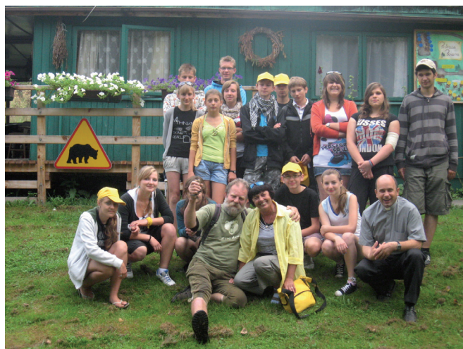
Na Piotrowej Polanie ...

W imieniu Parafialnego Zespołu Caritas w Hermanowej składam serdeczne podziękowania Podkarpackiemu Stowarzyszeniu Pracowników Pomocy Społecznej z siedzibą w Tyczynie za pomoc w pozyskaniu środków z Regionalnego Ośrodka Polityki Społecznej w Rzeszowie na realizację zadania Szkody zdrowotne i rozwojowe występujące u młodych Polaków spowodowane piciem alkoholu poprzez realizację zadań i wspieranie organizacji pozarządowych, kościoła katolickiego, środowisk lokalnych i koalicji lokalnych,