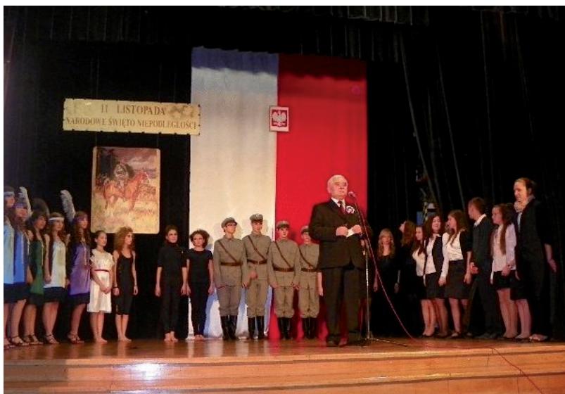
Na zakończenie Burmistrz Tyczyna podziękował wszystkim wykonawcom

Po każdej piosence sala nagradzała wykonawców gorącymi oklaskami. Szczególnie gorące brawa otrzymali