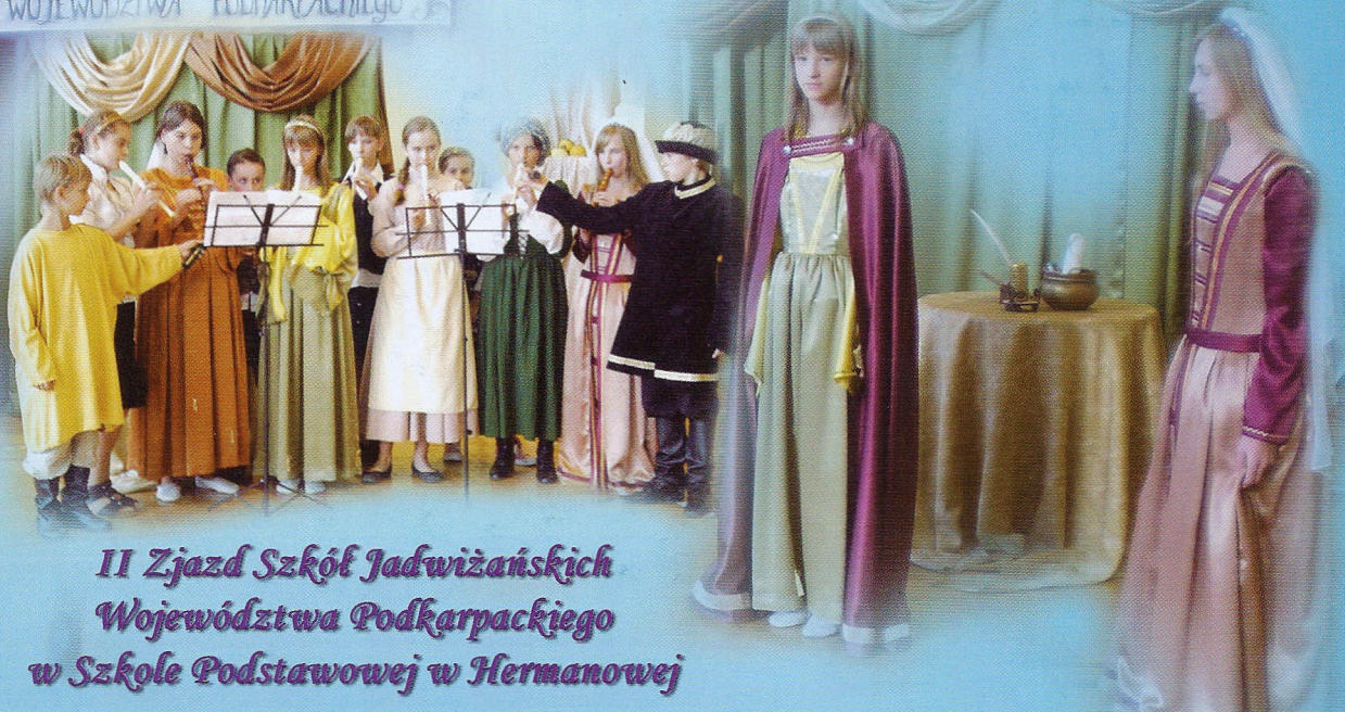
II Zjazd Szkół Jadwizańskich Województwa Podkarpackiego w Szkole Podstawowej w Hermanowej