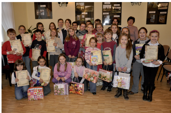
Wspólne zdjęcie laureatów obu konkursów