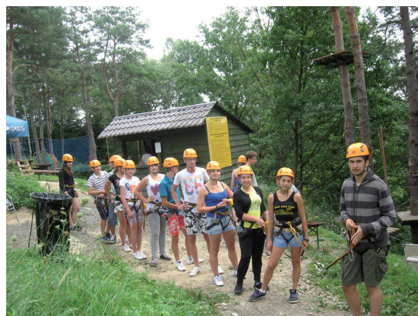
W parku linowym

stawiających sobie za cel ograniczenie zjawiska sprzedaży alkoholu osobom małoletnim oraz promowanie trzeźwości i abstynencji wśród młodzieży na terenie gminy Tyczyn i gminy Lubenia – obszar I Wojewódzkiego programu profilaktyki i rozwiązywania problemów na lata 2007 – 2013, którego realizacja dobiegła końca.