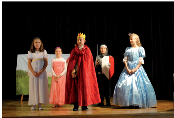
Mali artyści na scenie