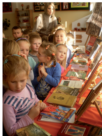
Dzieci z zacięciem oglądają książki o Królowej Jadwidze

Razem obejrzelśmy przedstawienie pt. Czas jechać do Rzeczypospolitej o przybyciu Królowej Jadwigi do Krakowa, w wykonaniu uczniów klasy VI. W czasy średniowieczne widzów przyniosła muzyka dawna i taniec dworski.