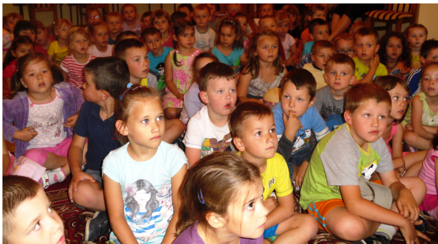
Dzieci z Przedszkola Sióstr Św. Dominika podczas czytania w Bibliotece

W lipcu i sierpniu Miejska i Gminna Biblioteka Publiczna w Tyczynie będzie czynna od poniedziałku do piątku w godz. 8.00-16.00 . W soboty biblioteka będzie nieczynna . Za utrudnienia przepraszamy. Przypominamy również Czytelnikom o zwrocie zaległych książek .