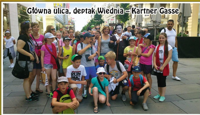
Główna ulica, deptak Wiednia – Kartner Gasse