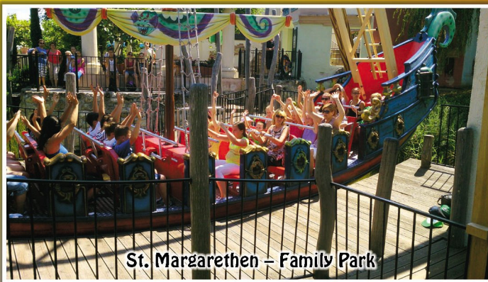
St. Margarethen – Family Park