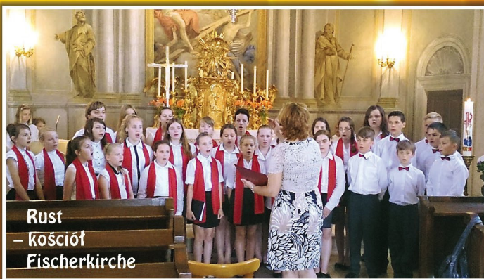
Rust – kościół Fischerkirche