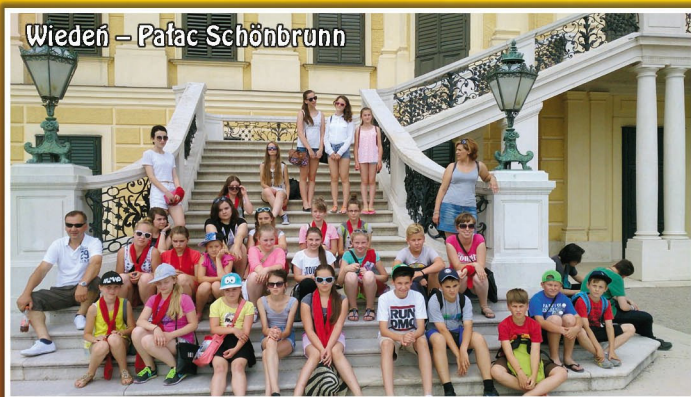
Wiedeń – Pałac Schönbrunn