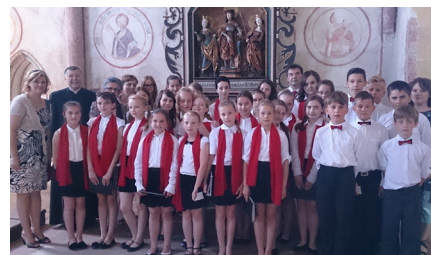
Rust - kościół Fischerkirche