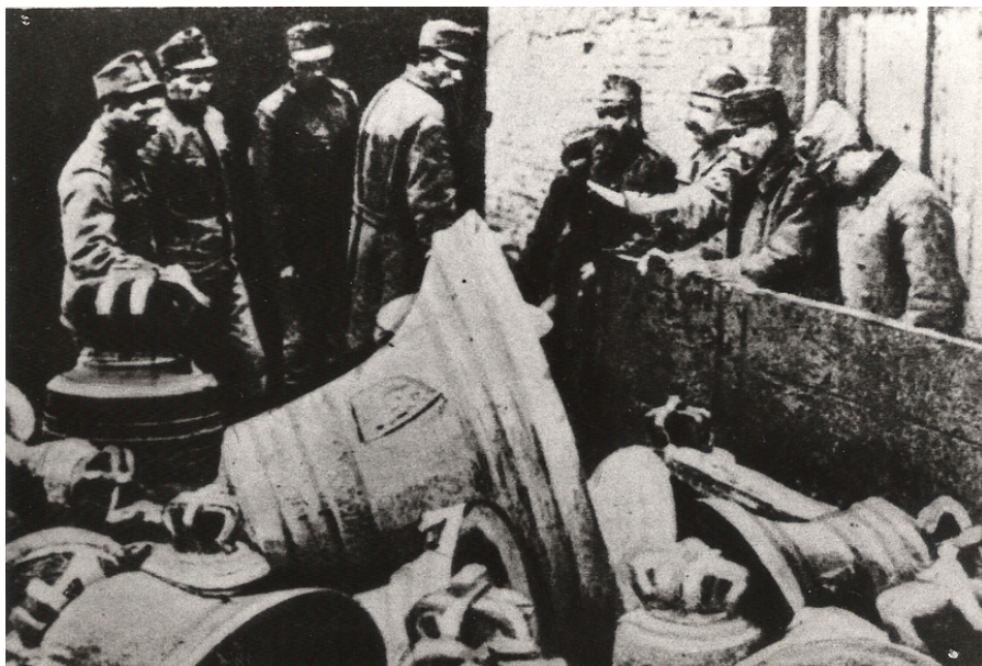
Rekwizycja dzwonów przez Austriaków, miejsce nieznane