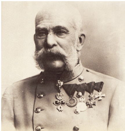
Cesarz Franciszek Józef