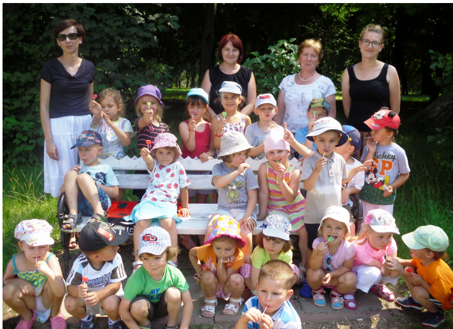
Dzieci z przedszkola Chatka Puchatka

16 lipca br. dzieci z przedszkola Chatka Puchatka poznały przygody bajkowego bohatera Groszka i jego przyjaciół. Wspólne czytanie odbyło się w plenerze tyczyńskiego parku. Nie obyło się bez małego konkursu i zagadek. Na zakończenie zajęć dzieci dostały słodkie co nieco. Główną rolę w zajęciach poświęciliśmy książce, a całe spotkanie było tak zorganizowane, aby czytanie zawsze sprawiało dziecku przyjemność.