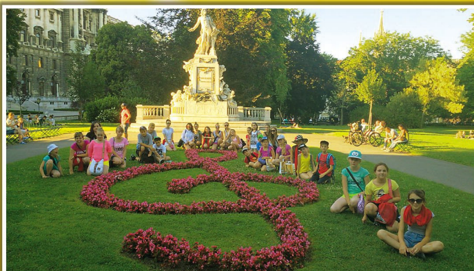
Siedziba cesarzy austriackich – Hofburg, pomnik W. A. Mozarta