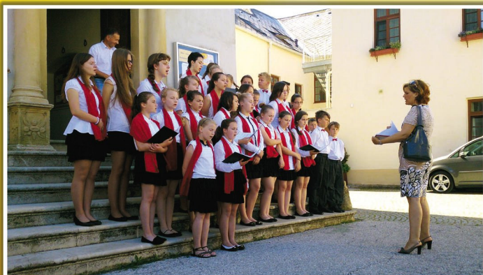
Na schodkach przed kościołem Stadtpfarrkirche w Rust