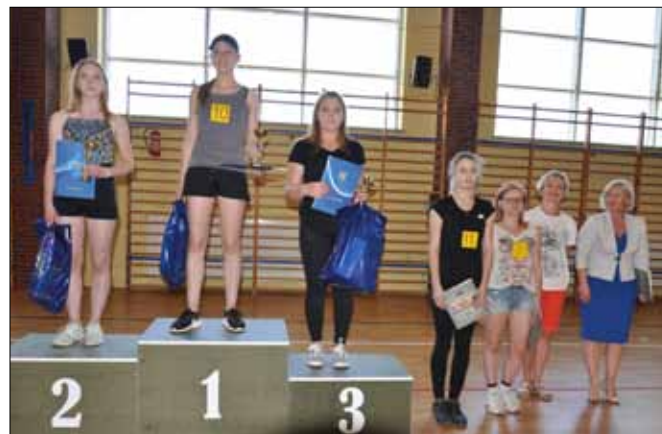
Nagrodzone zawodniczki Zespołu Szkół w Tyczynie w 12. Biegu Tyczyńskim wraz z dyrektorem ZS w Tyczynie

- nauczyciel wych. fizycznego w ZS w Tyczynie