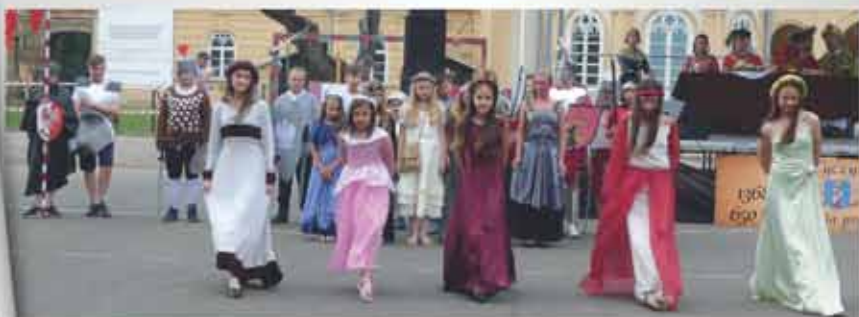
Pokaz tańca dworskiego