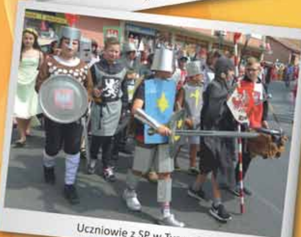
Uczniowie z SP w Tyczynie