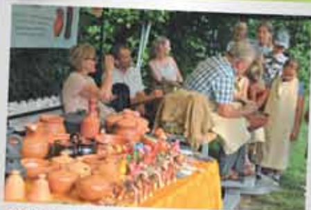
Podczas pikniku można było obejrzeć i kupić m.in. wyroby garncarskie