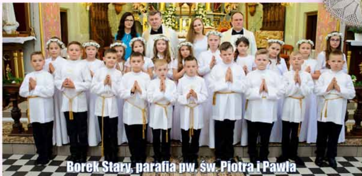
Borek Stary, parafia pw. św. Piotra i Pawła