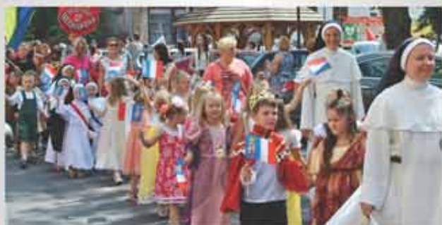
Dzieci z przedszkola sióstr Dominikanek

W przemarszu orszaku królewskiego udział wzięli m.in.: