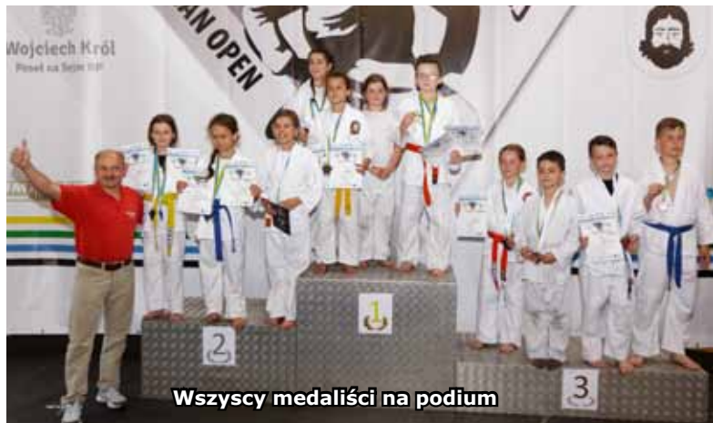
Wszyscy medaliści na podium