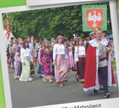
...i uczniowie z SP w Matysówce