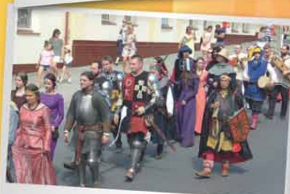
...rycerze i dwórki