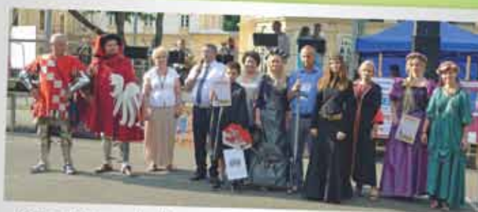
Organizatorzy pikniku z przedstawicielami SP w Kielnarowej (zwycięzcą turnieju „O Miecz Króla K. Wielkiego”) oraz SP w Tyczynie