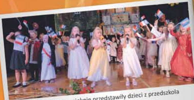
Historię Tyczyna pięknie przedstawiły dzieci z przedszkola sióstr św. Dominika