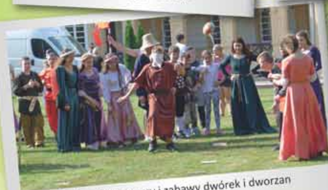
Średniowieczne gry i zabawy dwórek i dworzan