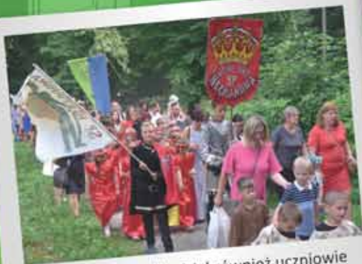
W orszaku wzięli udział również uczniowie z SP w Hermanowej...