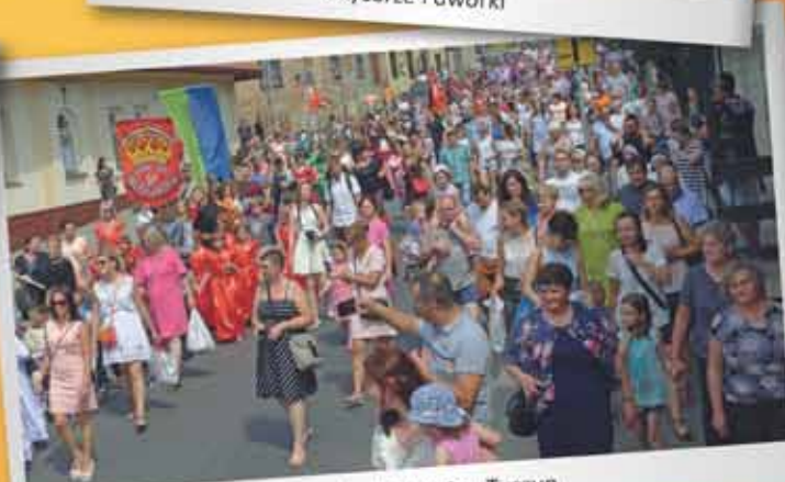
...mieszkańcy gminy Tyczyn