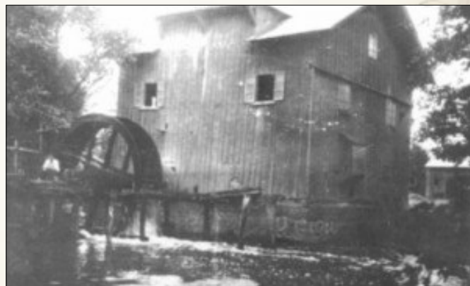
Stary młyn przy ul. Dechnika w Tarnogrodzie. Tak mógł wyglądać młyn w Tyczynie

A jak wyglądało miasto? W 1790 r. były tu 173 domy, w których mieszkało 1352 osoby. W rynku stał