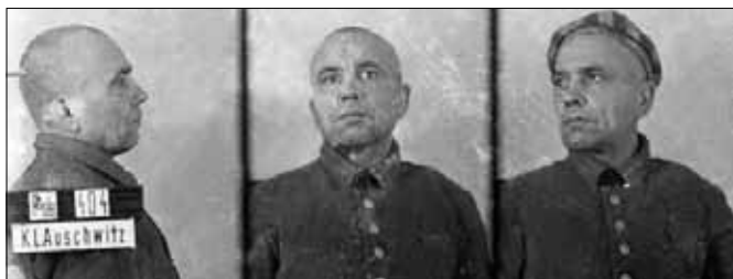
Zdjęcie J. Pietrasa z obozu Auschwitz

z zatrzymanej czterdziestki 16 z nich zginęło w obozach koncentracyjnych, 5 zginęło 3.05.1945 r. w zatopionych przez lotnictwo aliantów niemieckich statkach, 7 zostało z obozu zwolnionych, 3 uciekło, zaś 9 przetrwało do wyzwolenia. Z wywiezionych pierwszym transportem 728 więźniów wojnę przeżyło ok. 200 z nich.