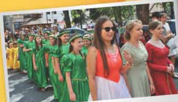
Uczniowie z SP w Borku Starym...