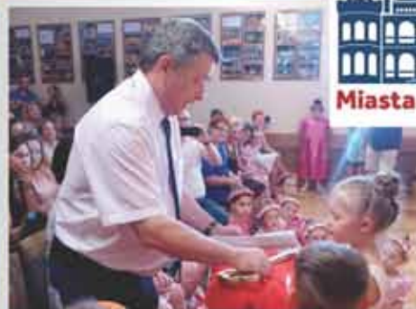
Przedszkolaki przekazują klucz do miasta Burmistrzowi Tyczyna

W przemarszu orszaku królewskiego udział wzięli m.in.: