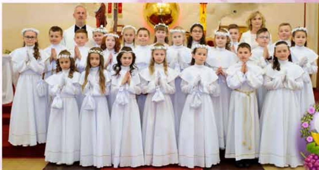
Kielnarowa, parafia pw. Wniebowstąpienia Pańskiego