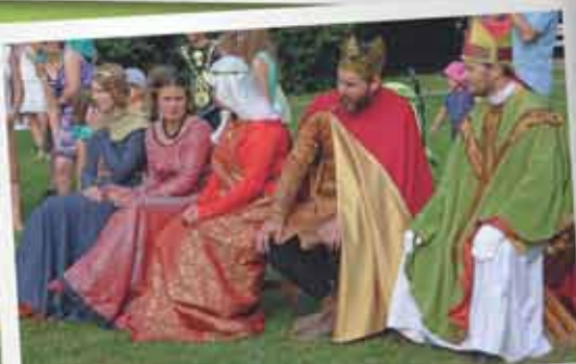
Pokazom walk rycerskich przygląda się Władysław Jagiełło z małżonką