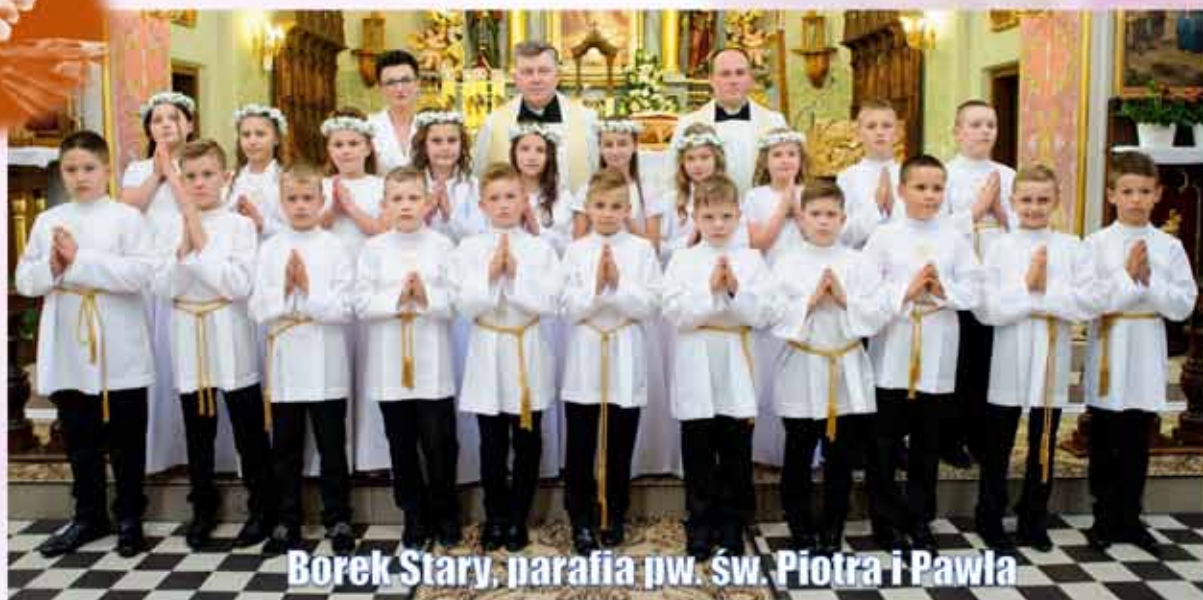
Borek Stary, parafia pw. św. Piotra i Pawła