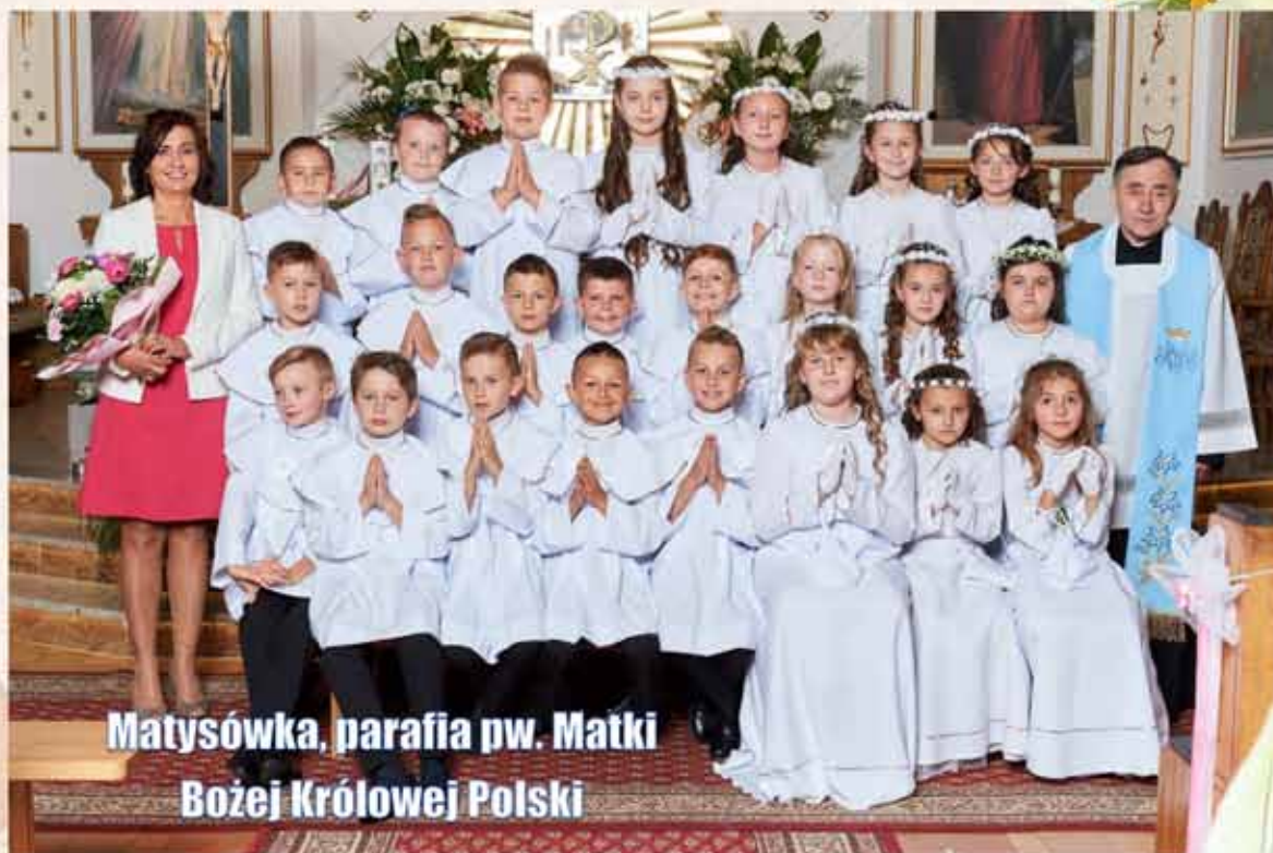
Matysówka, parafia pw. Matki Bożej Królowej Polski