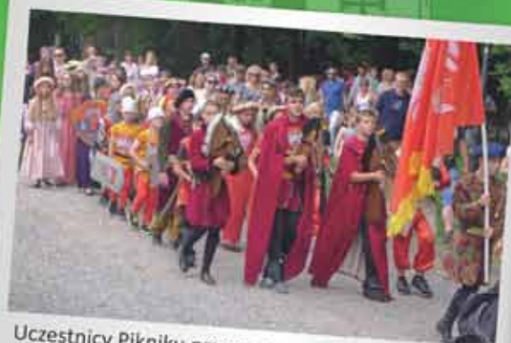
Uczestnicy Pikniku przemaszerowali z tyczyńskiego Rynku do parku