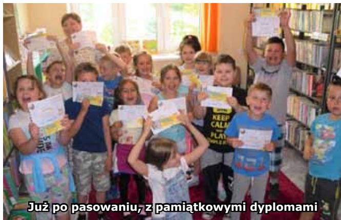
Już po pasowaniu, z pamiątkowymi dyplomami

11.05 br. do biblioteki zawitali wraz z wychowawczynią uczniowie kl. 1 SP w Hermanowej, którzy zostali przyjęci w poczet Czytelników i przyjaciół książek . W dalszej części spotkania pierwszoklasiści przygotowali prace plastyczne przedstawiające ich ulubionych bohaterów bajek.