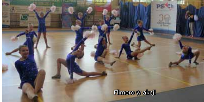
Flimero w akcji

Turniej rozrywany był w dywizjach: Cheer, Cheer Dance i Pom Dance oraz czterech kategoriach wiekowych: dzieci do 8. roku życia, junior młodszy, junior i senior. Komisja sędziowska, składająca się z członków