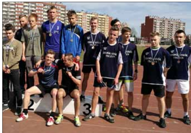
Nagrodzone zespoły w indywidualno-drużynowych biegach przełajowych. Pierwsza z prawej - drużyna chłopców z ZS w Tyczynie