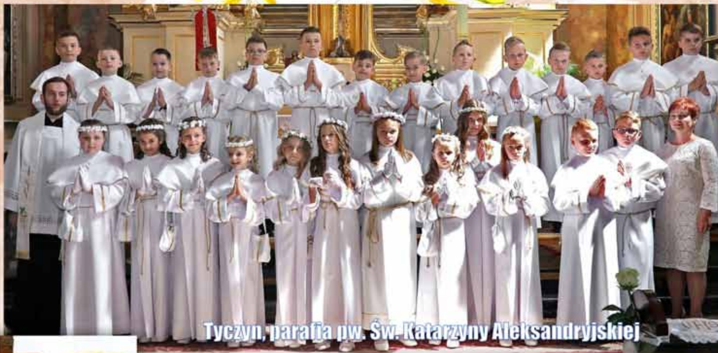
Tyczyn, parafia pw. Św. Katarzyny Aleksandryjskiej