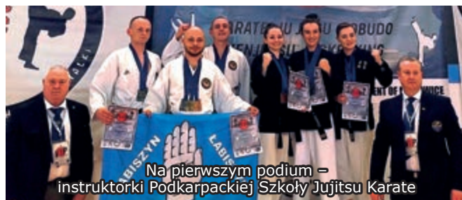
Na pierwszym podium – instruktorki Podkarpackiej Szkoły Jujitsu Karate

Ostatnią rywalizacją było kata synchroniczne, w którym dziewczyny łącząc swoje siły, pokazały się z najlepszej strony i we trzy zostały Mistrzyniami Europy.