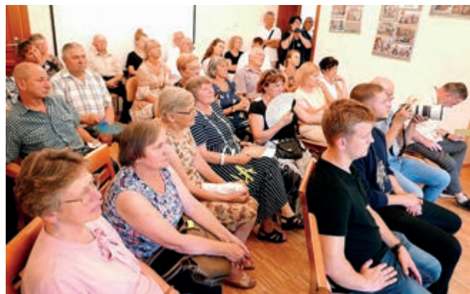
Publiczność w Saloniku Literackim

Bohater i autor spotkania, na co dzień mieszkający w Australii, swój pierwszy tomik Czas i my wydał dwa lata temu w wydawnictwie Ruthenus z Krosna. Znajdują się tu utwory bardzo wyraziste, dopracowane, o tematyce bliskiej sercu każdego z nas. Niemal w każdym utworze odczuwamy tęsknotę autora za tym, co dawno minęło. Nic zatem dziwnego, że czas w tomiku odgrywa szczególną rolę. Oprócz niego inspiracją dla autora stały się także inne tematy: wiara, miłość, ojczyzna, przyroda.