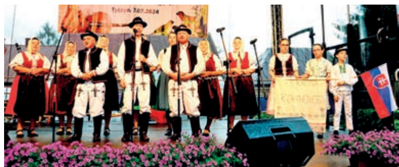
Zwieńczeniem dnia był koncert zespołów ze Słowacji – F.S. Kaliny Kolinovce...

...i zespołu FSk Folkmarčanka I oraz Kapeli Romskiej