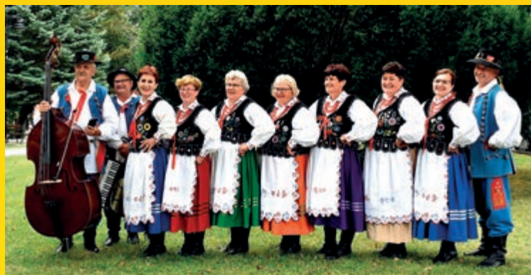
II miejsce ex aequo w kategorii zespoły z akompaniamentem – ZS Wesołe Kumoszki...