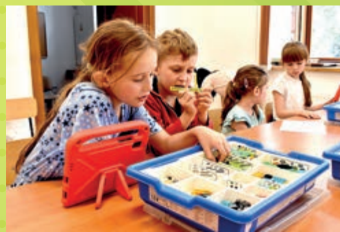
Podczas zajęć z robotyki