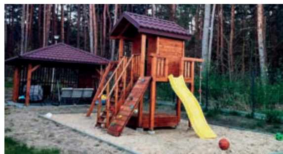
Mieszkańcy mają do dyspozycji plac zabaw i altankę

Budynek wraz z wyposażeniem jest dostosowany do wszystkich wytycznych i standardów zawartych w Rozporządzeniu Ministra Rodziny, Pracy i Polityki Społecznej z dnia 7 lutego 2024 r. w sprawie domów dla matek z małoletnimi dziećmi i kobiet w ciąży.