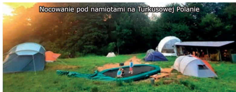
Nocowanie pod namiotami na Turkusowej Polanie

Dla części uczestników było to pierwsze, tak bliskie spotkanie z tym nieprzewidywalnym żywiołem.