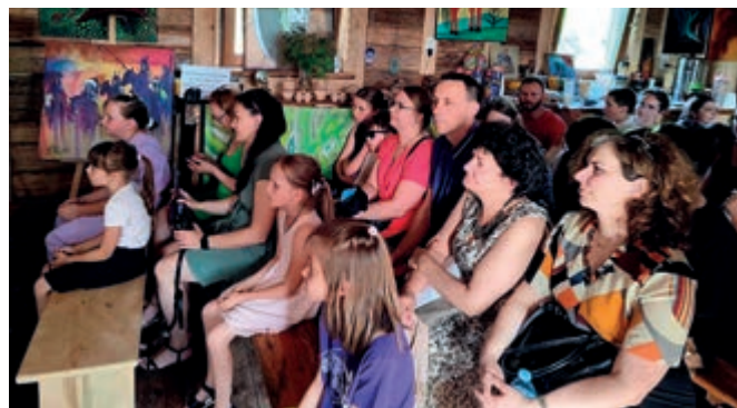
Zgromadzona publiczność w Galerii Światowid