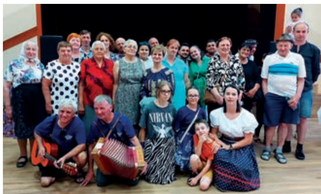
Goście ze Słowacji w DL w Kielnarowej

W niedzielę 7.07 br. zespoły słowackie uczestniczyły we mszy św. w kościele parafialnym w Tyczynie, a po południu koncertowały podczas Przeglądu. Występy grup ze Słowacji wzbogaciły lokalną scenę muzyczną i kulturalną. Publiczność miała okazję poznać nowe brzmienia oraz doświadczyć emocji związanych z muzyką śpiewaną w innym języku.