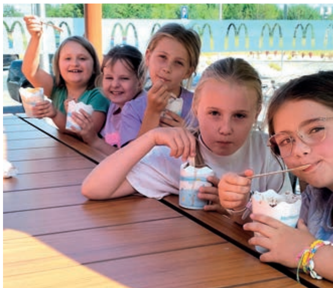
Lody na zakończenie zajęć wakacyjnych

Początkiem lipca w domach ludowych w Borku Starym i Kielnarowej odbywały się zajęcia wakacyjne. Pierwszego dnia zaplanowano warsztaty stacjonarne. Breloczki z makramy, kreatywne prace plastyczne na temat wymarzonego wakacyjnego dnia, ozdabianie wakacyjnych toreb, haft diamentowy, aktywne zabawy