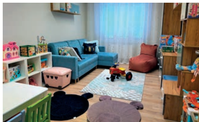
Pokój zabaw dla najmłodszych

Podstawą przyjęcia do Domu jest decyzja administracyjna o skierowaniu wydana przez dyrektora Powiatowego Centrum Pomocy Rodzinie w Rzeszowie. Skierowanie wydaje się po zgromadzeniu przez właściwy ośrodek pomocy społecznej następujących dokumentów: • wniosek osoby ubiegającej się o skierowanie do domu; • rodzinny wywiad środowiskowy; • zaświadczenie lekarskie stwierdzające brak przeciwwskazań zdrowotnych do umieszczenia w domu – w odniesieniu do wszystkich osób kierowanych do domu, a w odniesieniu do kobiety w ciąży – także dokument potwierdzający ciążę; • skrócony odpis aktu urodzenia dziecka; • orzeczenie o niepełnosprawności lub orzeczenie o stopniu niepełnosprawności (o ile osoba takie posiada); • opinia ośrodka, w którym złożono wniosek o skierowanie do domu, zawierająca uzasadnienie pobytu w domu.