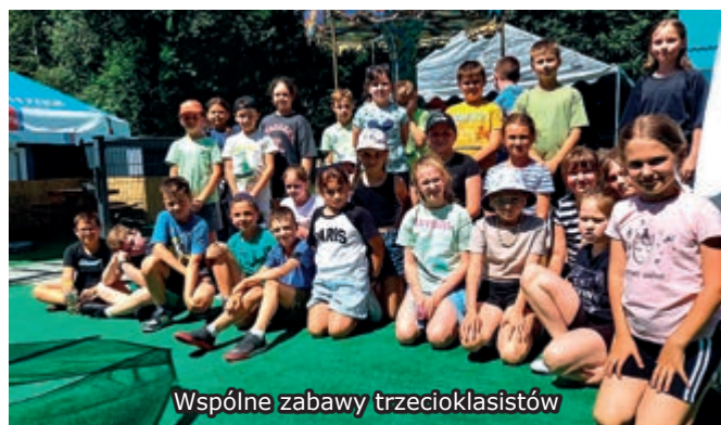
Wspólne zabawy trzecioklasistów

Uczniowie mieli okazję brać udział w licznych konkurencjach sportowych, które wymagały nie tylko sprawności fizycznej, ale również zręczności i pomysłowości. Atmosferę tego dnia dodatkowo umilał dzieciom bufet przygotowany z wielką starannością przez rodziców. Wśród wypieków i przekąsek każdy mógł znaleźć coś pysznego dla siebie.