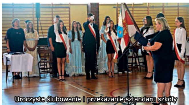
Uroczyste ślubowanie i przekazanie sztandaru szkoły