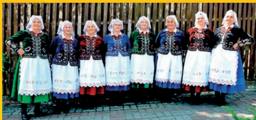
I miejsce w kategorii zespoły a capella – Zespół Śpiewaczy Lubenianki