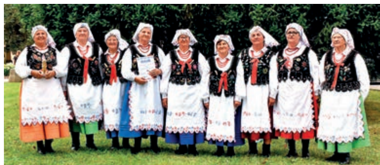
Zespół Śpiewaczy Hermanowianki