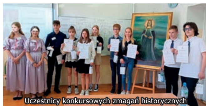
Uczestnicy konkursowych zmagani historycznych