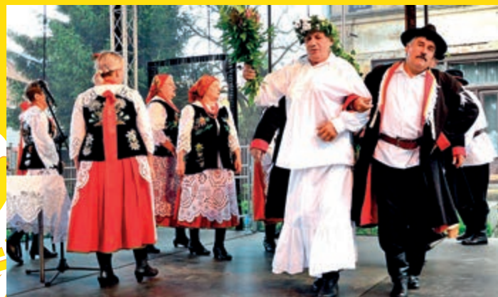
W kategorii widowiska obrzędowe nagrodę ex aequo zdobył Zespół Regionalno-Obrzędowy Grodziszczoki...