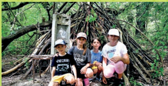
Leśne zabawy na Lisiej Górze