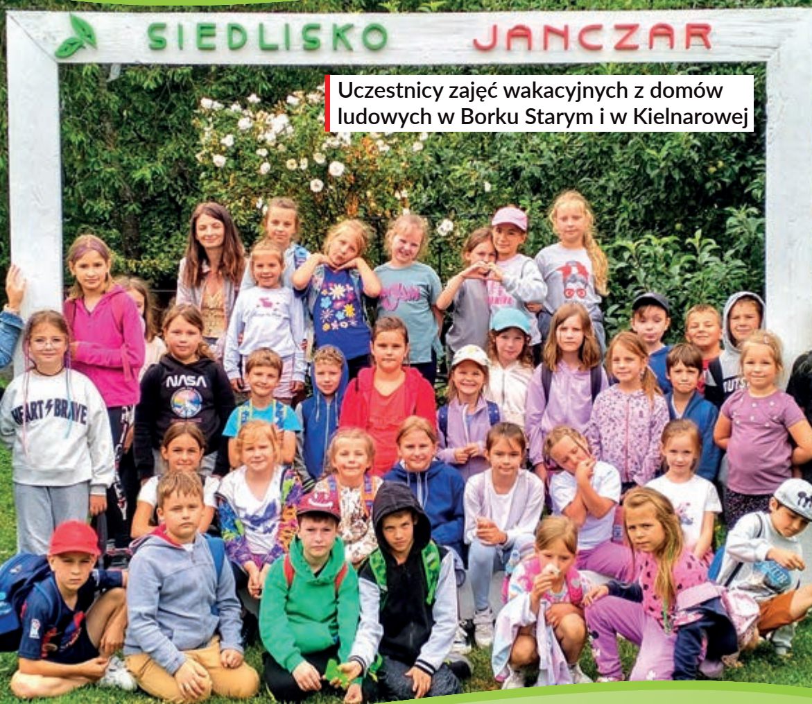
Uczestnicy zajęć wakacyjnych z domów ludowych w Borku Starym i w Kielnarowej