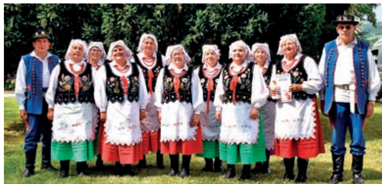
Zespół Śpiewaczy Borkowianie

wianie oraz ZS Nosowiany. • W kategorii widowiska obrzędowe nagrodę ex aequo otrzymali Zespół Regionalno-Obrzędowy Grodziszczoki oraz ZS Budziwojce.