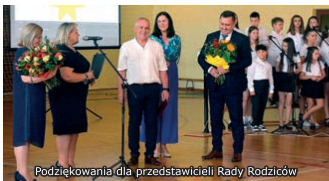
Podziękowania dla przedstawicieli Rady Rodziców

W tym roku szkolnym szczególny nacisk kładliśmy na bezpieczeństwo ogólne, czyli przestrzeganie norm i zasad BHP, bezpieczeństwo cyfrowe oraz bezpieczeństwo w ruchu drogowym. Udało się nam zorganizować spotkania i warsztaty z wieloma ciekawymi osobami, m.in. ze specjalistami z Instytutu Profilaktyki Zachowań Ryzykownych oraz z przedstawicielami Wydziału Prewencji Komendy Miejskiej Policji ( Bezpieczna droga do szkoły, Policja... nie tylko dzieciom, Cyberprzemoc, Odblaskowa szkoła, Dzień bezpieczeństwa w ruchu drogowym ).