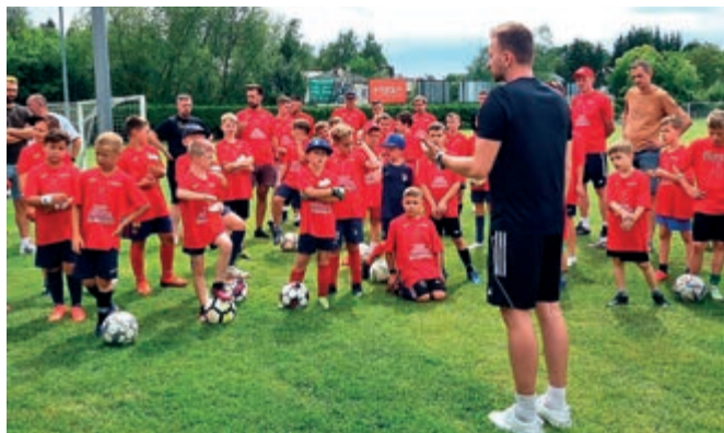
Półkolonia dla młodych adeptów futbolu