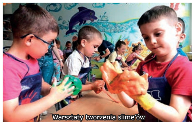
Warsztaty tworzenia slime'ów

ale był także nauką cierpliwości i skupienia u dzieci oraz aktywizacją ich pomysłowości. Był również doskonałą okazją do rozwoju zmysłu dotyku. Dzieci z zaangażowaniem zginały, ścisnęły i rozciągały swoje masy, eksperymentując z różnymi teksturami i konsystencjami.