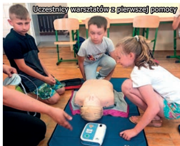
Uczestnicy warsztatów z pierwszej pomocy

Bezpieczeństwo na wyciągnięcie ręki. W naszej szkole stawiamy na bezpieczeństwo i zdrowie naszych uczniów, dlatego klasa III wzięła udział w warsztatach z pierwszej pomocy. Podczas zajęć uczniowie mieli okazję nauczyć się, jak prawidłowo reagować w sytuacjach zagrożenia życia. Spotkania prowadzone były przez wykwalifikowanego instruktora, który w przystępny sposób przekazał wiedzę na temat podstawowych czynności ratujących życie.