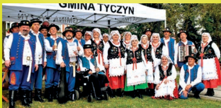
Na fotografii przedstawiciele nagrodzonych zespołów, członkowie jury, organizatorzy wydarzenia wraz z burmistrzem Tyczyna