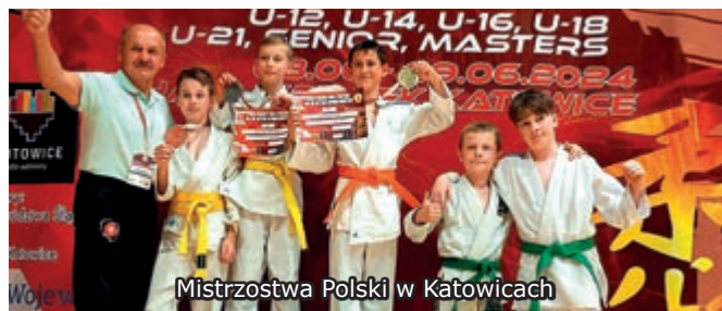
Mistrzostwa Polski w Katowicach