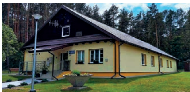
Dom znajduje się w pobliżu lasu

Dom położony jest w pobliżu lasu, co daje poczucie bezpieczeństwa, schronienia i ciszy jego mieszkańcom. Ma charakter kameralny, dzięki czemu panuje w nim atmosfera zbliżona do domowej. Budynek jest przeznaczony dla 12 osób. Każda z przebywających u nas rodzin ma do dyspozycji jedno z czterech mieszkań składających się z kuchni, łazienki oraz pokoju dziennego. Dysponujemy również pomieszczeniami wspólnymi do pobytu dziennego dla mieszkańców z dziećmi (świetlica, pokój zabaw, pokój terapeutyczny). Dom otoczony jest ogrodem, w którym można spędzać czas ze swoimi pociechami.