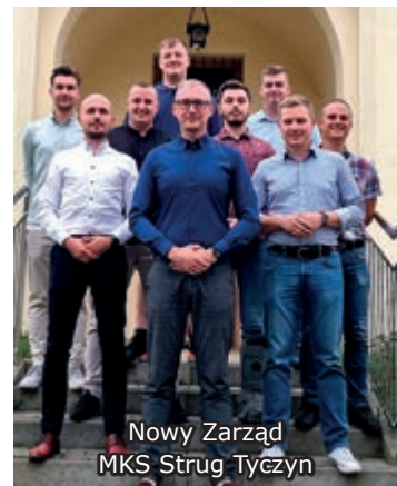
Nowy Zarząd MKS Strug Tyczyn