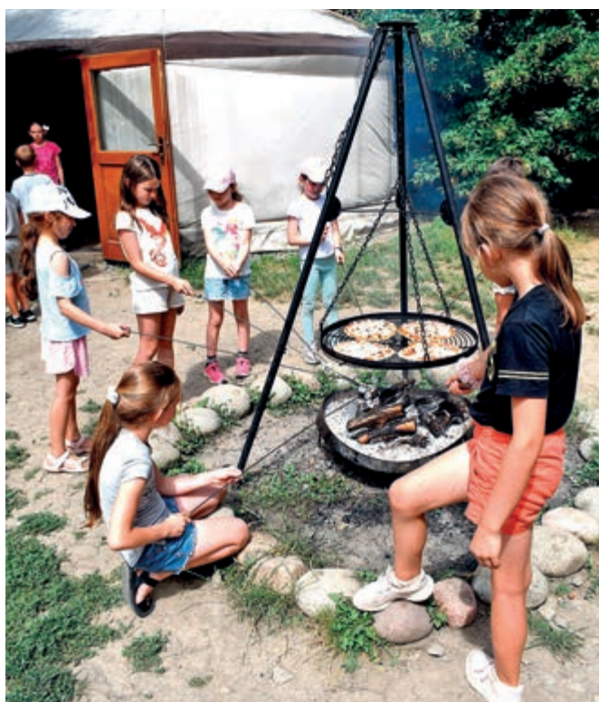
Pieczemy nasze pizze na ognisku