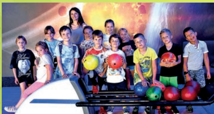
Wjazd do kręgielni