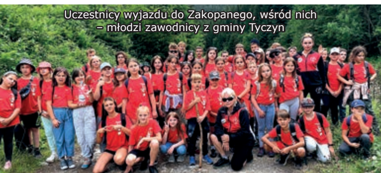
Uczestnicy wyjazdu do Zakopanego, wśród nich – młodzi zawodnicy z gminy Tyczyn

Informujemy, że w dniach 7–13.07 br. odbył się wyjazd dla dzieci z naszego klubu MUSK Sparta Rzeszów do Zakopanego. W wydarzeniu wzięło udział 50 naszych podopiecznych w wieku 8–15 lat. Jesteśmy bardzo szczęśliwi, że co roku możemy zabierać dzieci w Tatry, gdzie mają okazję poznać piękno górskiego krajobrazu i aktywnie spędzać czas.