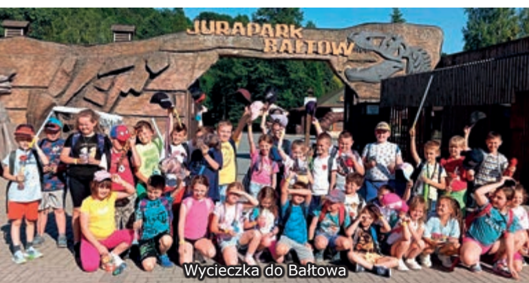
Wycieczka do Bałtowa

Wycieczka do Bałtowa dostarczyła nam niezapomnianych przeżyć. Wróciliśmy zmęczeni, ale szczęśliwi. Była to dla nas nie tylko wspaniała zabawa, ale również doskonała okazja do poznania historii Ziemi i jej prehistorycznych stworzeń.