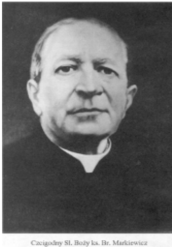
Czcigodny Sł. Boży ks. Br. Markiewicz

Chciałbym przybliżyć czytelnikom „GT” osobę ks. Bronisława Markiewicza, czyniąc to jako wyraz wdzięczności za wiel-