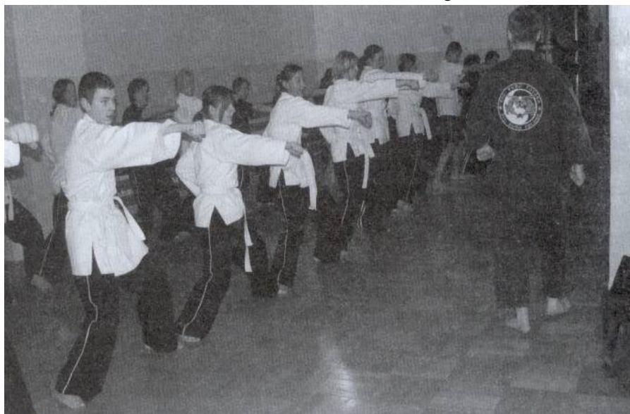
Podczas treningu wschodnich sztuk walki

i stopniowego przygotowania się do matury, uczestniczą w wielu zajęciach pozalekcyjnych: treningi sztuk walki (karate, kung-fu), basen (Nowa Wieś k. Trzebowniska), obozy sportowe (sportów walki i narciarski), nauka dodatkowych języków obcych (j. rosyjski, j. hiszpański), kółka przedmiotowe itp. Część zajęć sportowych odbywa się w hali WSiIZ. Pobyt w szkole to jednak także różnorodne rozrywki. Rok szkolny rozpoczęliśmy obozem integracyjnym. W ciągu I semestru uczniowie wie-