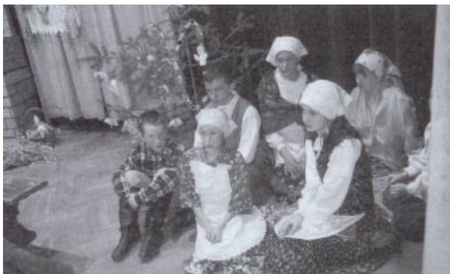
Dzieci z Szufnarowej w widowisku „Wigilia”