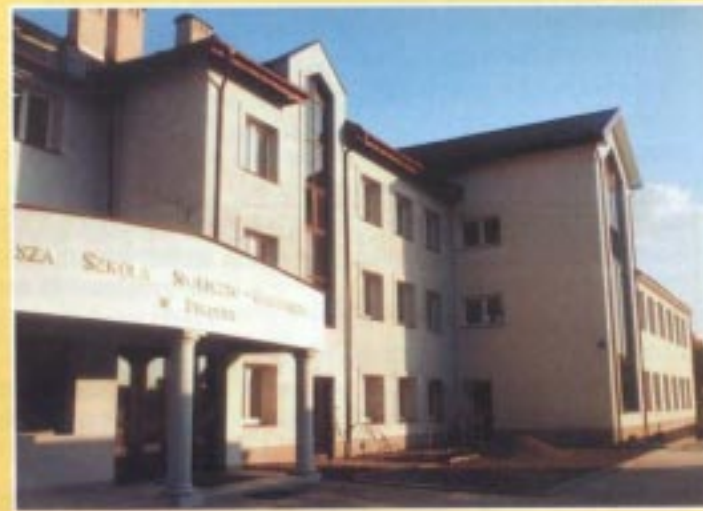
Budynek dawnego Sądu Grodzkiego, obecnie WSSG, stan w 1995 r. i obecnie