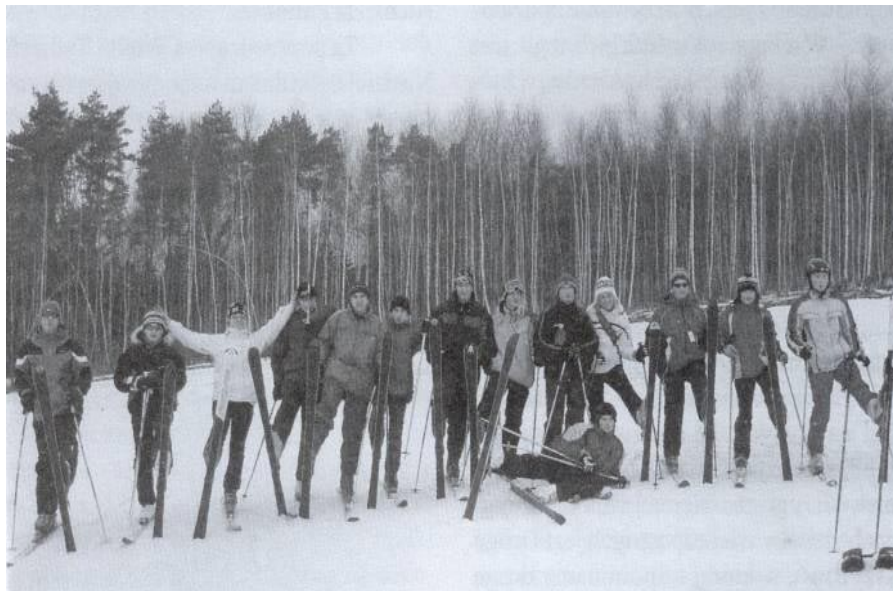
Na obozie narciarskim

lokrotnie uczestniczyli w rozmaitych zawodach sportowych - jako zawodnicy (zdobywając m.in. mistrzostwo powiatu w siatkówce) oraz jako kibice (wyjazd na