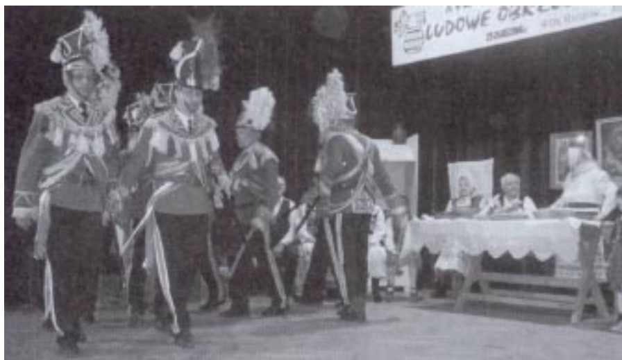
Z „Grodziszczokami” na przegląd przyjechał także oddział Turków

Większość zespołów prezentowała ciekawe, starannie przygotowane widowiska, oparte na folklorze własnej wsi,