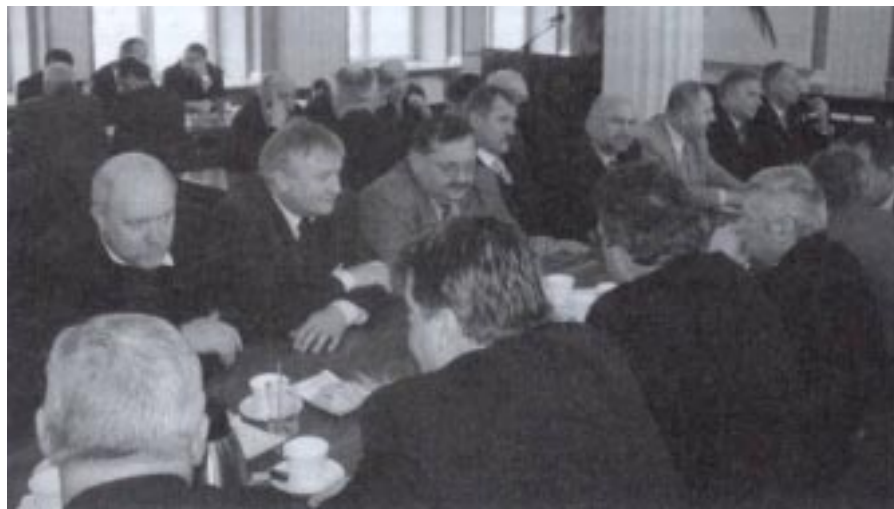
Przedstawiciele samorządów w sali kolumnowej Podkarpackiego Urzędu Wojewódzkiego w oczekiwaniu na wręczenie promes

Z rezerwy budżetowej państwa największą pomoc otrzymali: