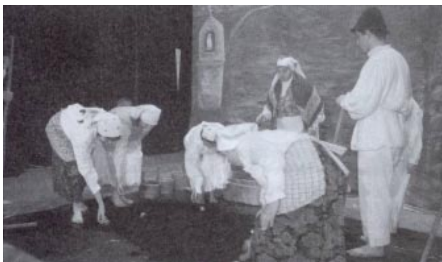
Zespół „Tkacze” pokazał zwyczaj „turlania” pisanek po polu, na którym siany będzie len

z użyciem autentycznych akcesoriów obrzędowych dawnych narzędzi, sprzętów i strojów. Jak stwierdziło jury, liczba zespołów biorących udział w konkursie