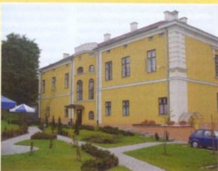
Budynek dawnego Sądu Grodzkiego, obecnie WSSG, stan w 1995 r. i obecnie